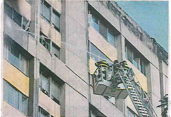
El intento de despojo se registró ayer por la madrugada en el Edificio Ignacio Ramírez.

“Gracias a la oportuna atención a una denuncia por el despojo de un departamento en Tlatelolco, compañeros de Bomberos y de la SSC trabajaron juntos para sofocar el incendio provocado por dos sujetos que fueron detenidos después de haberse atrincherado al interior”, detalló Vázquez.