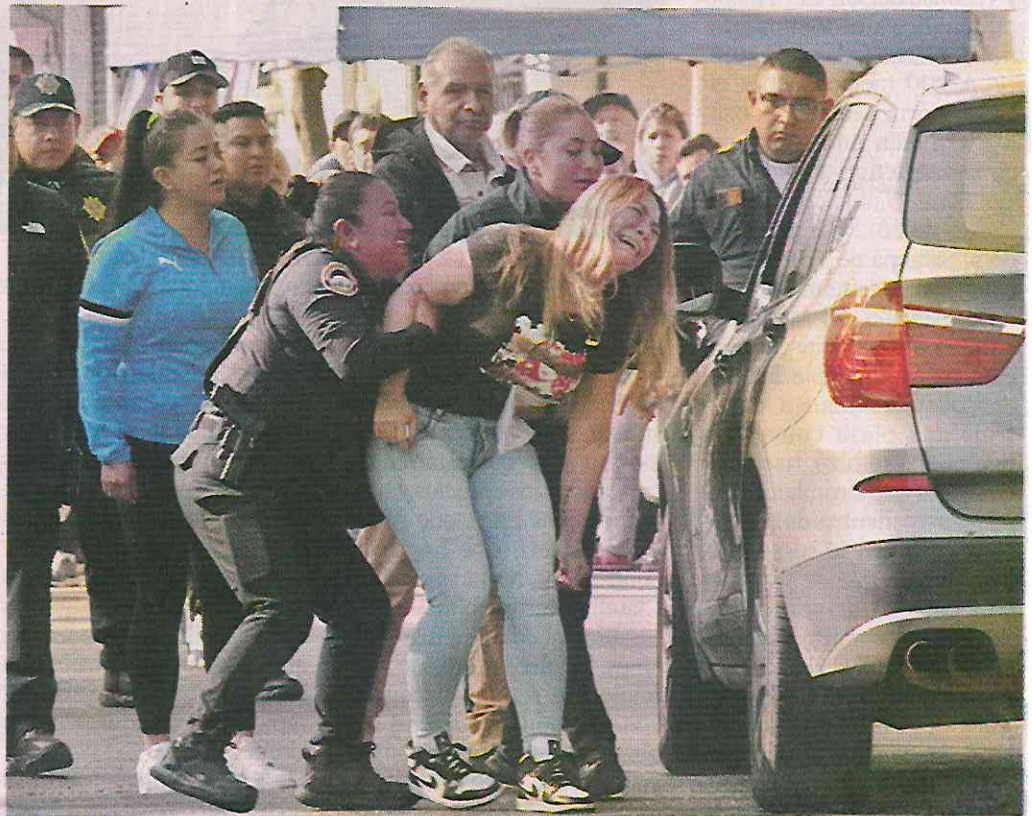
LAMENTO. Una familiar se acercó hasta la puerta de la camioneta de alta gama, que tenía el cuerpo a bordo, pero las agentes la retiraron.