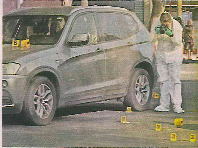
■ En los cristales quedaron las marcas de los impactos y en el pavimento, los casquillos.

Al lugar llegaron familiares del fallecido y una mujer, desesperada por saber qué ocurrió, se aproximó