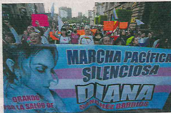
LUIS CAMACHO. EL UNIVERSAL

El contingente siguió su paso al Zócalo donde pronunciaron unas palabras y oficiaron una misa frente a la Catedral Metropolitana con lo que culminó la protesta. ●