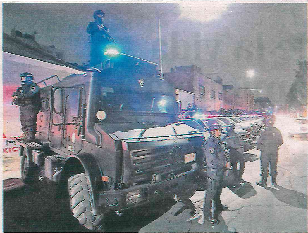
En el lugar participaron 350 elementos de diferentes agrupamientos para blindar las zonas más