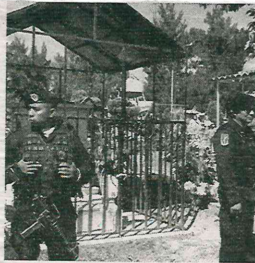
El objetivo es garantizar la seguridad