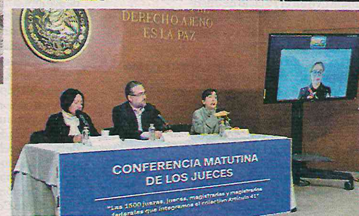
Protesta en San Lázaro y contra mañanera. A. PÉREZ Y R. MOSSO

Durante su participación en la sexta contra mañanera, la jueza segundo de Distrito del Centro Auxiliar de la quinta Región, en Culiacán, señaló que es necesario