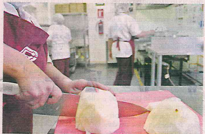
En días festivos, también se preparan platillos acorde a las fechas a celebrar.