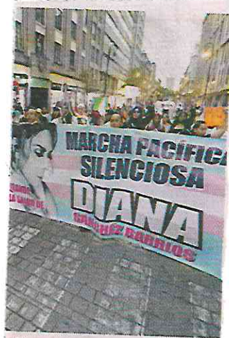
El contingente hizo una parada en el sitio donde ocurrió el atentado.

“Tenemos miedo que nos arrebaten la vida; exigimos de forma pacífica al Gobierno que nos ayude a encontrar a los culpables”.