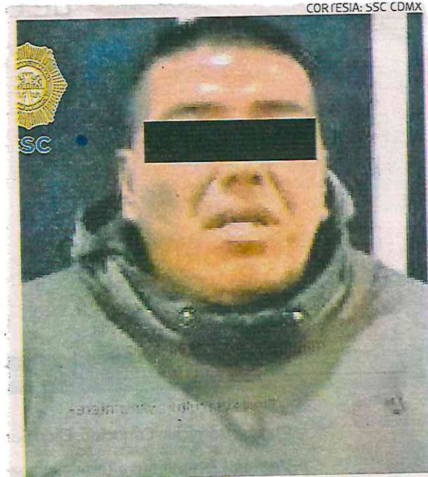
El detenido será investigado por el feminicidio