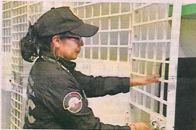
Entre las principales causas por las que ingresan a este Centro está no pasar la prueba del alcoholímetro.

El Torito fue inaugurado el 28 de octubre de 1958 para salvaguardar los principios procedimentales que aseguren la administración de justicia.