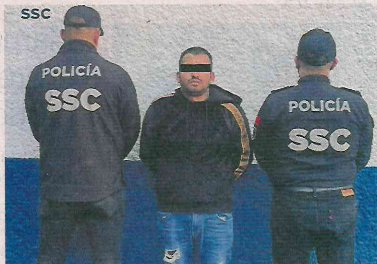
El Chaneque es identificado como el líder de una célula delictiva que opera en Cuauhtémoc e Iztacalco.

"Resultado de trabajos de investigación y en seguimiento a una denuncia por el secuestro exprés de un menor de edad ocurrido en febrero pasado, compañeros de