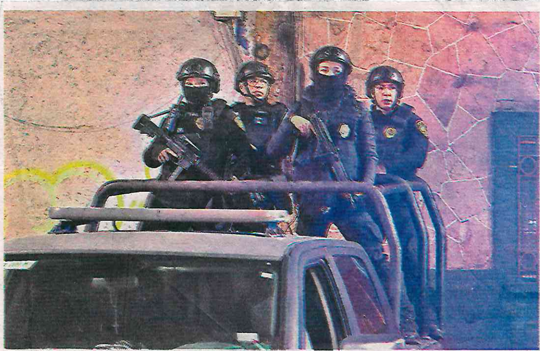
Para las autoridades hay siete cuadrantes que son prioritarios, por lo que se establecieron dos