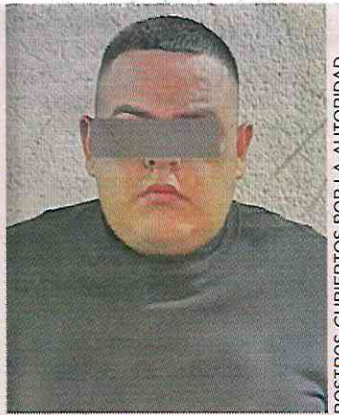
ROSTROS CUBIERTOS POR LA AUTORIDAD

■ Un hombre ofreció dinero a los policías para evitar la captura del conductor, quien iba armado, pero ambos fueron detenidos.