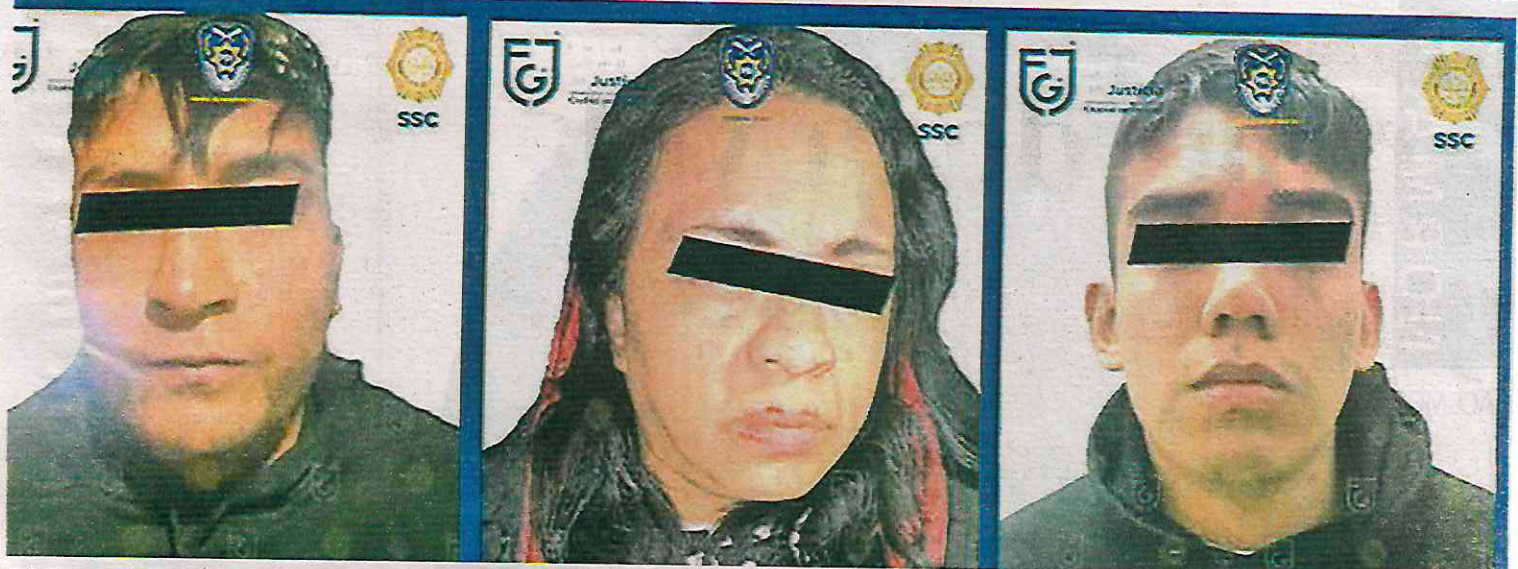
A los tres detenidos se les imputó el delito de narcomenudeo y se les fijó continuación de audiencia para el próximo 30 de octubre, y se les imputó prisión preventiva

La noche de este viernes, en un operativo coordinado entre ambas instituciones, se logró el aseguramiento en flagrancia de dichas personas, por la posible comisión de un delito diverso, por lo que fueron puestas a disposición del Ministerio Público.