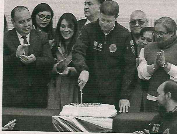
Ayer partieron el pastel en este centro de sanciones