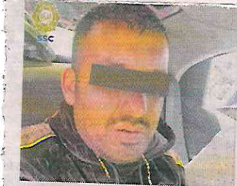
ROSTRO CUBIERTO POR LA AUTO

Por otra parte, según investigaciones, El Chaneque es identificado como líder de una célula delictiva dedicada a la extorsión y narcomenudeo con operaciones en la Alcaldía Iztacalco.