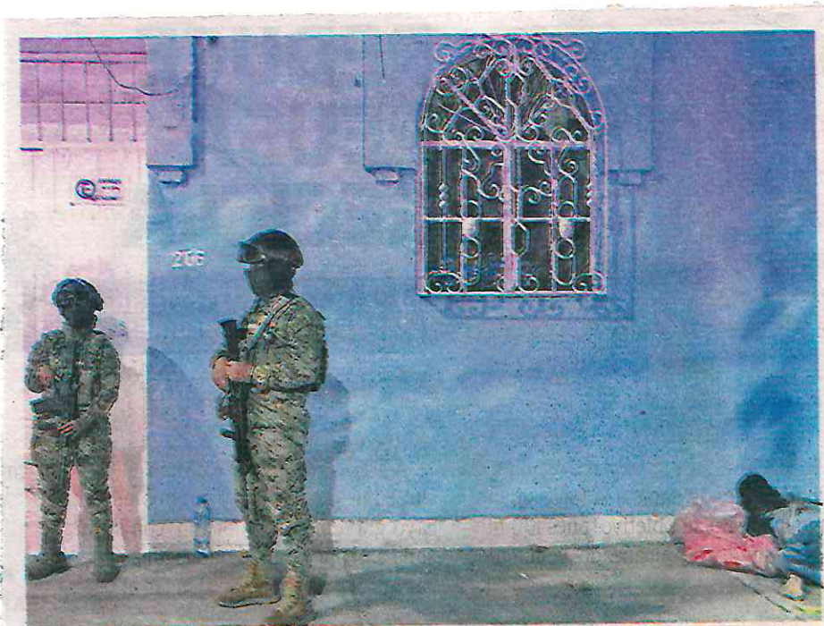
unidades por cada cuadrante para reforzar la vigilancia