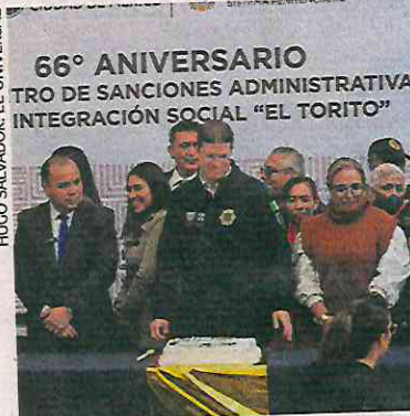
El titular de la SSC destacó la labor de El Torito durante 66 años.