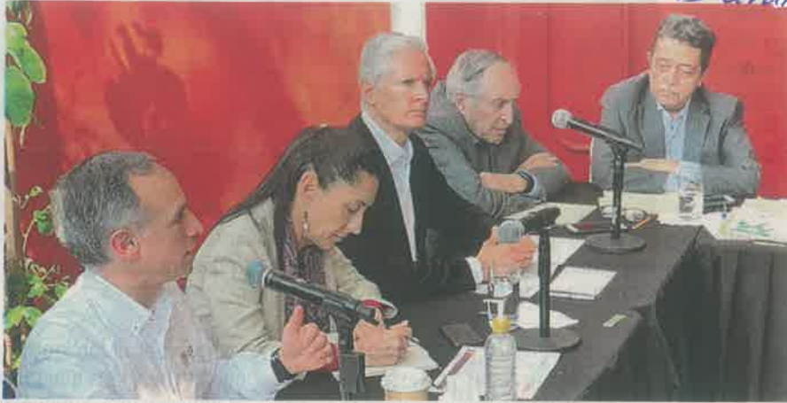
La jefa de gobierno de la CDMX, Claudia Sheinbaum, y el gobernador del Estado de México, Alfredo del Mazo, se dijeron comprometidos con la salud de sus gobernados ante la pandemia