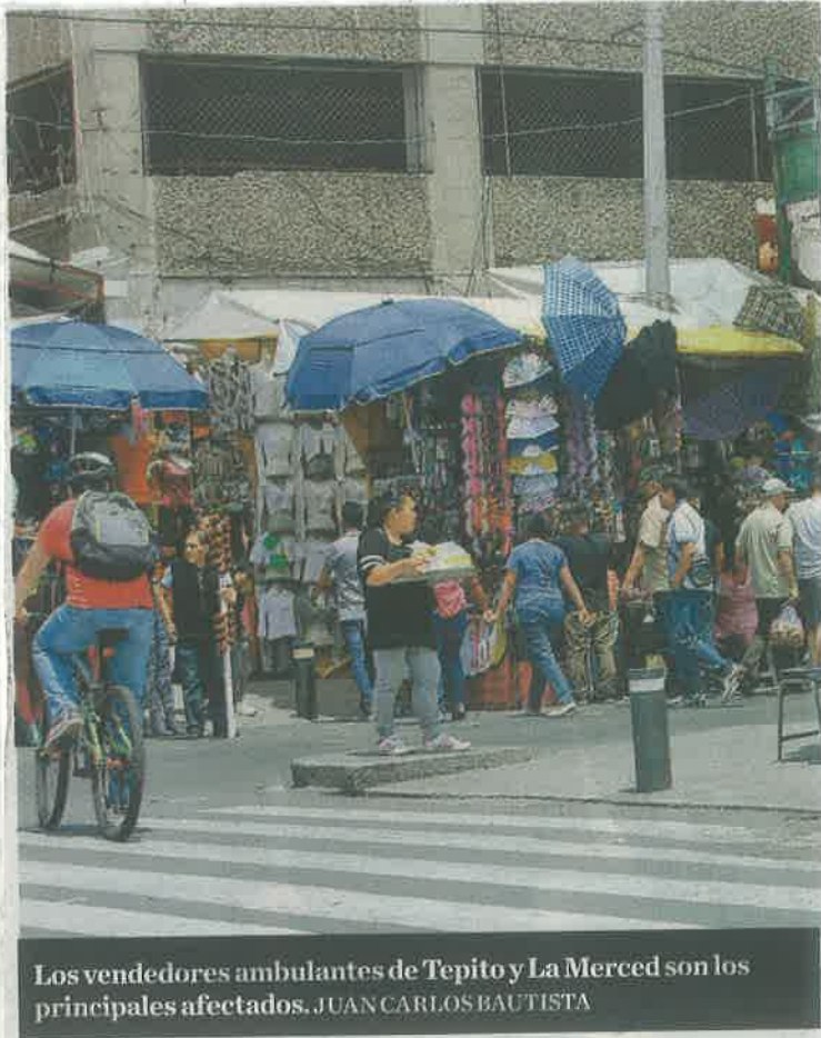
Los vendedores ambulantes de Tepito y La Merced son los principales afectados. JUAN CARLOS BAUTISTA

Respecto a las denuncias, son unas cuantas las que están en la FGJ, ya que casi la totalidad de los afectados rehúsan presentar quejas ante el MP porque en los últimos tres años al menos 12 líderes de comerciantes del Centro Histórico fueron asesinados por exponer casos de extorsión.