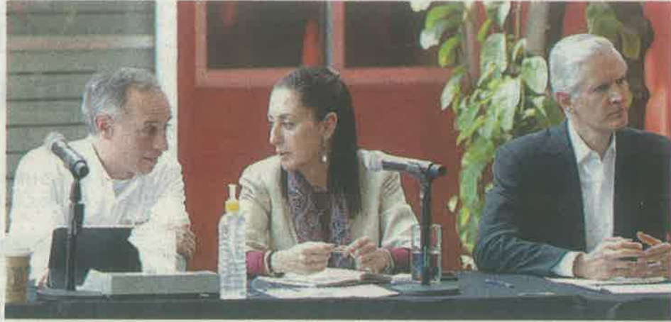
Instalan Comité Metropolitano