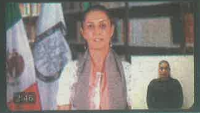
Llama a no difundir mentiras

Mensaje importante sobre el Covid-19 hoy jueves 19 de marzo.