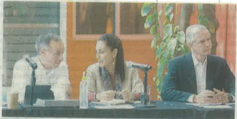
Hugo López-Gatell, subsecretario de Promoción de la Salud; Claudia Sheinbaum, jefa de Gobierno, y Alfredo del Mazo, gobernador del Edomex.

El subsecretario López-Gatell Ramírez destacó que es fundamental armonizar los planes en materia sanitaria, ya que adelantarse permitirá una reducción significativa de contagios y mejorará la capacidad de respuesta de los servicios de salud. ●