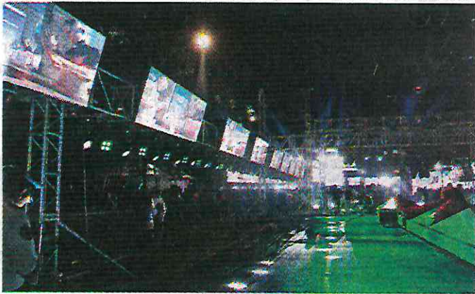
Más de 54 pantallas formarán parte del espectáculo del sonido Polymarchs, que desde el domingo realizaba pruebas.