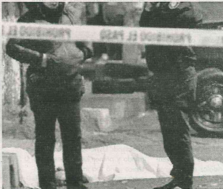
Se presume que se trató de un crimen pasional

El responsable del feminicidio fue captado en imágenes y ya es buscado por las autoridades.