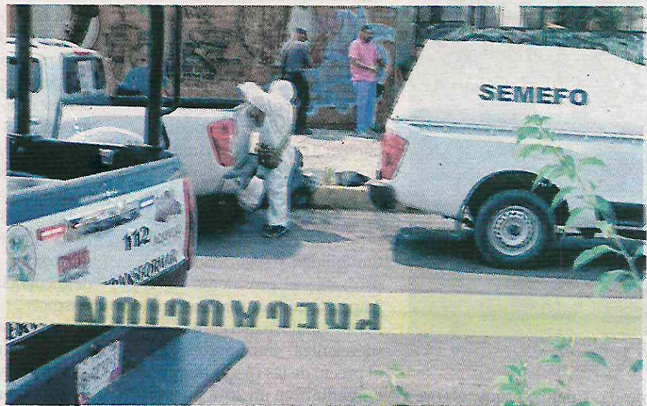
Sangriento resultó el último fin de semana del año

en acciones coordinadas del Gabinete de Seguridad se llevaron a cabo detenciones, cateos, aseguramientos de armas de fuego y de distintos tipos de droga en: Ciudad de México, Guerrero, Sinaloa, Sonora, Tamaulipas, Veracruz, Colima, Jalisco, Nayarit, Puebla, Quintana Roo, Chiapas, Chihuahua y Durango.