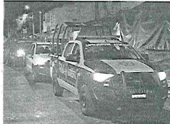
Los vecinos también reconocen que algunos mandos han logrado identificar a los policías municipales que delinquen.