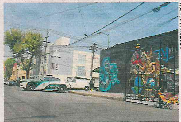
Las jóvenes de los grupos criminales se disputan calles o puntos sin que intervengan líderes, indican fuentes.

A estas acciones, sumó a la Policía Auxiliar al reforzamiento de seguridad, según reportes policiales. ●