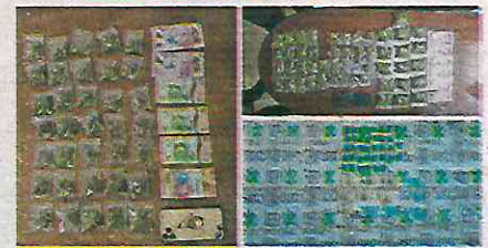
Les encontraron aparente narcótico, además se realizó la revisión de 150 motocicletas.

actuación policial, asimismo, les leyeron sus derechos constitucionales y, junto con lo asegurado, los pusieron a disposición del agente del Ministerio Público, quien determinará su situación legal.