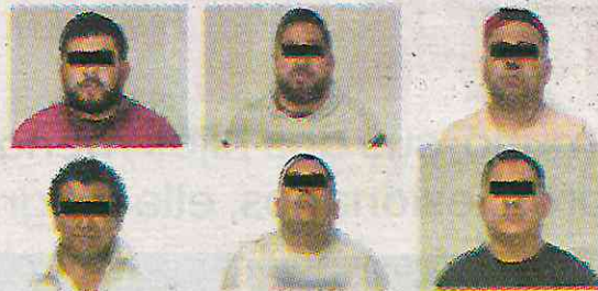
Se les apareció El Chamuco

El robo del coche sucedió cuando la víctima transitaba en su coche, color gris, por la calle Azotziles y su esquina con Quitches, de la colonia Tlalcoligia, en Tlalpan. Des-