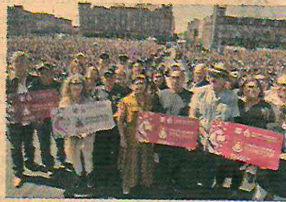
En el Zócalo capitalino la mandataria los convocó a convertirse en los mejores aliados en la lucha contra la violencia hacia la mujeres.

Ante más de 30,000 beneficiarios reunidos en el Plaza de la Constitución, la mandataria capitalina destacó que la Pensión Hombres Bienestar es de acceso universal, además es complemento de la Pensión Universal para Adultos Mayores y forma parte de la amplia política social que iniciaron Andrés Manuel