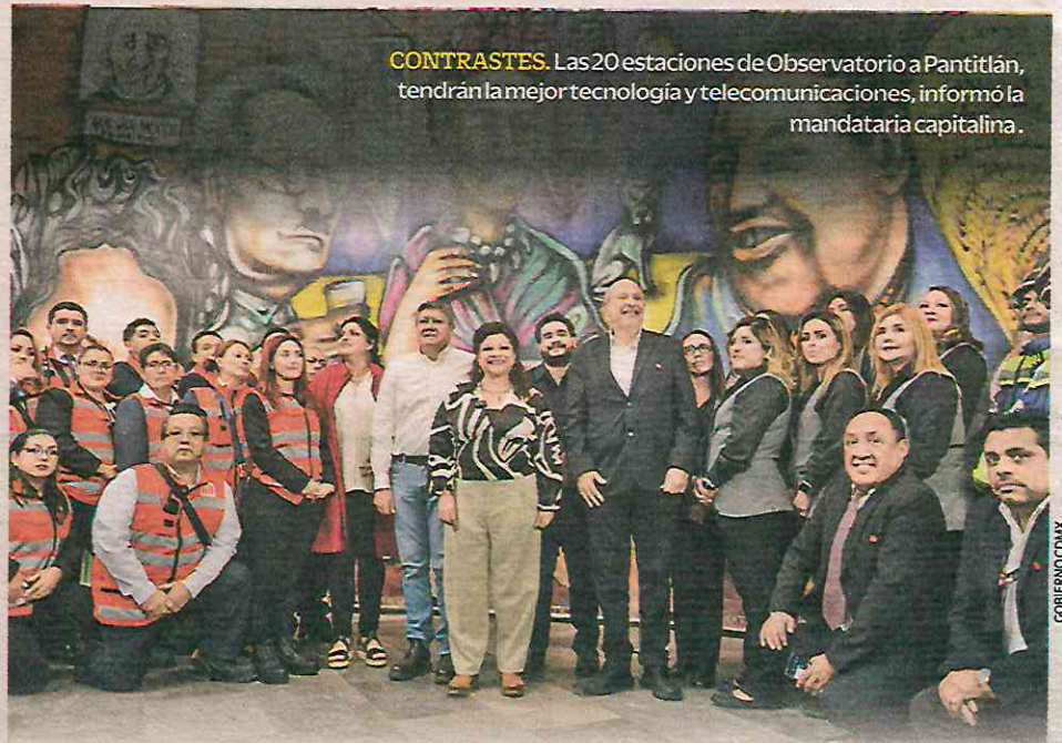
CONTRASTES. Las 20 estaciones de Observatorio a Pantitlán, tendrán la mejor tecnología y telecomunicaciones, informó la mandataria capitalina.

200 cámaras de vigilancia tendrá la Nueva Línea 1, esto como parte de los trabajos de su remodelación