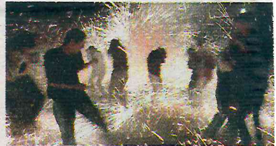
· Quienes incumplan enfrentarán sanciones

Las autoridades advirtieron que quienes incumplan la disposición enfrentarán sanciones tanto administrativas como legales, de acuerdo con la normativa vigente. La decisión fue tomada después de que, el 24 de diciembre, se registrara un incremento en los niveles de contaminación atmosférica, atribuida a la quema de pirotecnia. Esto llevó a la Comisión Ambiental de la Me-