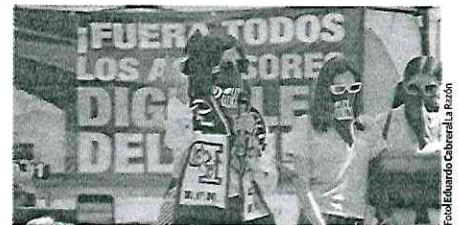
VÍCTIMAS de Diego "N" dan un mensaje, el 4 de diciembre.

MIL imágenes editadas con IA tenía Diego "N" en un dispositivo móvil