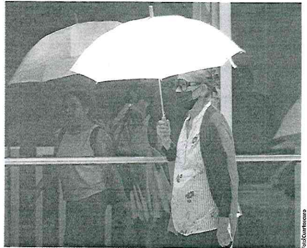
UNA mujer usa cubrebocas y se cubre del sol en la primera ola de calor en mayo.

Los datos del informe muestran que desde hace un sexenio, los ciudadanos respiran aire contaminado más de la mitad del año, pues en 2020 la contaminación se hizo presente 263 días, en 2021 se