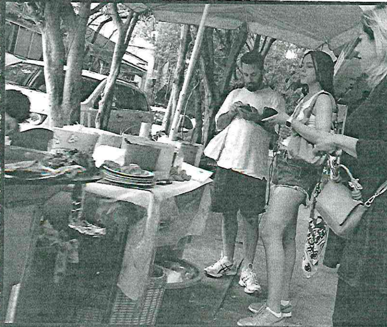
La reforma aprobada por el Congreso de la CDMX en 2024 señala que quienes rentan vivienda por plataformas digitales solo pueden ofertar sus espacios el 50 por ciento de las noches del año

Hay que pensar en otra legislación más eficaz, que esté elaborada con la experiencia de otras ciudades que ya han implementado regulaciones. Había que escuchar a las ciudades que han buscado defender el derecho a la población de una vivienda”