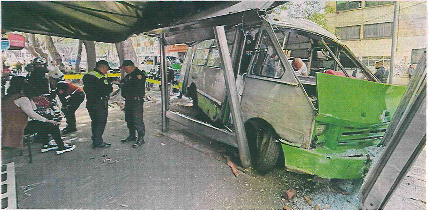
IBAJANI! La unidad de transporte público impactó contra un árbol y luego se estrelló en la estructura de un parabús.