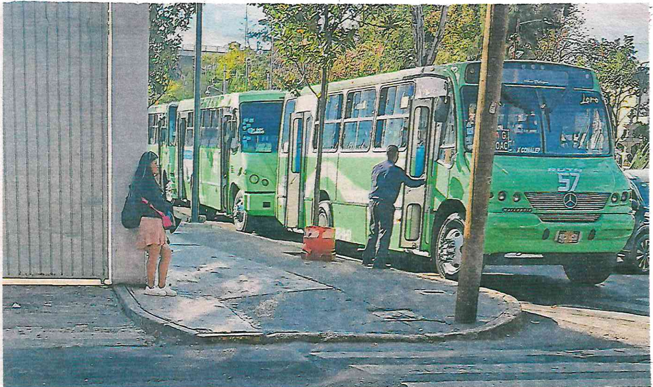
Las unidades ocupan las calles aledañas al metro Mixcoac aunque no cuentan con permiso para ello

En 2022 la Secretaría de Movilidad anunció que extinguiría la concesión de la ruta tras las constantes quejas sobre el servicio