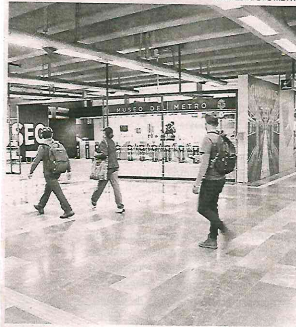
El museo es gestionado por el área de Cultura del STC