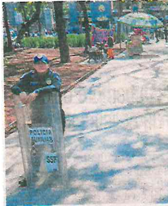
Policías y ambulantes conviven en unos cuantos metros.