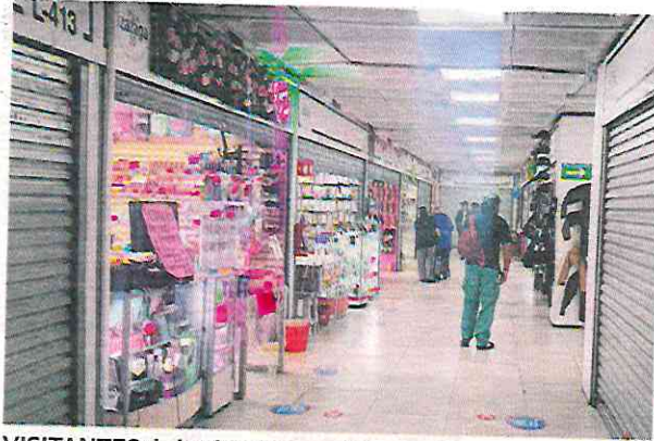
VISITANTES de la Plaza Izazaga 38, en el Centro Histórico, buscan distintos productos.