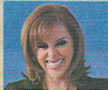
Marisela Morales ■ Procuradora en el Gobierno de Felipe Calderón.

Entre las aspirantes a cargos judiciales mencionadas por Fernández Noroña por tener “pase directo”, se encuentran: