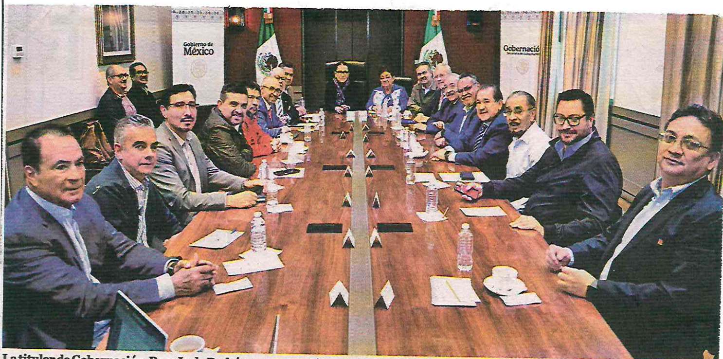
La titular de Gobernación, Rosa Icela Rodríguez, se reunió con el titular del instituto, Octavio Romero, y líderes sindicales.

Los nueve despachos que llevaron juicios masivos en el juzgado 60 de lo Civil recibieron ese monto a lo largo de 10 años. PAG.12