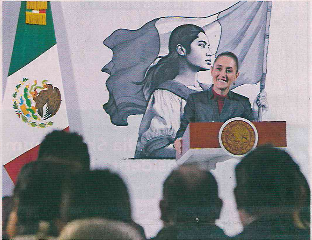
Gobierno de México

■ La Presidenta Sheinbaum duda que el Gobierno de Trump aplique nuevos aranceles a México.