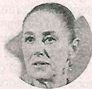
CLAUDIA SHEINBAUM Presidenta de México

Advirtió que se evalúa cambiar la estructura arancelaria con México y Canadá en el T-MEC. La de-