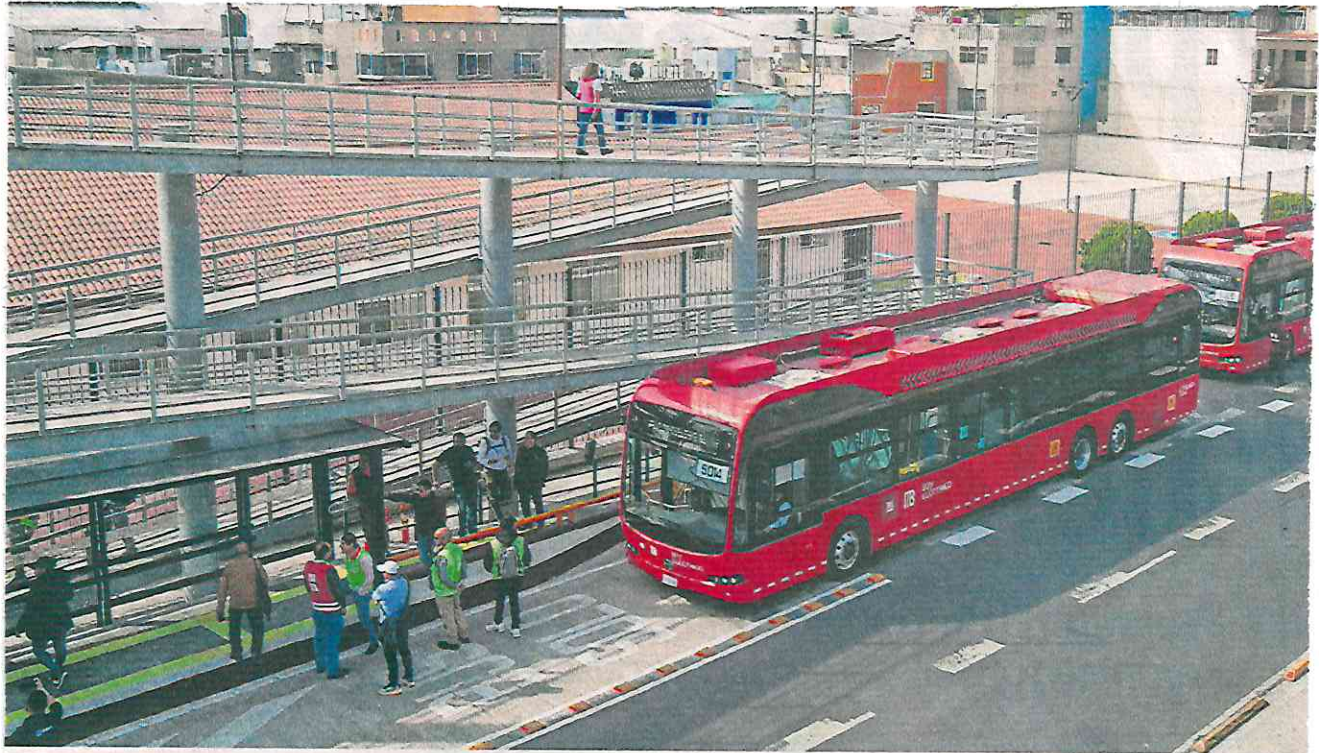
La estación Calle 6 de la Línea 4 del Metrobús fue construida en dos meses y forma parte de la ruta Hidalgo-Alameda Oriente.

“La gran mayoría [de colonos] habló de transporte; nos dijo que necesitaban una parada en este lugar y también nos dijo que necesitaban más transporte”