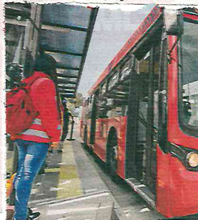
INAUGURACIÓN. La nueva parada se encuentra en la Línea 4 del Metrobús, entre Calle 6 y Río Churubusco.

“Esta propuesta significa que nos donen la mitad del predio, 5 mil metros cuadrados, para una utopía en Pantitlán y la otra parte, en los 5 mil metros restantes, construirán su vivienda”, explicó. /ÁNGEL ORTIZ