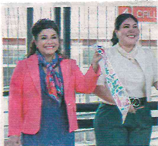
Se instalarán 3 mil 67 nuevas luminarias