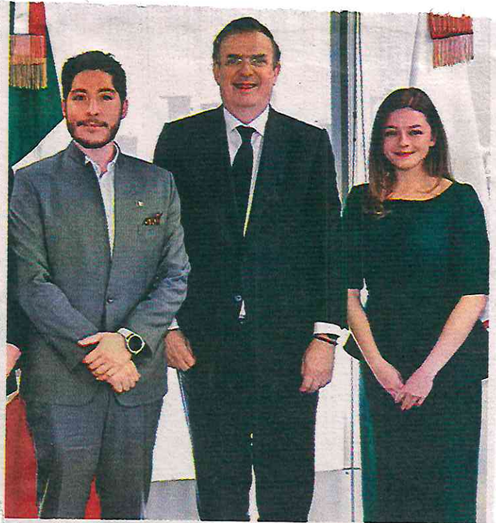
El secretario y representantes de la startup Yumari.

El titular de Economía remarcó que es falso que México sea un exportador de productos que no cumplan la regla de origen, y que si Estados Unidos quiere cambiar las reglas de origen, pues se revisarán en las negociaciones. ■