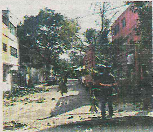
Se buscará castigar a los responsables