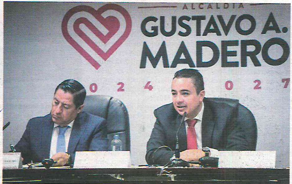
Los operativos a este tipo de establecimientos forman parte de las acciones para evitar que los jóvenes compren alcohol de forma indiscriminada.

Los operativos a este tipo de establecimientos forman parte de las acciones para evitar que los jóvenes compren alcohol de forma indiscriminada y, en su lugar, se fomentará el deporte, las actividades culturales y reforzará la educación en las escuelas.