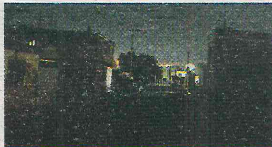
No logró colocar una tercera parte de luminarias

seguridad, de los tres órdenes de gobierno, se comprometió por medio del programa "Milpa Alta Iluminada y Segura", a dotar de luminarias a toda la alcaldía, cosa que también propuso en su primer gobierno, sin embargo, no lo logró. Los Indicadores de Resultados que transparentó Milpa Alta, entre 2019 y 2021, años en los que Rivero estuvo en su primera oportunidad al frente de la demarcación, diagnosticó que la alcaldía requería la instalación de 10 mil 250 luminarias, sin embargo, no logró colocar una tercera parte de estas.