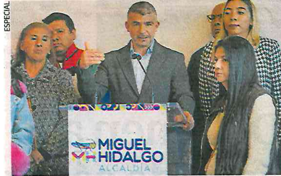
Alcalde de Miguel Hidalgo presentó iniciativa para evitar cancelación del presupuesto ciudadano.