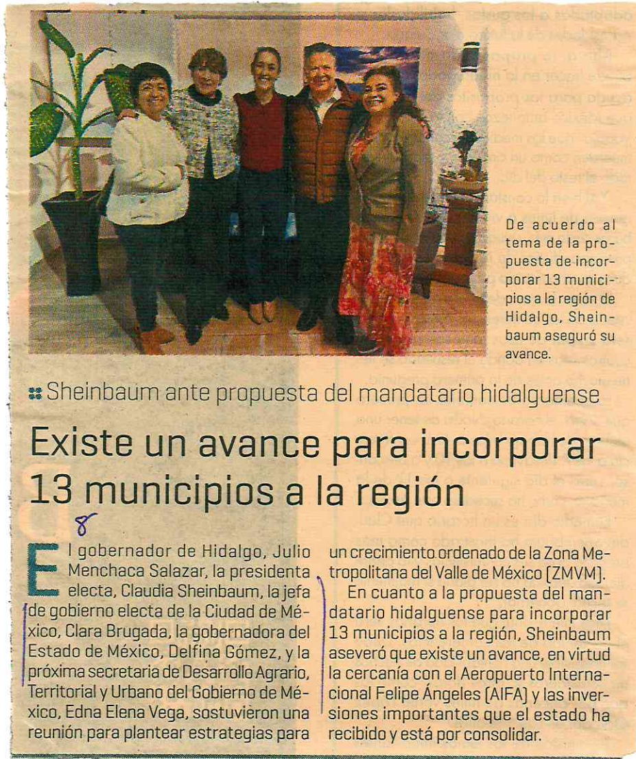
De acuerdo al tema de la propuesta de incorporar 13 municipios a la región de Hidalgo, Sheinbaum aseguró su avance.

Sheinbaum ante propuesta del mandatario hidalguense