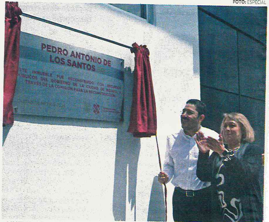
• NUEVO. El multifamiliar dañado en 2017 tuvo una gran reconstrucción: Batres.