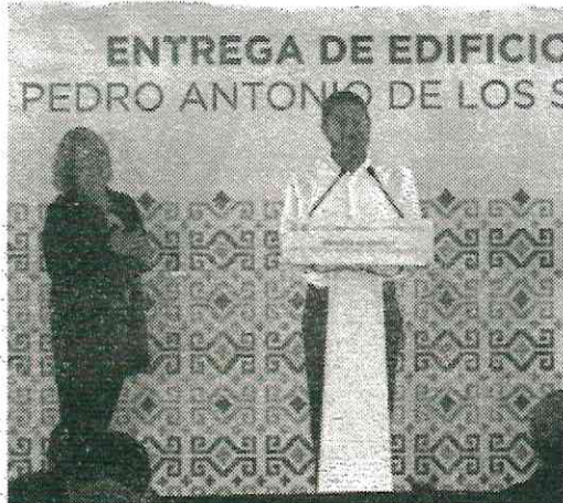
Inversión de 117 millones de pesos