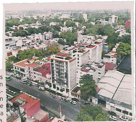
Los vecinos reconocieron que la desesperación hará que acepten la obra.

“Son 54 viviendas construidas, de esas son 36 para las familias de los damnificados y son 18 para el financiamiento del conjunto de la construcción”, dijo Batres.