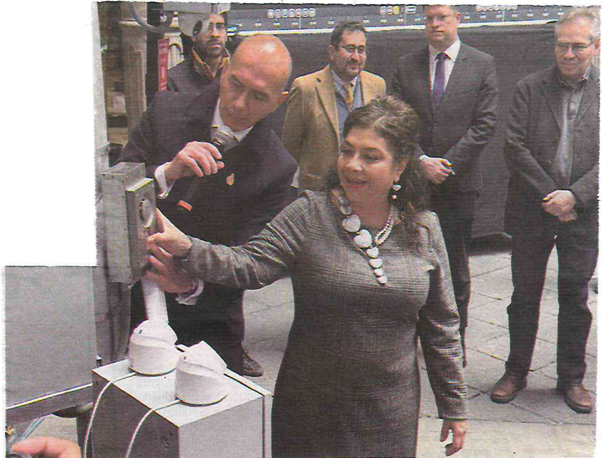
● VIGILANCIA. Dijo que para el Mundial de 2026 habrá 45 por ciento más videocámaras.