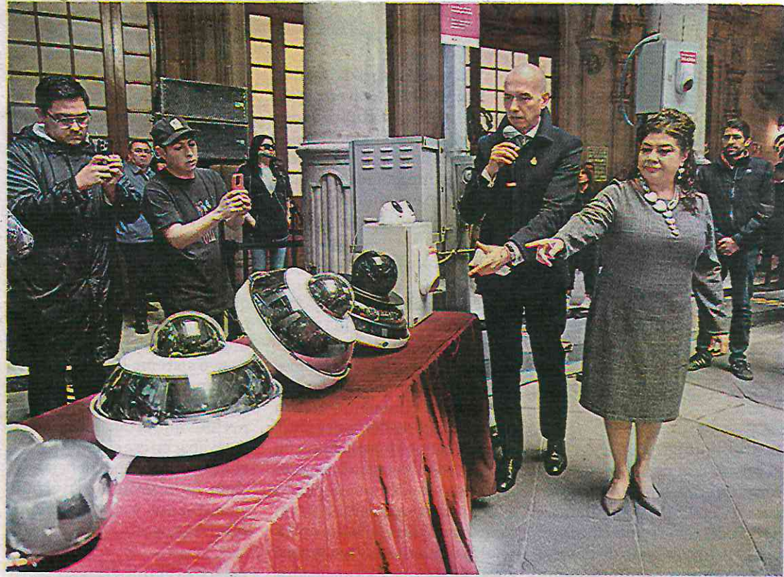
La jefa de Gobierno durante la presentación del nuevo equipo.