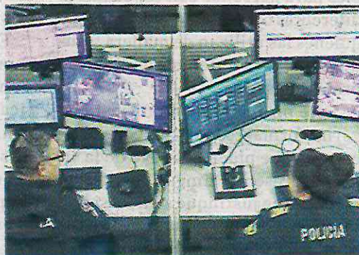
Para la prevención y atención de delitos

Esta videovigilancia brindará orientación ciudadana como son denuncias, quejas o peticiones