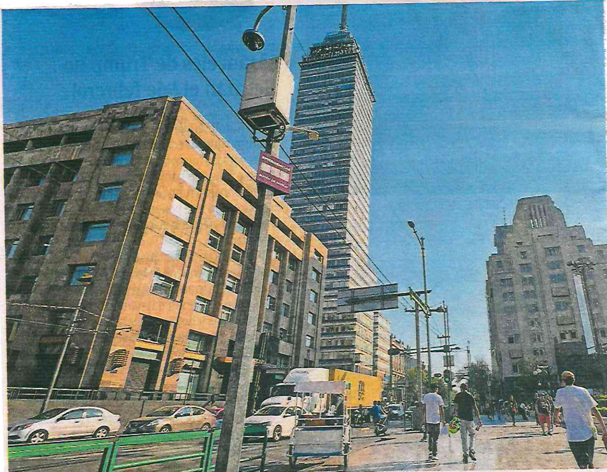
El gobierno aspira a convertir a la Cdmx en la ciudad más videovigilada, por encima de Nueva York o Londres