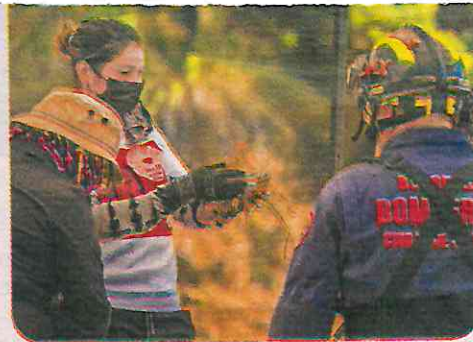
JORNADA. Madres y personas buscadoras recorrieron un predio en el Ajusco en compañía de dependencias locales y federales.

“Vamos a presentar una propuesta muy importante e integral para fortalecer la búsqueda de las personas desaparecidas en la ciudad”, expresó la jefa de Gobierno.