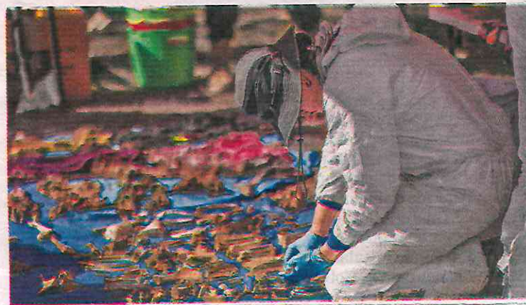
HALLAZGO. Personal forense de la Fiscalía General de Justicia capitalina recolectó los restos y prendas que fueron encontrados durante la jornada.

Reiteró que estas acciones buscan fortalecer a la Comisión de Búsqueda con el personal suficiente y recursos necesarios para mejorar las estrategias de búsqueda de personas en la ciudad.