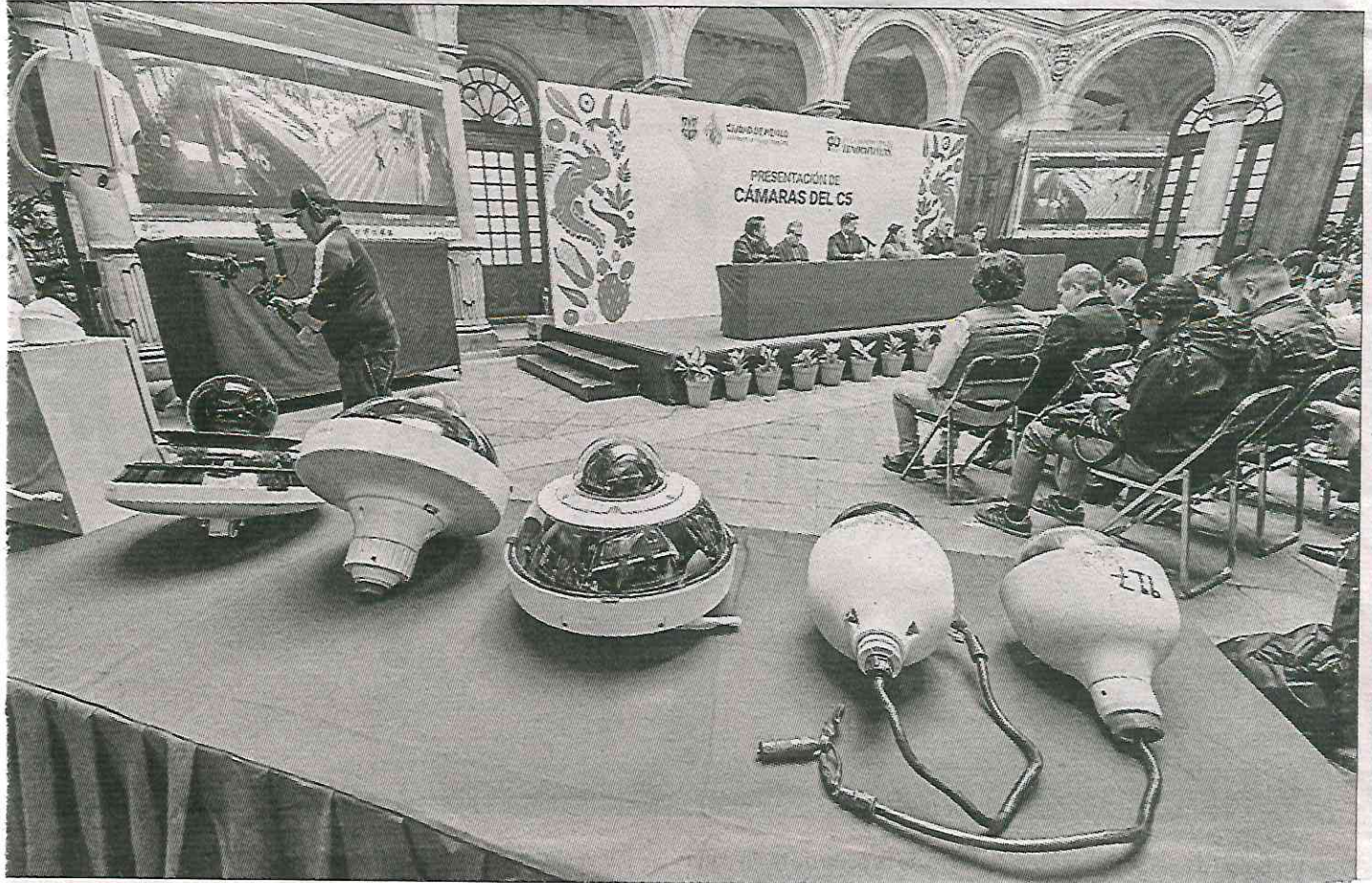
► La jefa de Gobierno, Clara Brugada Molina, encabezó la presentación de la estrategia para reforzar la seguridad en la Ciudad de México con 48 mil 800 cámaras de videovigilancia.