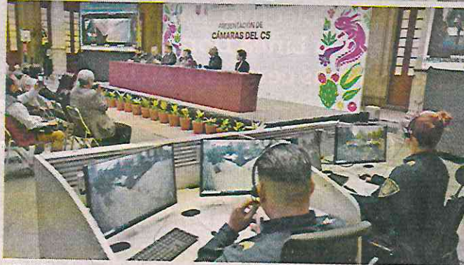
El C5 cuenta con 83 mil 400 cámaras y las atienden 347 elementos de la Secretaría de Seguridad Ciudadana.