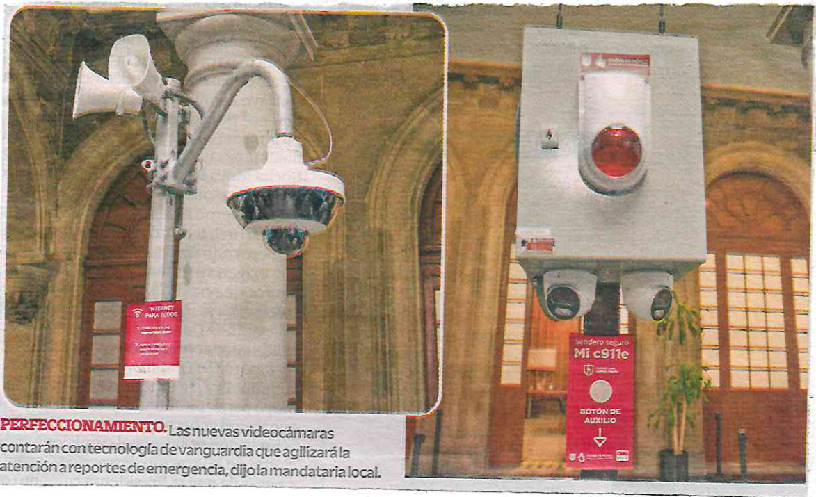
PERFECCIONAMIENTO. Las nuevas videocámaras contarán con tecnología de vanguardia que agilizará la atención a reportes de emergencia, dijo la mandataria local.