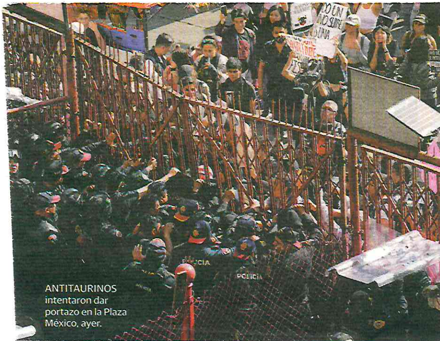
ANTITAUROS intentaron dar portazo en la Plaza México, ayer.