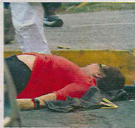
La víctima mortal y el menor hospitalizado, ajenos al hecho de violencia en la colonia San Juan de Aragón