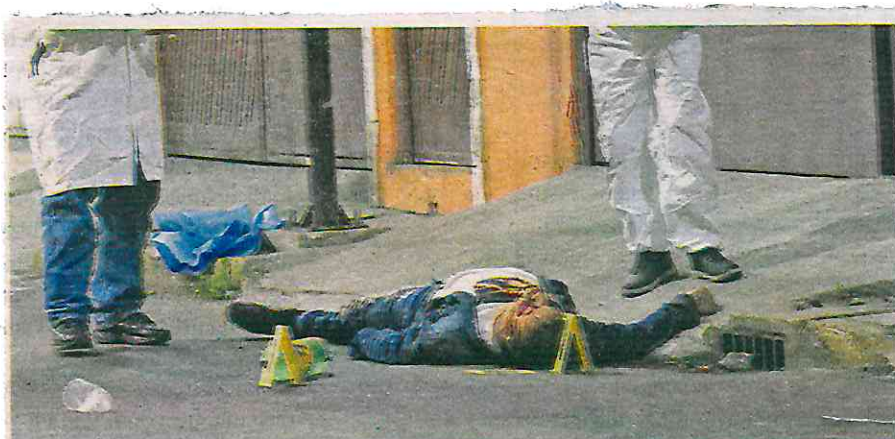
La zona permaneció acordonada y resguardada por los uniformados, lo que ocasionó