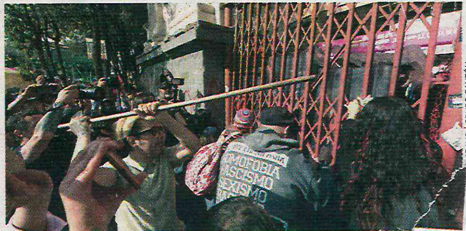
Intentan dar portazo

Al escucharse el primer iolé de la plaza de toros, algunas lágrimas escurrieron por las mejillas de jóvenes que se abrazaron al saber que, por este día, no pudieron frenar la Fiesta Brava.