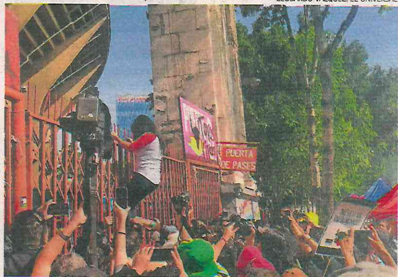
El choque entre manifestantes, policía y taurinos se prolongó por dos horas.

se presentó cuando un grupo de personas encapuchadas empezó a protagonizar enfrentamientos con la policía y algunos fanáticos.