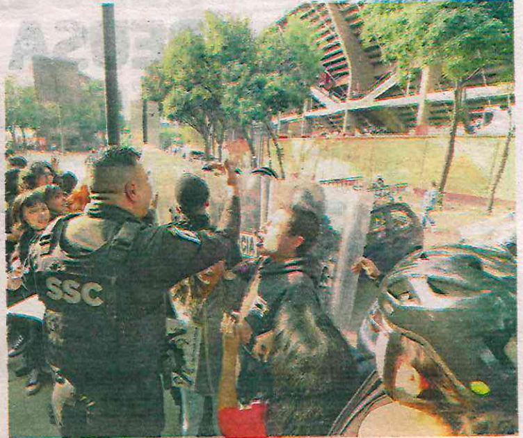
Manifestantes antitaurinos hicieron de las suyas; hubo golpes y descabros