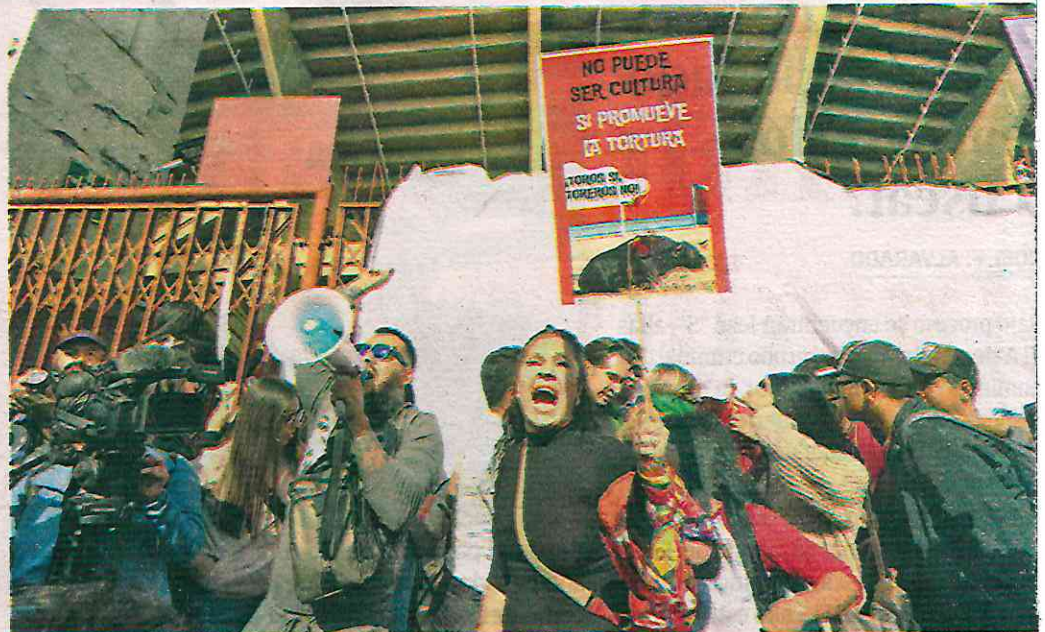
Los elementos de la SSC evitaron que los manifestantes ingresaran a la plaza

La Segunda Sala de la SCJN, máximo órgano judicial del país, dictaminó anu-