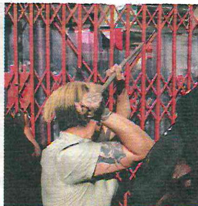
ANIMALISTAS trataron de abrir la puerta principal y agredieron verbalmente a quienes se disponían a entrar a la plaza.