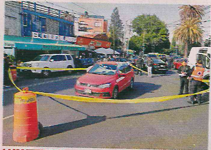
14 NOVIEMBRE. Carmelo fue asesinado a balazos.

"Está la investigación de un camión de la ruta de Universidad que se detuvo en el momento del incidente, el conductor bajó al auto de mi padre y se acercó por alrede-