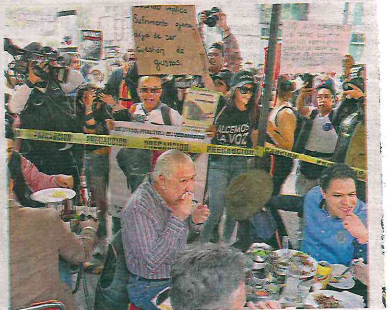
Activistas intentaron impedir que se llevara a cabo la primera corrida de la temporada en la Plaza México; trataron de derribar