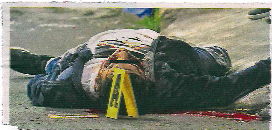
tránsito vehicular en la zona