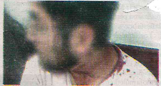
· Piden a Morena conducirse en el marco de la ley

Detalló que la servidora pública, presunta golpeadora, es la misma que se ha encargado de llevar a cabo acciones de entrega de información falsa a los