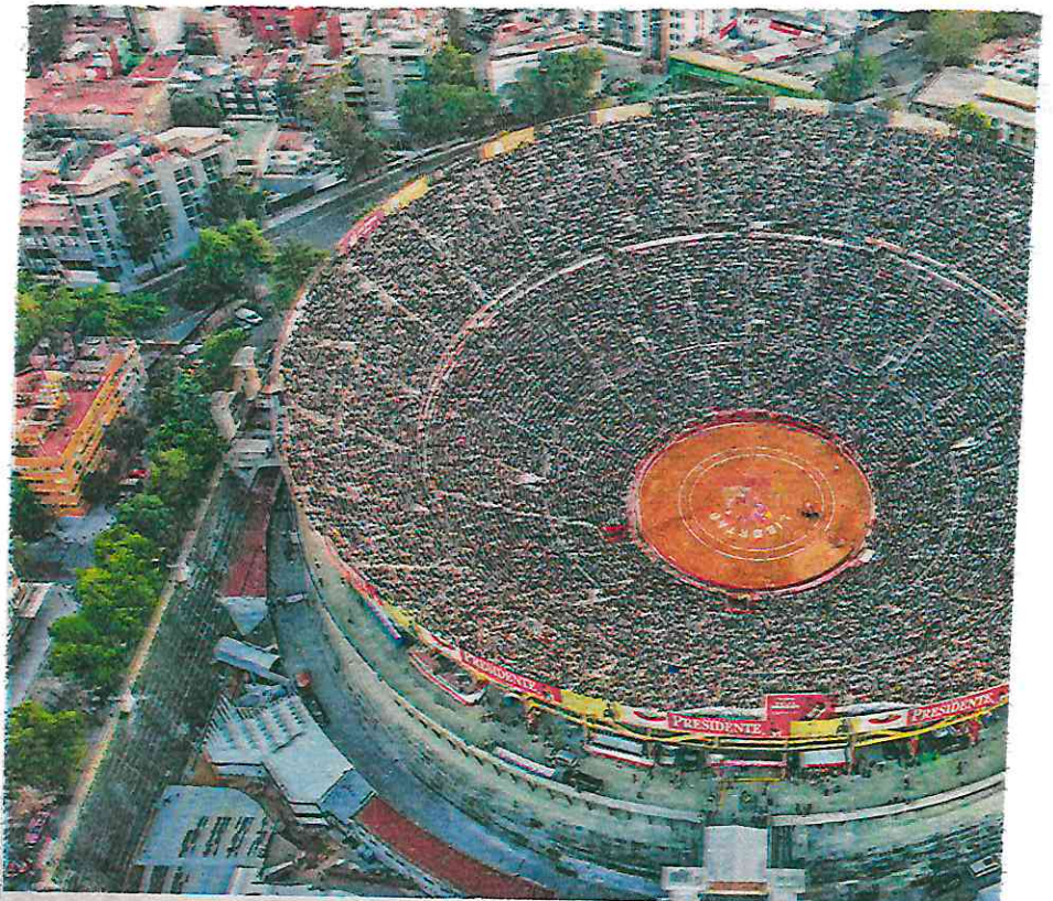
La fiesta brava de vuelta en el Coso de Insurgentes

Además, policías uniformados de la Subsecretaría de Control de Tránsito realizaron un dispositivo de vialidad con cortes intermitentes a la circulación en calles y avenidas de la zona, además brindará rutas alternas a los conductores para garantizar la movilidad de los peatones y automovilistas.