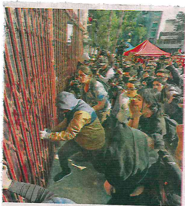
las puertas metálicas