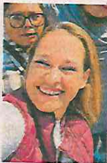
TOMADA DE X