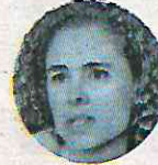
LUISA MARÍA ALCALDE

» Y quien cumple un año laborando en la reestructuración del puerto de Acapulco, es la Secretaría de Bienestar, de Ariadna Montiel Reyes . Luego del último huracán que afectó a la costa, se detalló que la inversión social destinada para ese estado es de dos mil 960 millones de pesos, y que ya empezaron a ser dispersados.