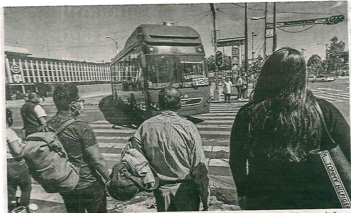
La conectividad de la zona es una ventaja para la propuesta que el ITDP ya le acercó al gobierno capitalino