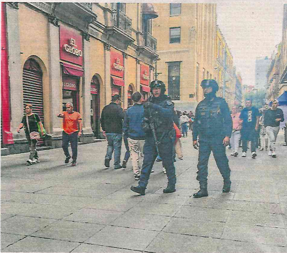
A diferencia de días pasados, esta vez se observaron siete policías en la calle Motolinía. En esta ocasión no hubo presencia de camionetas de la SSC patrullando la zona.