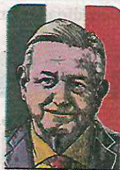
Los últimos 100 días

bellísimo, sobre la zona arqueológica de Sayil, en Yucatán. Eso no sale en las noticias. En el brillo de la mirada del poder, confirmo el que fue su verdadero ajuste de cuentas: se acabó el olvido al sureste. Cueste lo que cueste. Literalmente.