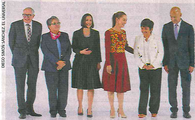
David Kershenobich, Raquel Buenrostro, Luz Elena González, Edna Elena Vega y Jesús Antonio Esteva forman parte del gabinete de Sheinbaum.

La virtual presidenta electa, Claudia Sheinbaum, presentó el segundo bloque de funcionarios de su gabinete, en el que destaca la experiencia y cercanía. David Kershenobich, en Salud; Raquel Buenrostro, en la Función Pública; Luz Elena González, en Energía; Jesús An-