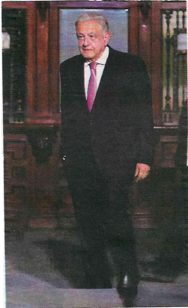
El Presidente a su llegada a la conferencia. ARIANA PÉREZ

lumnie porque tienen problemas conmigo”.