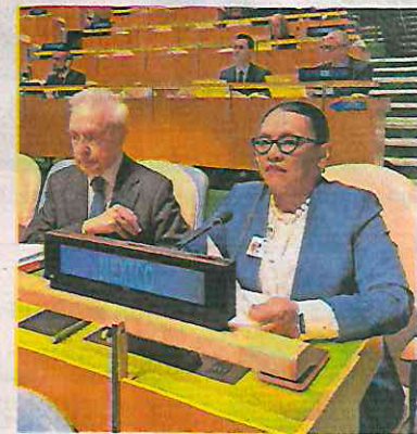
Rosa Icela Rodríguez refrendó en la ONU compromiso del país con la paz.

“México está a favor de la paz y la no violencia. Igual que Naciones Unidas, tenemos un compromiso con la pacificación y el objetivo es que paren los ataques entre grupos