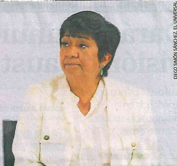
DIEGO SIMÓN SÁNCHEZ, EL UNIVERSAL

Consideró clave ver a las zonas metropolitanas, esto es, a las ciudades, como los principales motores del desarrollo sostenible de su población y del país. ●