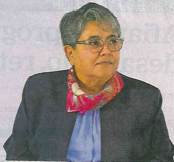
Raquel Buenrostro dijo que buscará ayudar a la próxima presidenta a lograr sus metas.

Abunda que Buenrostro Sánchez conoce ambos temas: fue responsable de las compras públicas gubernamentales y de reconceptualización de las oficialías mayores durante su paso por la Secretaría de Hacienda. ●