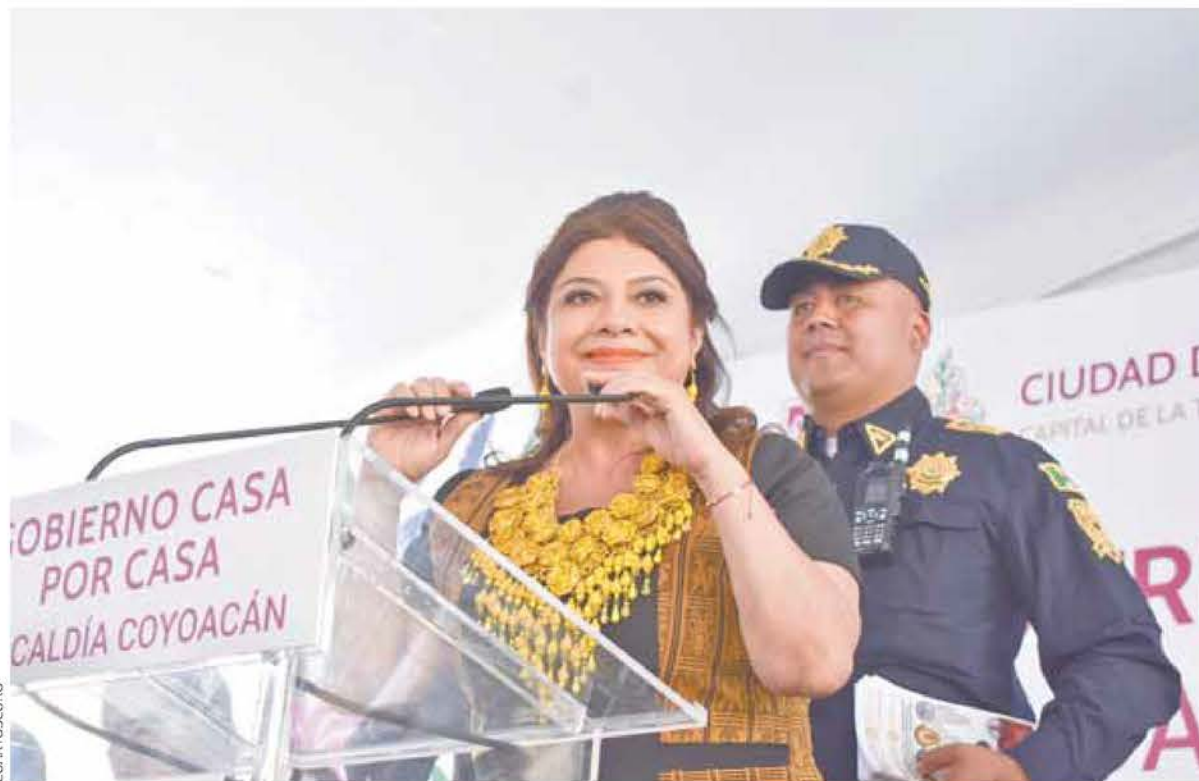
⊕ La jefa de Gobierno de la CDMX, Clara Brugada Molina, hizo el anuncio ayer en Coyoacán..

recursos para que el sistema funcione al tope de sus capacidades y los tiempos de espera se reduzcan a dos minutos, facilitando el traslado de habitantes y visitantes durante el evento.