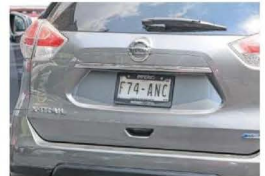
El uso de portaplaca no tiene nada de malo, simplemente con que se vea el QR, comentó un automovilista.