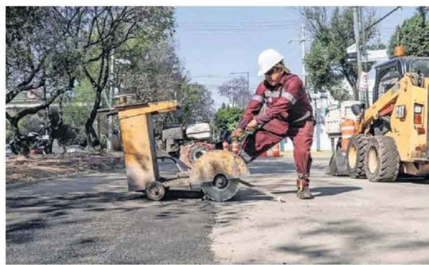
El Bachetón arrancó con 150 cuadrillas y un total de mil 500 trabajadores, pero la intención es tener 500 cuadrillas laborando, informó el titular de Obras y Servicios.

"Casi 4 mil 500 toneladas [de material] estamos tirando todos los días, todos los días estamos haciendo un