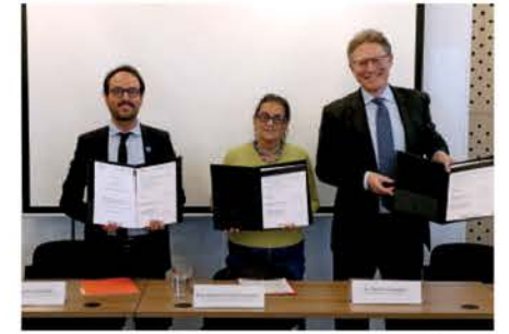
La SGIRPC, Howden y R-Cities en la firma del convenio.

serán inversiones para beneficio de la población de la CDMX. No obstante, indicó que también tendrán como propósito generar una mejor impresión en los turistas que acudan por el torneo futbolístico y decidan regresar posteriormente. Finalmente, dijo que adicionalmente también se estarían haciendo inversiones en el Tren Ligero, que va de Tasqueña a Xochimilco, mismo que podrá acercar a la gente al estadio mundialista. Apuntó que actualmente este no opera al 100% de su capacidad, ya que carece de trenes suficientes para ello; por eso, adelantó que se destinarán los recursos necesarios para que ese medio de transporte esté "a más del cien por ciento" y cada dos minutos salga un tren de las estaciones terminales.●