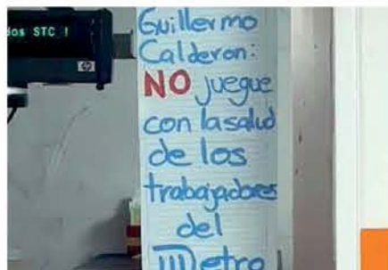
Han colocado carteles de protestas en diversas estaciones. Especial

En protesta por la falta de pago a estos servicios médicos, los traba-