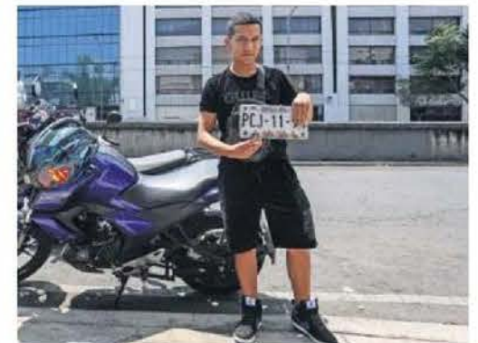
Job contó que le retiraron la placa porque la tierra ensució los números y pagó 300 pesos de infracción.

Escanea el código para visitar esta sección en nuestro sitio web