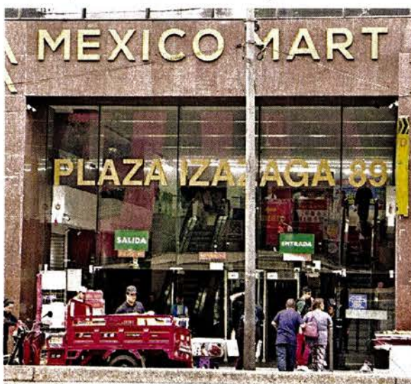
■ A tres meses de su clausura, el inmueble de Izazaga 89 comenzó a operar.

/// Cuando ya hicieron eso los dueños de los dos establecimientos, de los dos inmuebles, ya habían cumplido la parte que le tocaba al Gobierno de la Ciudad, que habíamos clausurado por esa razón".