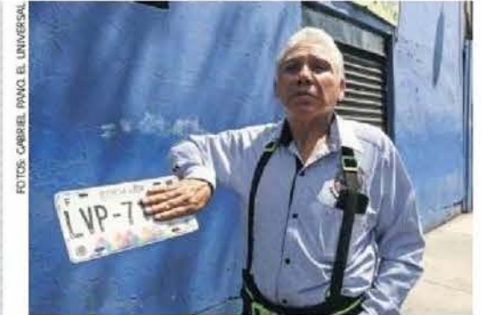
Algunos automovilistas creen que el portaplacas es usado para cometer delitos, "pero por unos pagan todos".

Fuente: Elaboración propia con información de la SSC. Imagen: iStock.