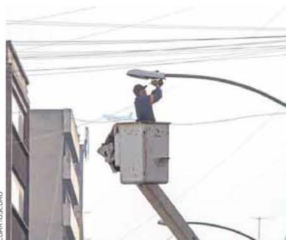
⊕ Advierten sobre el deterioro de los postes de alumbrado público.

“No se trata de señalar responsables de manera confrontativa, sino de trabajar en conjunto para construir una ciudad más segura y solidaria”.