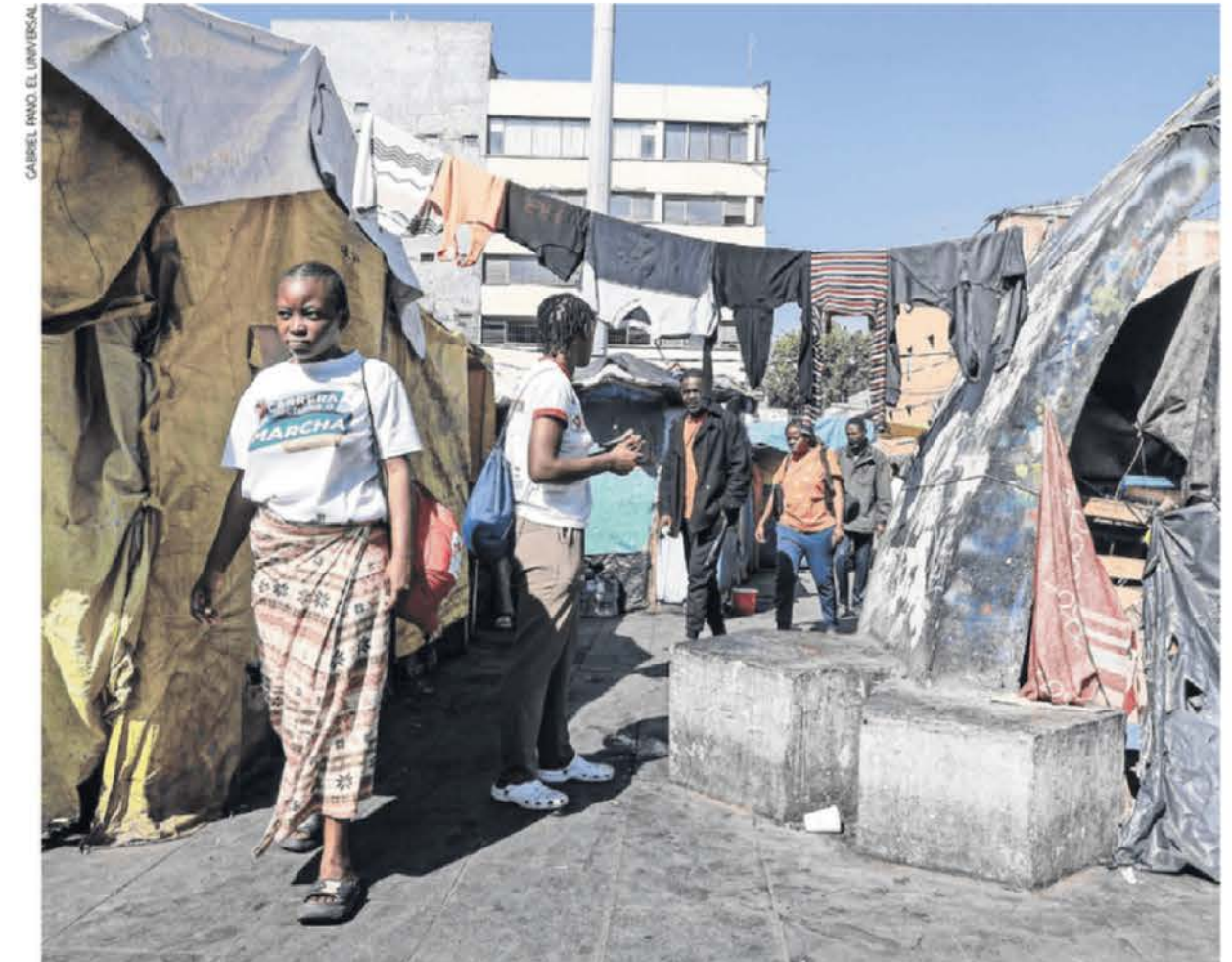
Migrantes del campamento de la Parroquia de la Santa Cruz dicen que se ha perdido el orden en el lugar.