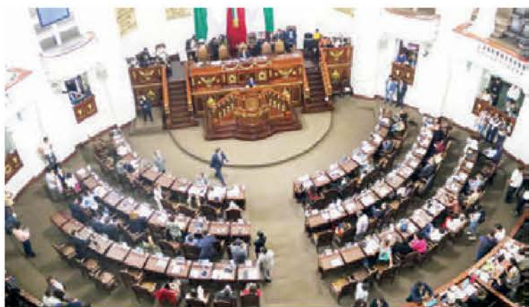
Panistas y priistas acusaron de "trompudos" a los morenistas.

EL CONTROVERTIDO LISTADO fue aprobado con 46 votos a favor y 19 en contra