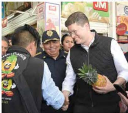
● RECORRIDO. El jefe de la Policía dialogó ayer con comerciantes de la Ceda.