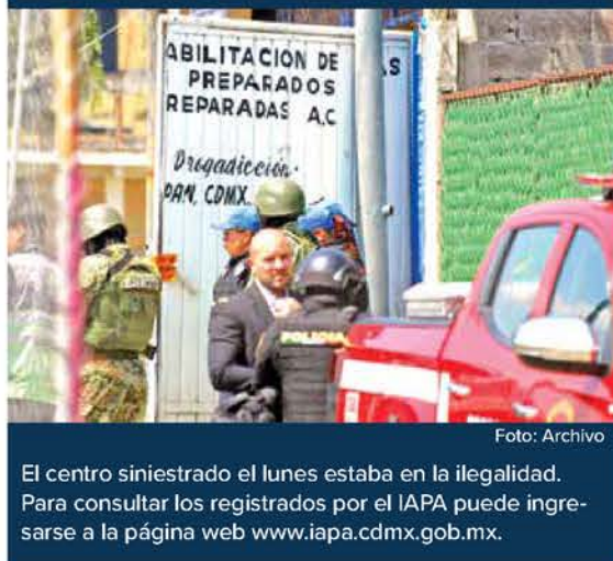
El centro siniestrado el lunes estaba en la ilegalidad. Para consultar los registrados por el IAPA puede ingresarse a la página web www.iapa.cdmx.gob.mx .

ESPECIALISTAS Y AUTORIDADES alertan que no se debe recurrir a estos sitios que carecen de controles en sus instalaciones y personal