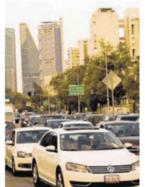
Bajan índices de contaminación.