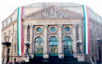
Las entrevistas se llevarán a cabo en el Congreso local. Especial

Sin embargo, ahora las entrevistas de las mujeres mencionadas serán