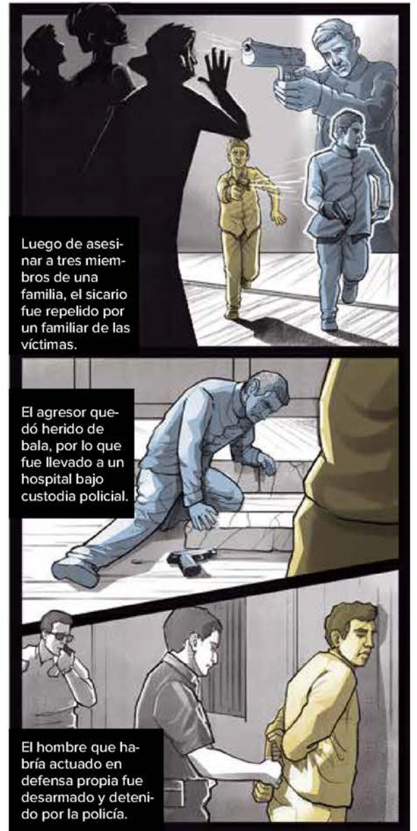
Luego de asesinar a tres miembros de una familia, el sicario fue repelido por un familiar de las víctimas.