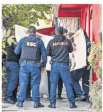
Tres personas fueron asesinadas en la alcaldía Iztapalapa.