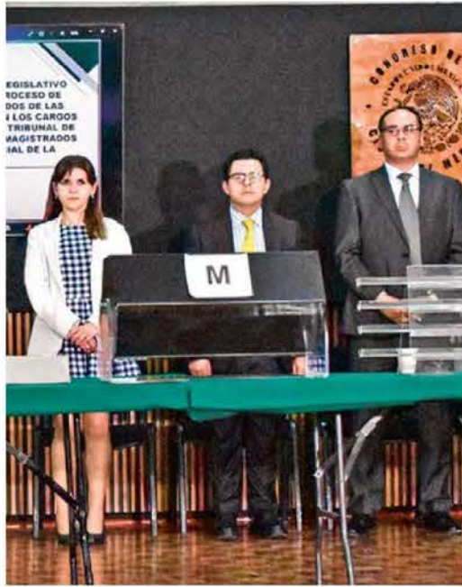
TIEMPO. La insaculación de quienes se registraron ante el Congreso capitalino para un cargo en el Poder Judicial local, se efectuó la madrugada del jueves.