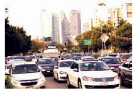
Señalaron que todos los vehículos podrán circular con normalidad.