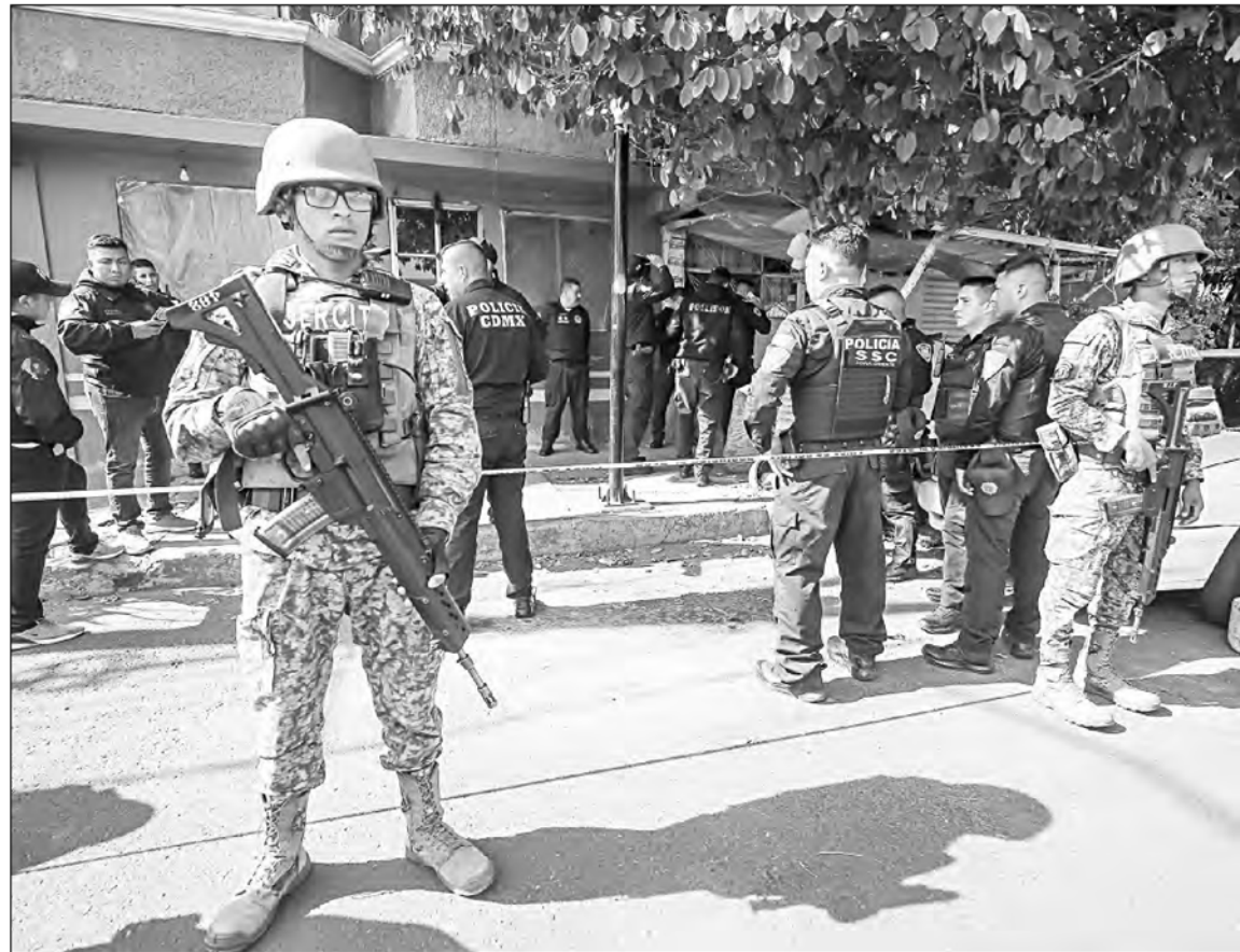
◀ De los nueve asesinatos, tres se cometieron dentro de un domicilio en la colonia Chinampac de Juárez, en la alcaldía Iztapalapa. Fuerzas federales resguardaron el lugar.

Los asesinatos fueron en Iztapalapa, Cuauhtémoc y Álvaro Obregón // Irrupción en un domicilio, el hecho más significativo