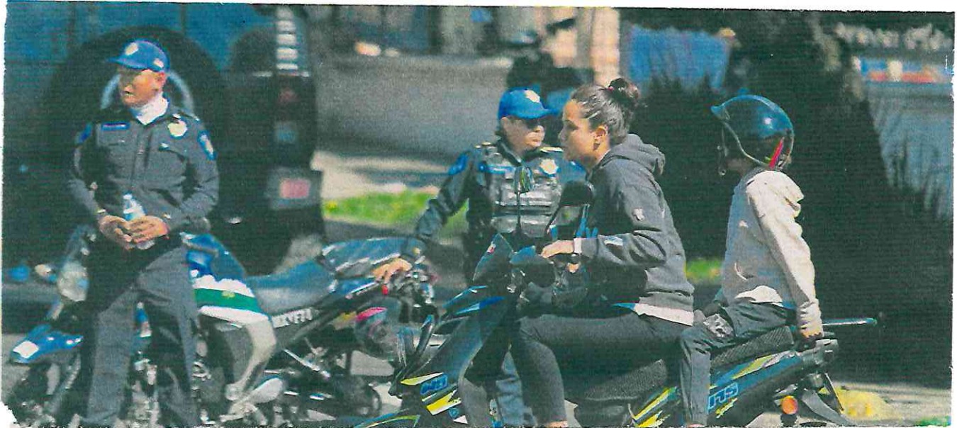
Entre las faltas que más cometen los motociclistas está el no utilizar casco.