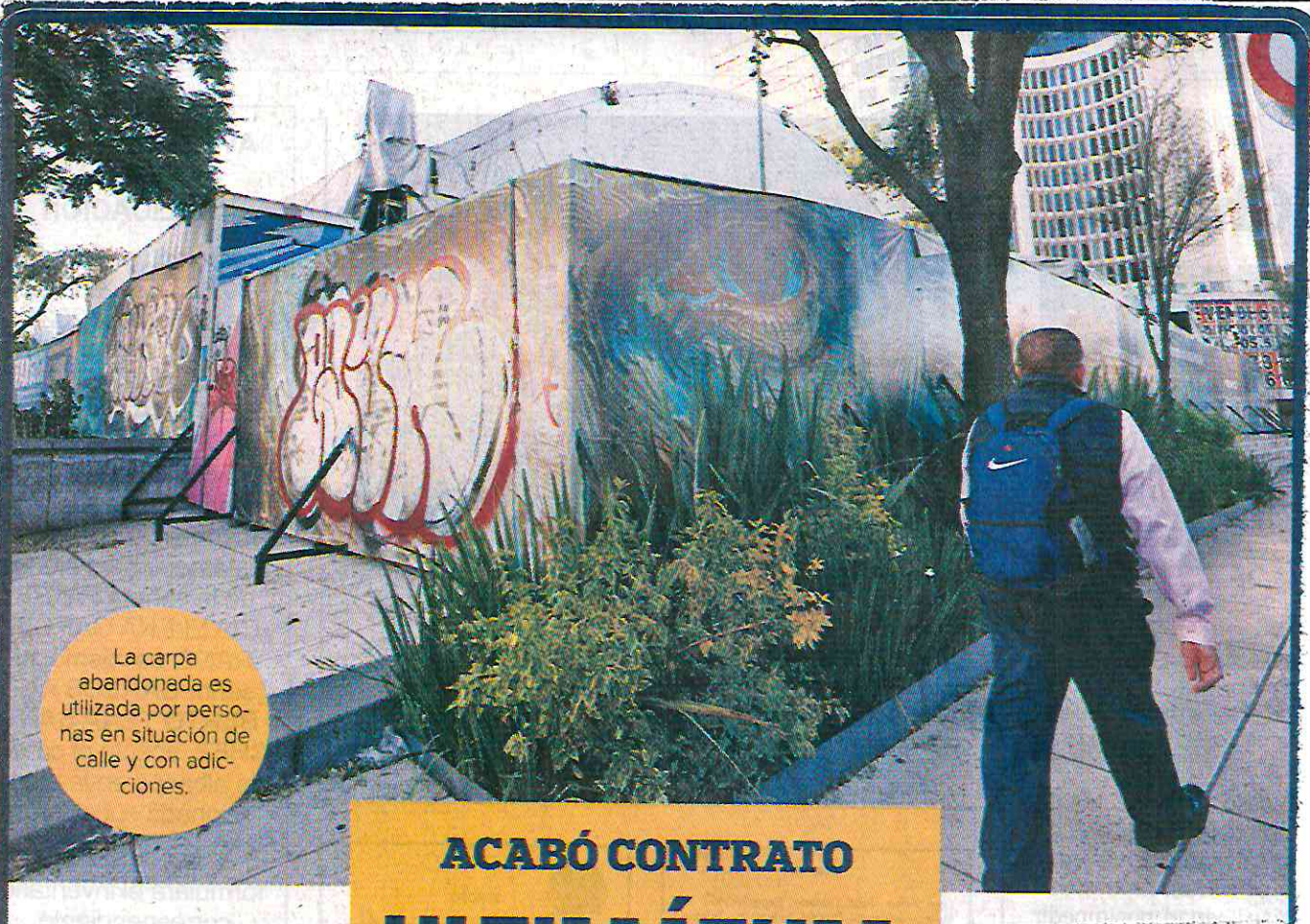
La carpa abandonada es utilizada por personas en situación de calle y con adicciones.