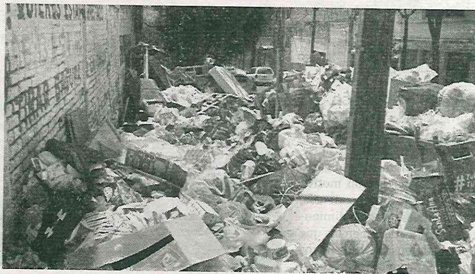
Pagaron 47 millones 547 mil 776 pesos a dos empresas recolectoras de basura