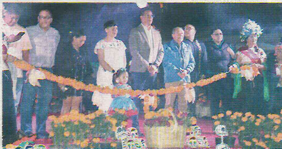
La compañía ha recibido 97 contratos para la celebración de eventos en la alcaldía

Entre lo adquirido por la alcaldía, para la colocación de este altar, se compraron 300 panes de muerto, más de 30 litros de chocolate caliente, productos desechables, mesas, computadoras,