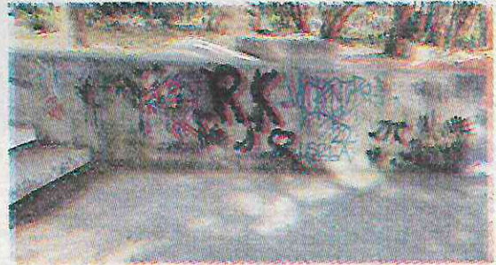
El espacio y sus alrededores están con basura

Gran parte de la basura generada en estos puntos, se debe a los puestos ambulantes que se instalan en Digna Ochoa y Plácido y bloquean totalmente el paso, y otros residuos como botellas de cerveza y licor, son deja-