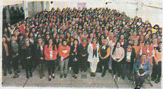
Se impartirán talleres para sensibilizar