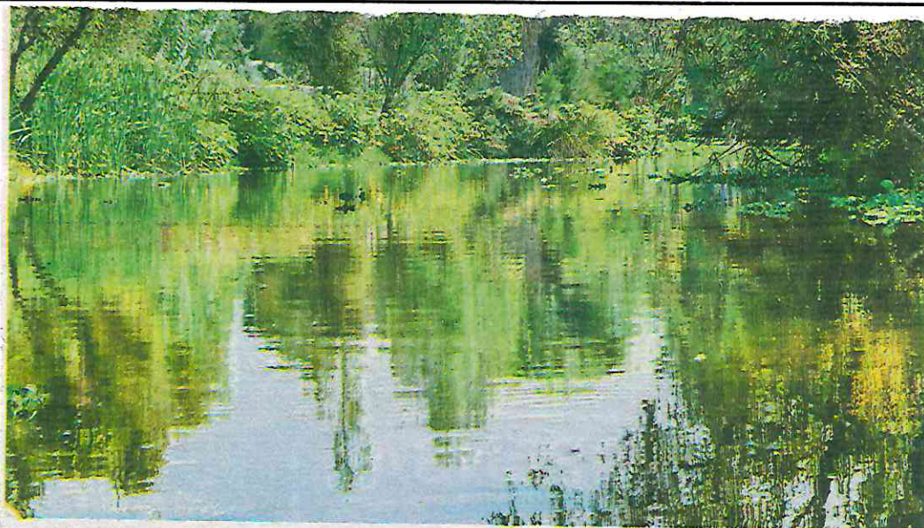
Circe Camacho también llevará a cabo un plan integral de rehabilitación y limpieza de los canales / GUILLERMO PANTOJA