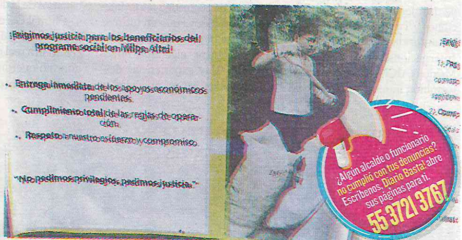
Los beneficiarios piden que se cumplan las reglas de operación sobre pagos

“Nos han visto atendiendo emergencias, organizando actividades, culturales y hasta dirigiendo el tráfico, siempre con el mismo compromiso de servir, pero hoy enfrentamos una gran injusticia. Desde el cambio de administración del mes de octubre, no nos han pagado lo que ya trabajamos con esfuerzo y dedicación” denunciaron facilitadores de servicios contratados por la alcaldía a través de un programa social, en un mitin donde colocaron su pliego petitorio y expusieron abusos laborales.