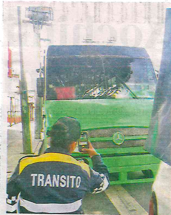
Estos actos de irresponsabilidad evidencian un patrón preocupante en la seguridad del servicio de transporte concesionado