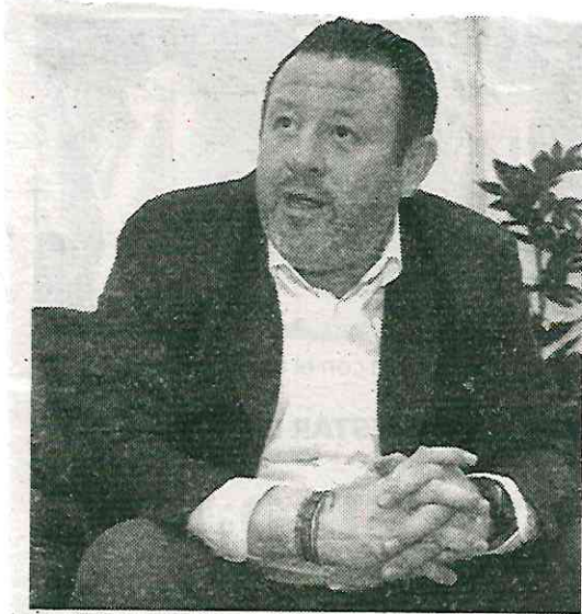
Califican la situación como preocupante