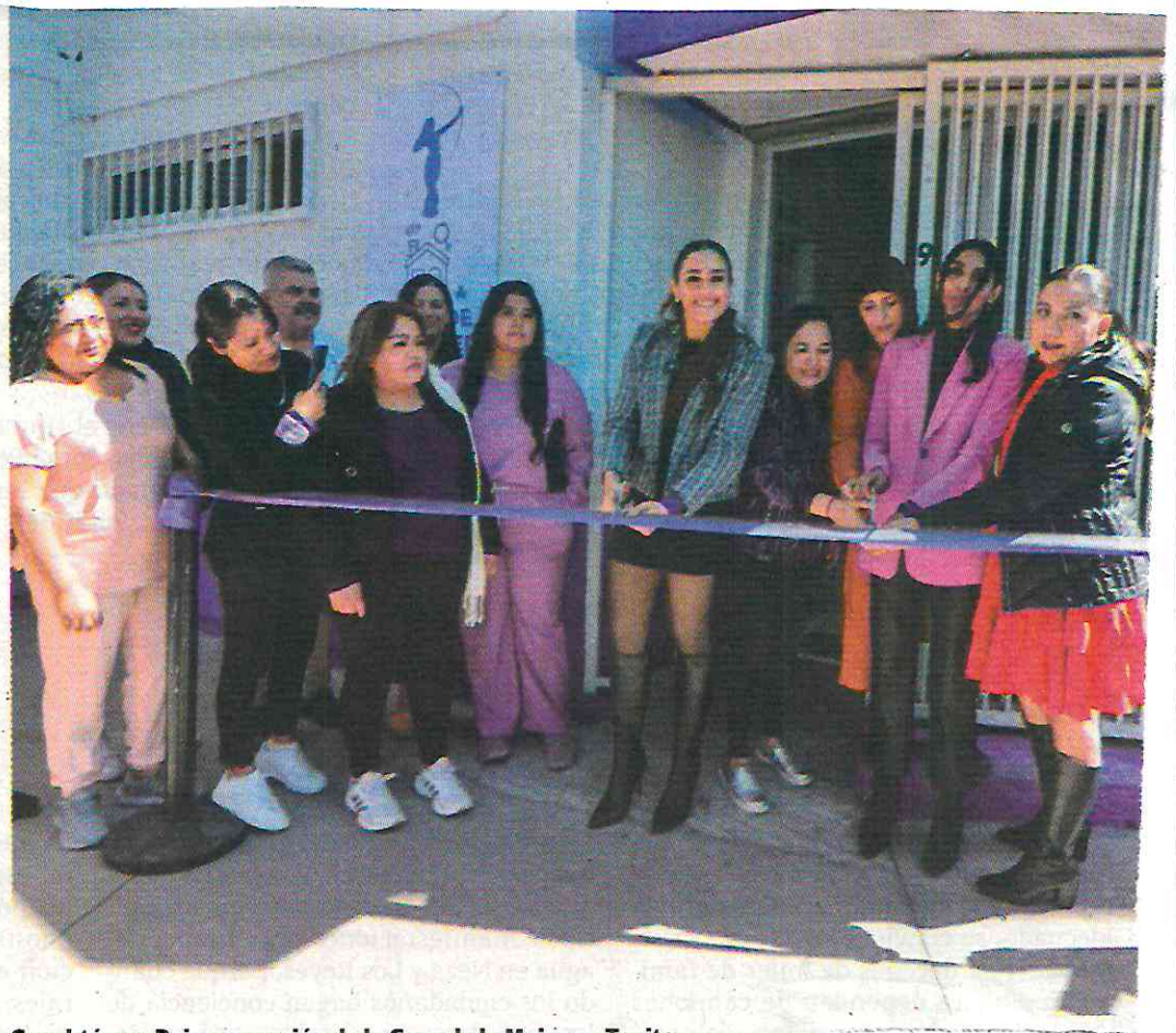
Cuauhtémoc Reinauguración de la Casa de la Mujer en Tepito.

Derivado de ello, informó, han sido atendidas alrededor de 315 mujeres en consultas médicas, psicológicas y de enfermería; así como 698 servicios relacionados con la imagen y belleza, tanto en sus instalaciones como en la Jornada de vecinos SÚMALE y alcaldía