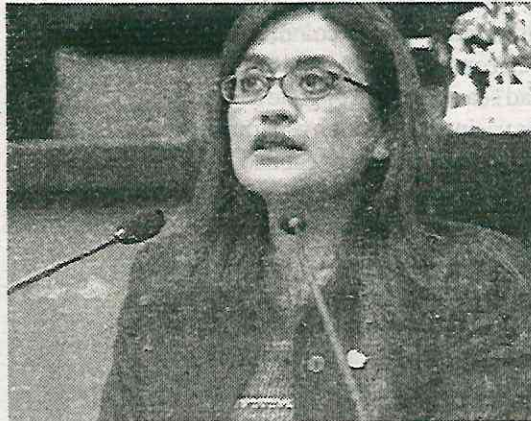
Planteó la creación de sumideros de agua

CIUDAD DE MÉXICO.- La alcaldesa de Iztapalapa, Aleida Alavez, solicitó un incremento del 15 por ciento respecto a lo entregado en el 2024 para atender, dijo, a los habitantes de la demarcación más grande de la CDMX. Durante la discusión del presupuesto en el Congreso de la CDMX planteó la creación de