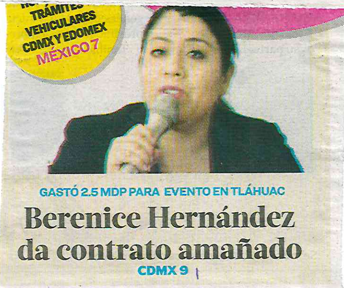
GASTÓ 2.5 MDP PARA EVENTO EN TLÁHUAC

La versión pública del documento señala que el método de contratación fue por medio de una adjudicación directa debido a que se declararon como desierta la licitación y la