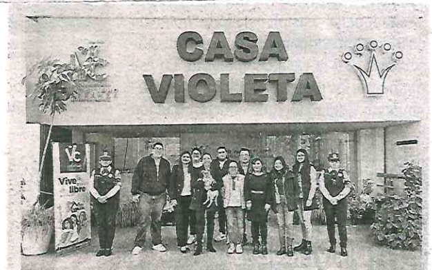
La Casa Violeta es uno de los logros más importantes de la gestión de Evelyn Parra

La administración de Evelyn Parra es un referente en la protección de los derechos de las mujeres y en la lucha contra la