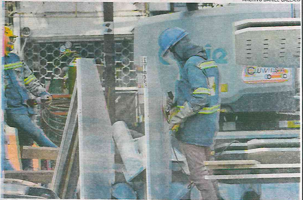
La CdMx se ubica en el lugar 15 de 66 ciudades por sus condiciones del mercado laboral

El 31.9 por ciento de los chilangos ocupados trabajan jornadas superiores a las 48 horas, señala el informe que evalúa la competitividad de 66 ciudades, donde habita más del 62 por ciento de los mexicanos.