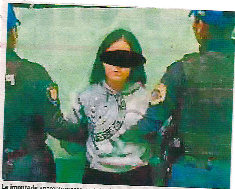
La imputada aparentemente portaba dos armas punzocortantes, un cuchillo pequeño y otro de aproximadamente 21 centímetros