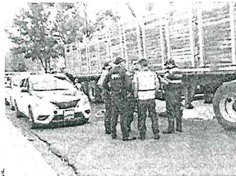
PERIODO. La Secretaría de Seguridad Ciudadana reportó 127 mil 678 incidentes de tránsito del 5 de diciembre de 2018 al 31 de agosto de 2024.