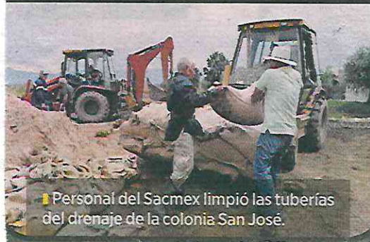
Personal del Sacmex limpió las tuberías del drenaje de la colonia San José.

El equipo de bombeo para drenar el Riachuelo Serpentino, a cargo de la Alcaldía Tláhuac, dejó de operar y eso fue una de las causas de la inundación de 50 casas de la Colonia San José el lunes, señalaron vecinos. Para reforzar el canal fue renovado un muro de contención hecho de costaleras. Trabajadores de la alcaldía recorrieron las casas para levantar un censo y gestionar pago de daño, mediante una póliza. IVÁN SOSA