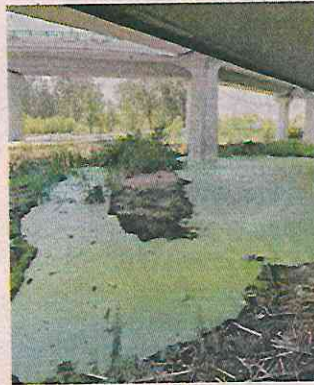
El espacio, ubicado bajo el puente vehicular, era un refugio de aves.

“El humedal de Xochimilco, ubicado en los carriles centrales de Periférico, sur oriente, enfrente del Parque Ecológico de Xochimilco, es un elemento vital de interconexión para el conjunto del sistema lacustre”, explicaron en la denuncia.