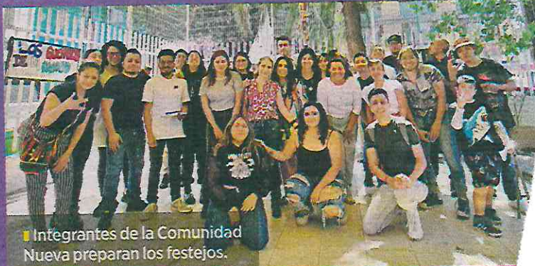
Integrantes de la Comunidad Nueva preparan los festejos.

Explicó que esta tiene antecedentes importantes en tiempos prehispánicos, en los que pertenecía al Barrio de Cuepopan y durante la época colonial, cuando