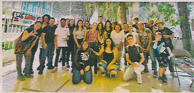
Vecinos de la Guerrero, en la Alcaldía Cuauhtémoc, buscan difundir la cultura e historia de la Colonia.

de la Guerrero, que alberga los restos de los ex Presidentes Benito Juárez y Vicente Guerrero, organizaciones y locatarios realizarán talleres culturales y recorridos por espacios emblemáticos.