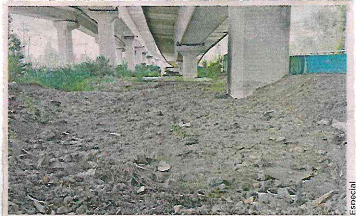
Organizaciones buscan que el caso del humedal de Xochimilco sea revisado por instancias internacionales.

“El Poder Judicial de la Federación otorgó más importancia a la generación de una vialidad ineficiente y exclusiva para vehículos, por encima de otras formas de movilidad y de la protección del humedal”, señaló el documento enviado a la CIDH.