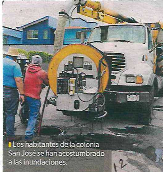
Los habitantes de la colonia San José se han acostumbrado a las inundaciones.