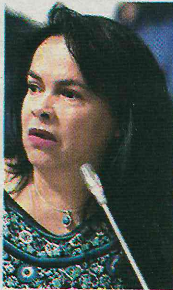
No repetirá en la demarcación

La alcaldía panista informó que en el primer trimestre de 2024 suscribió siete contratos con diversas empresas, de los cuales Tat Constructora fue la beneficiada al ganar tres concursos, por un total de 10.6 millones de pesos. Sin embar-