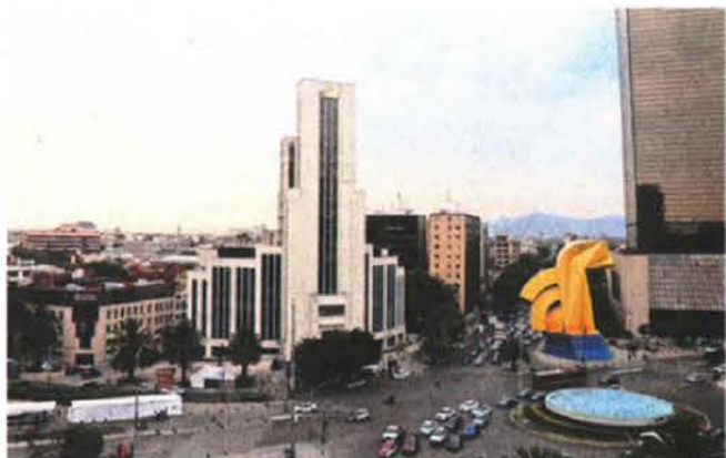
La CAME detalló que un sistema de alta presión, viento ligero y radiación solar intensa favorecieron la acumulación de los precursores de ozono.

Un sistema de alta presión sobre la porción oriente del Valle de México ocasionó viento con intensidad ligera y dirección variable durante el día, y en combinación con radiación solar intensa,