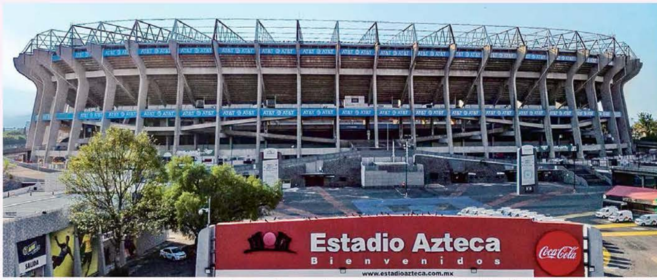
PREPARACIÓN. La mandataria capitalina informó que tiene los proyectos de planeación urbana para la celebración de los partidos del Mundial FIFA 2026 en el Coloso de Santa Úrsula