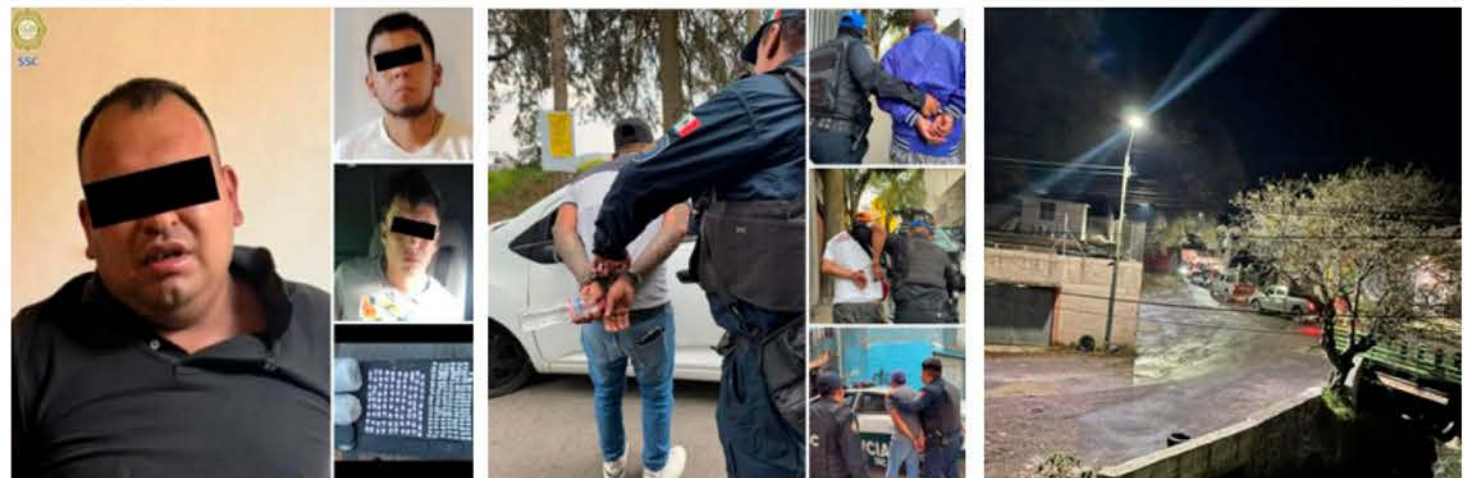
Topilejo es una base excepcional para los criminales porque circulan la droga a mediomayoristas del sur del país a la Ciudad de México sin mayor problema, tomando el rumbo de Xochimilco o el centro de Tlalpan. Líderes de Los Mojarras , que operan desde Cuernavaca y Huitzilac, han sido detenidos pero su presencia persiste.

los líderes o ascendiendo a otros integrantes; así el repliegue hacia Morelos permite huir de la policía capitalina y simplemente esperar unos días para volver a aparecer en territorio capitalino.