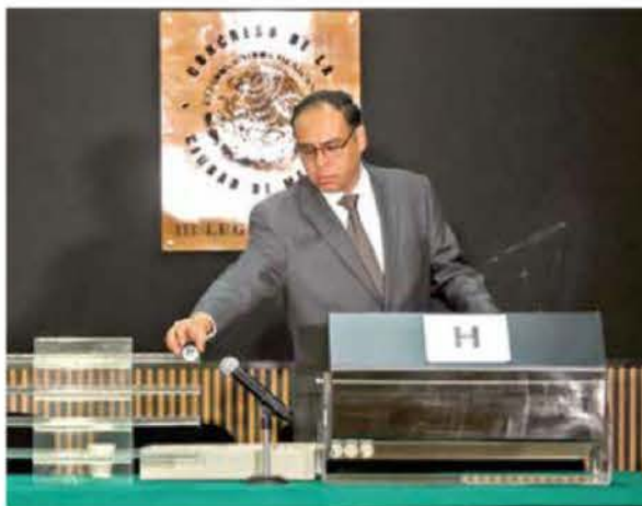
Para las 00:30 horas apenas se tenían los nombres de 46 candidatas y 44 candidatos a jueces en materia civil.

Al cierre de esta edición, a las 00:30 horas, se había concluido con el sorteo