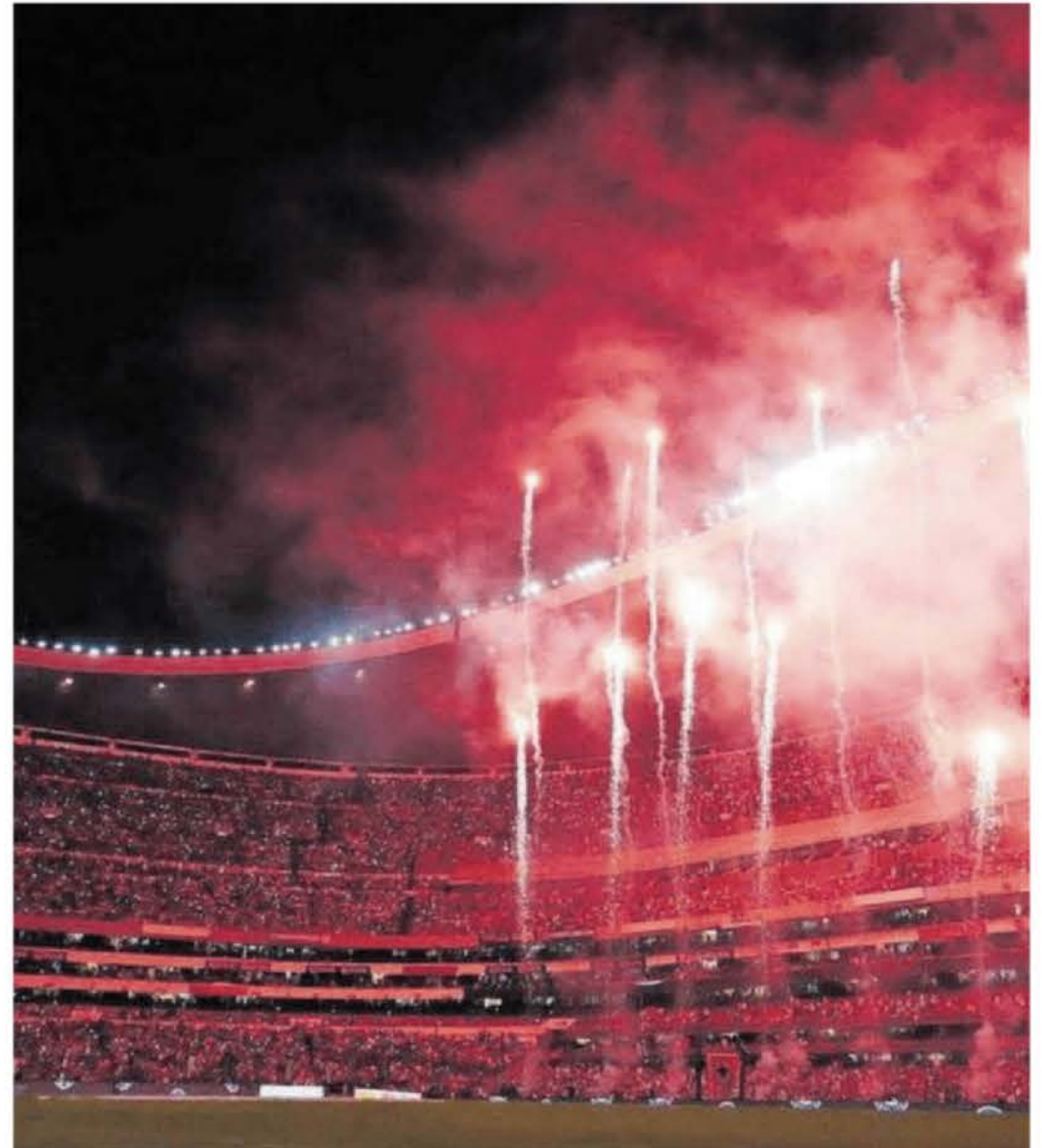
La idea es evitar el uso de pirotecnia y hacer un espectáculo de luces con drones.

Se trata de una alternativa moderna y ecológica que mantiene el atractivo visual sin contaminación ni ruido.