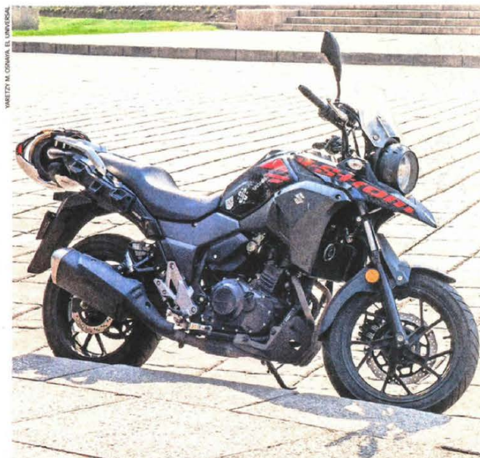
El Estado de México contabilizó 12 mil 506 motos robadas en 2024; en la Ciudad de México fueron 3 mil 248.

Editora: Johana Robles Coeditora: Phenélope Aldaz Tel: 55 5709 1313 Ext: 4561 y 4524