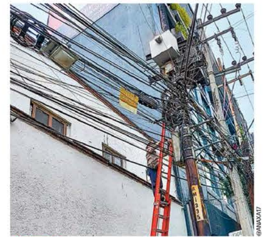
ACUERDO. Para cumplir demandas vecinales y dar una limpieza visual, la alcaldía Benito Juárez y compañías de comunicación retirarán instalaciones en desuso.

“Quiero agradecerles la disposición para atender a nuestros vecinos, para atender las necesidades y tratar de hacer que la alcaldía Benito Juárez siga siendo el mejor lugar para vivir y se atiendan las demandas de sus habitantes que son primordiales”, destacó. /24 HORAS