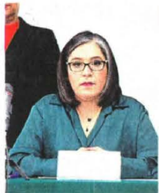
El comité estaba a la espera de un notario para comenzar con la tómbola.

Estos listados aprobados deberán ser enviados al Congreso capitalino, quienes a su vez los integrarán y los enviarán al Instituto Electoral de la Ciudad de México (IEECM). ●