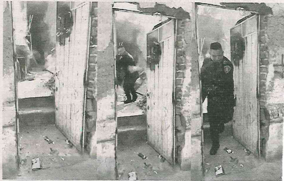
Momento exacto del dramático rescate

El titular de la SSC anunció que todos los policías que participaron en el rescate recibirán un ascenso.