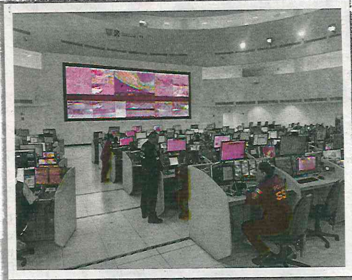
• Las mujeres son mayoría en el C5.

"Hay que aprovechar la vanguardia que en este momento ya tiene el C5 a nivel nacional para proyectar la agenda de género, de igualdad sustantiva y de una mirada violeta", enfatizó el titular del C5, quien tiene como siguiente objetivo "acelerar el programa de videovigilancia con perspectiva de género que nos ha encargado la jefa de gobierno Clara Brugada", con el que buscan que todos los entornos sean seguros para las capitalinas.