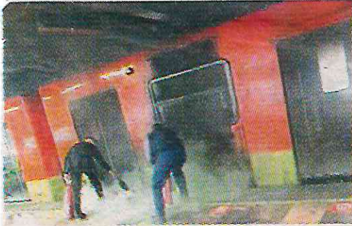
Por fallas en los trenes y cortos circuitos