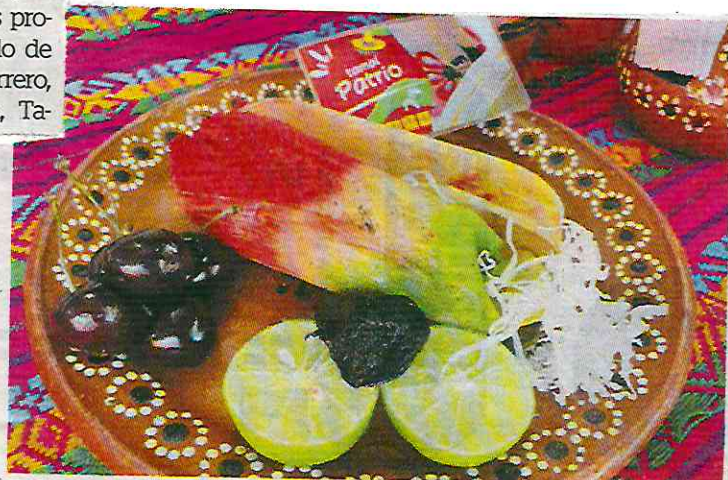
En Los Pinos la cita es los días 1 y 2 de febrero, con la participación de cocineras y cocineros de Ciudad de México, Estado de México, Oaxaca, Tlaxcala y Veracruz.

Habrà desde los clásicos tamales de mole, rajas y dulce, hasta especialidades regionales como el tlalpilque y el zacahuil