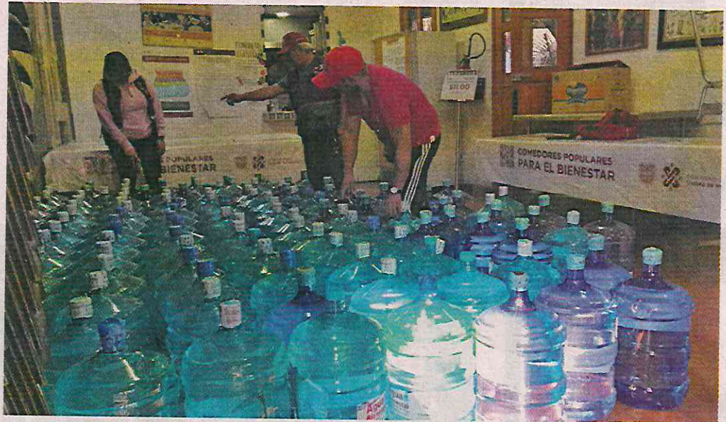
■ La dotación de líquido embotellado llega al Pilares La Escuelita, situado en la Calle Canacuate.

A las 17:00 horas, los promotores del Pilares La Escuelita, situada en la Calle Canacuate, entregaron los