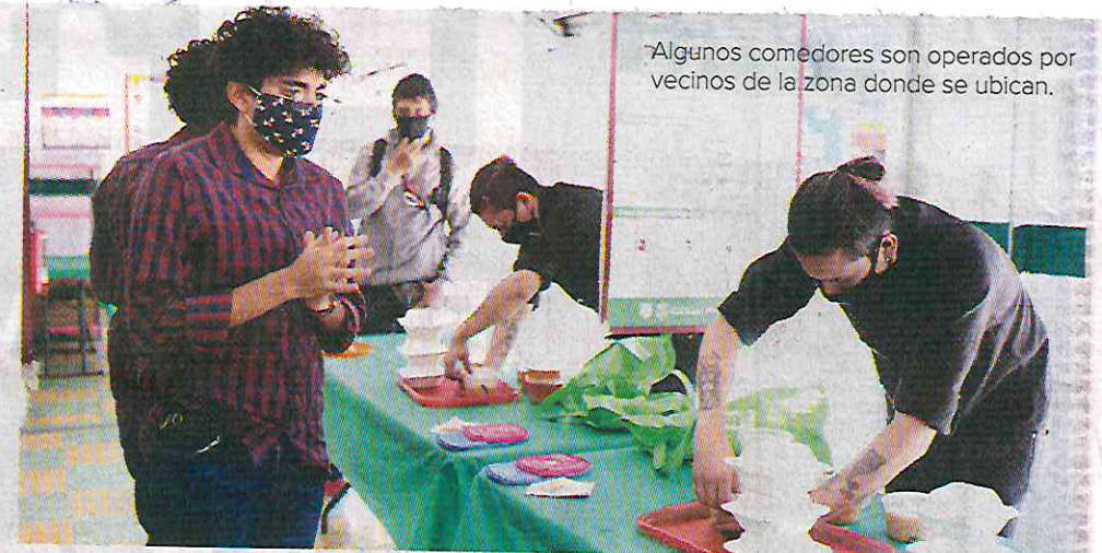
“Algunos comedores son operados por vecinos de la zona donde se ubican.”

De acuerdo con el Presupuesto de Egresos 2025, se erogarán 596 millones 753 mil 271 pesos a los Comedores para el Bienestar, a cargo de la Secretaría de Desarrollo Social (Sibiso).