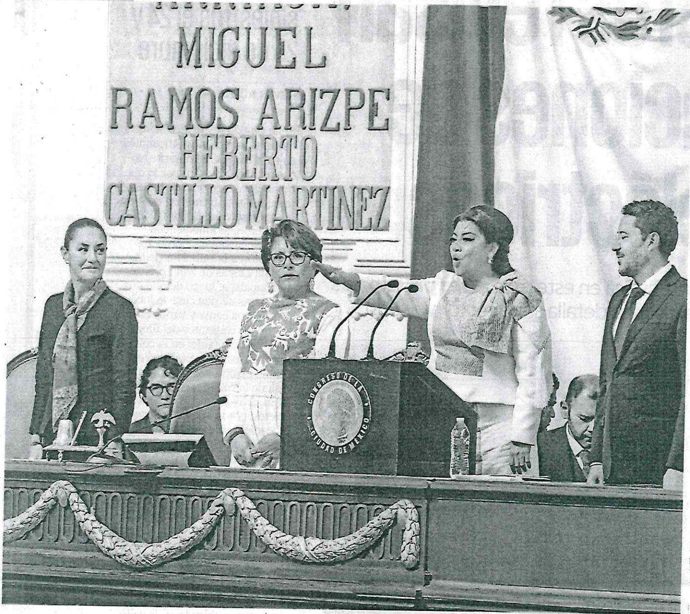
GABRIEL PANO. EL UNIVERSAL