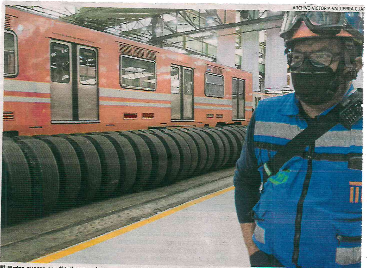
El Metro cuenta con 11 talleres, ocho para mantenimiento sistemático, dos para mantenimiento mayor y uno para rehabilitación