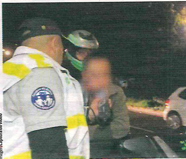
Imagen | Captura de video

LA DEPENDENCIA informa que el 24 de diciembre 58 personas superaron el límite de alcohol; policías capturan en alcoholímetro a joven que cargaba una réplica de arma de fuego