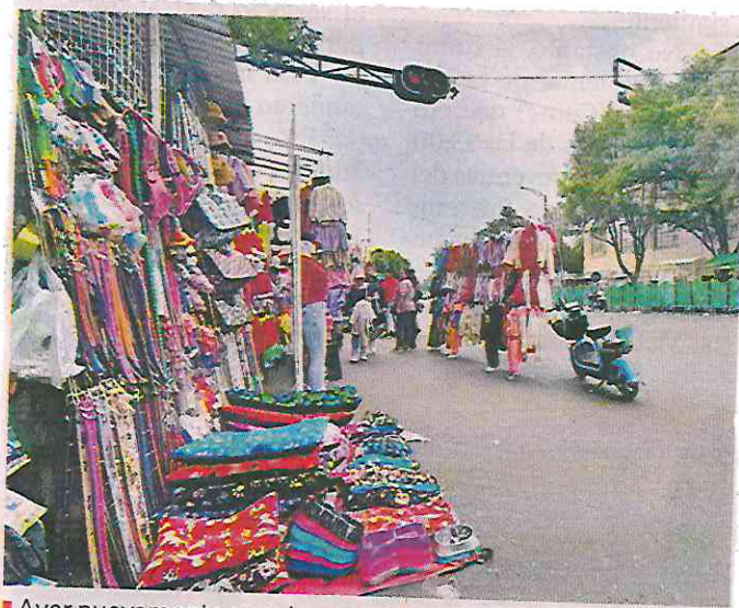
■ Ayer nuevamente se colocaron comerciantes informales en Circunvalación, en la Alcaldía Cuauhtémoc.