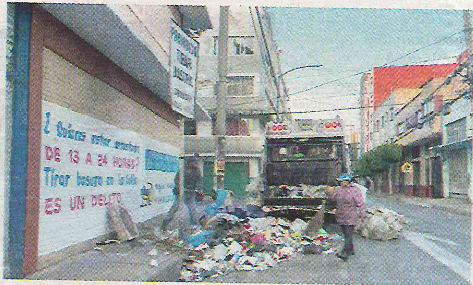
Servicio de limpia en MH, corresponden a empresas privadas

En los reportes de alta, la JUD de la alcaldía no precisa el método de compra, proveedor o materiales de los que están hechos los bienes adquiridos, sólo que estos carritos trans-