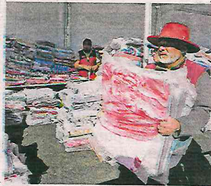
Programa de invierno La Ciudad te Cuida y en Invierno te Cobija