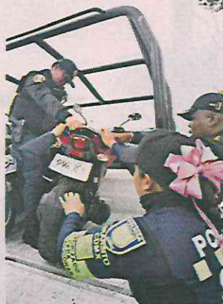
El lunes se realizó un operativo en Circunvalación.

llevó a cabo personal de la demarcación, en conjunto con la Secretaría de Seguridad Ciudadana (SSC) el lunes; sin embargo, dos días después, el ambulante retomó sus lugares de siempre sobre el arroyo vehicular.