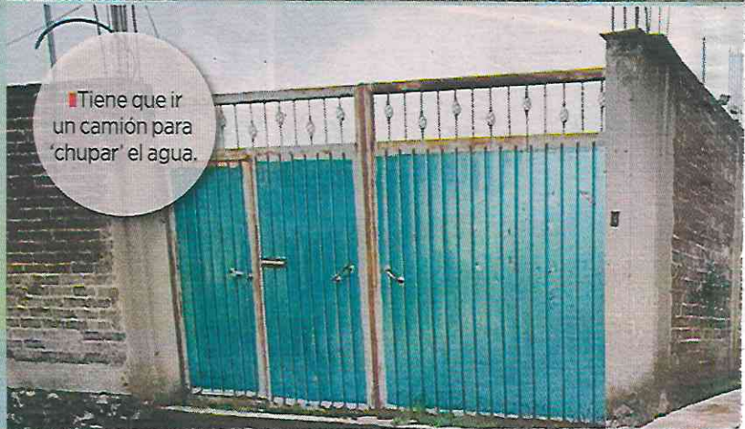
Tiene que ir un camión para 'chupar' el agua.