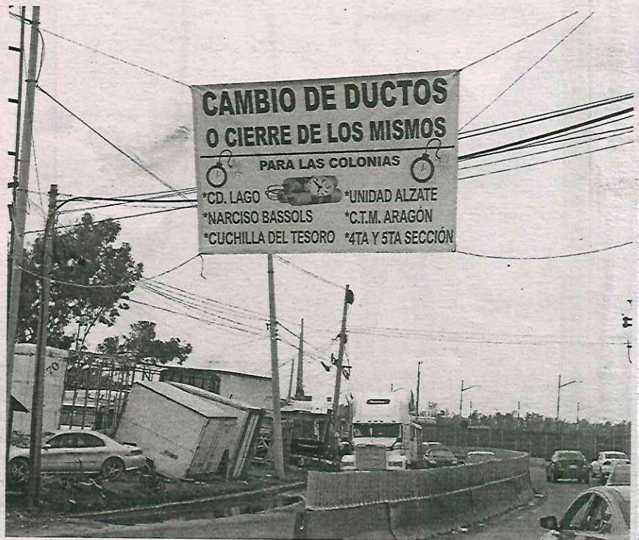
Está confirmado con pruebas que realizó Pemex, que este material proviene principalmente de talleres de reparación automotriz y lavados de autos

En entrevista con este diario, el alcalde manifestó que en la colonia Ciudad Lago no pasan ductos de Petróleos Mexicanos y las tuberías halladas recientemente, que causaron alarma entre la población, son ramales de agua potable con años de anti-