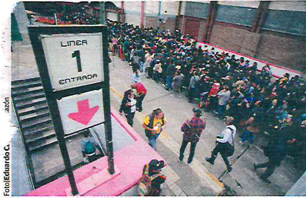
FILA de usuarios de la Línea 1 del Metro para abordar una unidad del Metrobús en el Cetram Pantitlán, ayer.