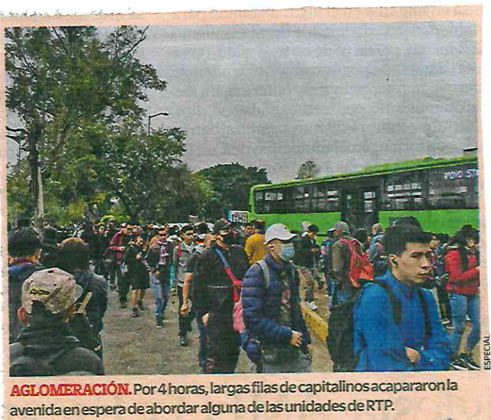
AGLOMERACIÓN. Por 4 horas, largas filas de capitalinos acapararon la avenida en espera de abordar alguna de las unidades de RTP.