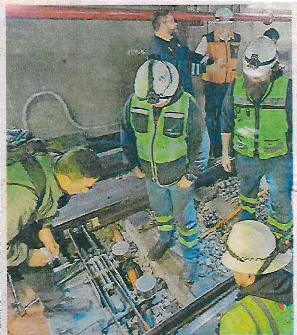
Maniobras en la estación Pino Suárez de la Línea 1, donde se llevó a cabo la revisión de un aparato de vía

do a una revisión de vías, precisando que laboraban a marchas forzadas para reanudar lo más pronto posible la marcha de los trenes en toda la línea.