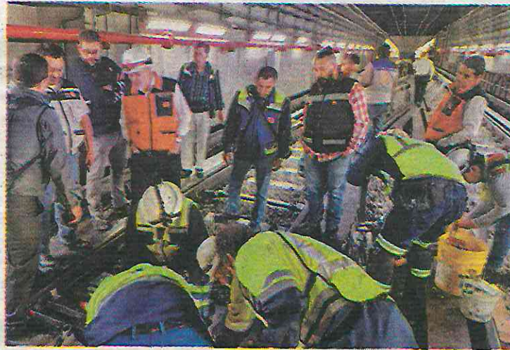
Personal en la zona de vías. ESPECIAL

Alrededor de las 10 de la mañana el Metro restableció el servicio de Pantitlán a Isabel la Católica en ambas direcciones. —