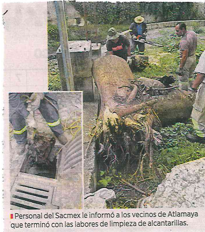
Personal del Sacmex le informó a los vecinos de Atlamaya que terminó con las labores de limpieza de alcantarillas.

“Empieza a llover fuerte, yo miro donde está el emboquillamiento con la cámara que está ahí y se bajan los vigilantes con la patrulla, se avisa a las casas que están por ahí que muevan coches, que eso ya se hizo en esta ocasión”, detalló Ortega.