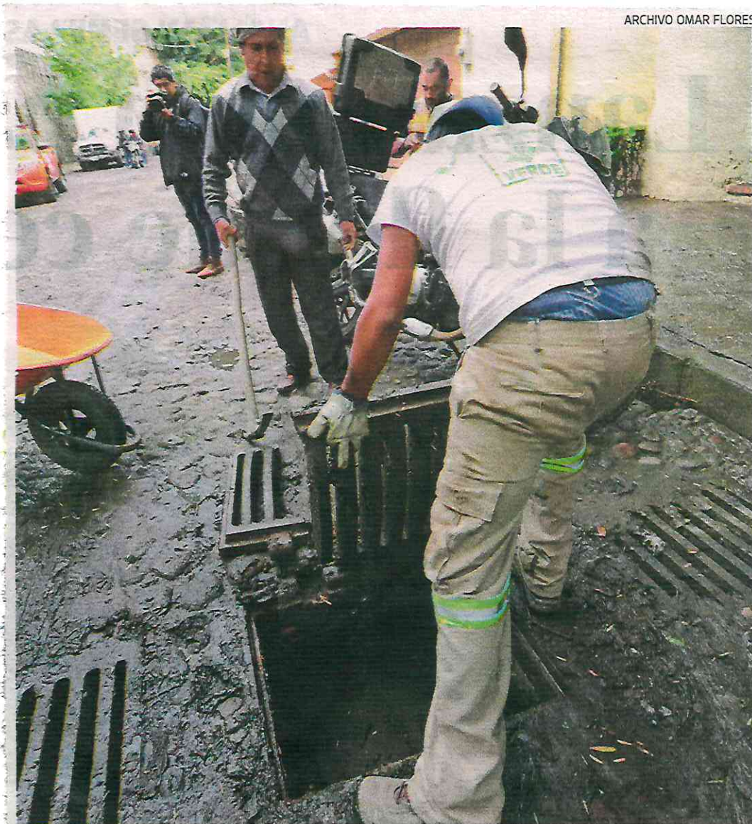
El semana pasada , el Sacmex hizo trabajos de limpieza y desazolve en la colonia Atlamava