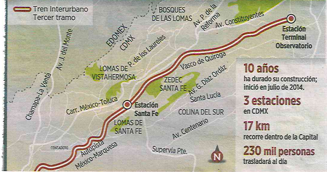
Gráfico: Julio López.

Originalmente, el Tren Interurbano corría sobre Vasco de Quiroga (ruta en el mapa) y únicamente tenía dos estaciones, la de Santa Fe y la Terminal Observatorio. Actualmente, su trazo va por las barrancas.