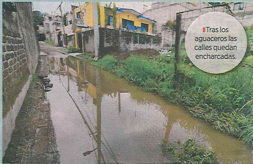
Tras los aguaceros las calles quedan encharcadas.

De acuerdo con habitantes, varias calles no cuentan con drenaje suficiente, por lo que las lluvias generan causales naturales que no siempre desembo-