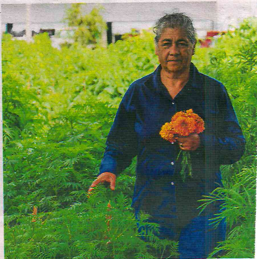
La Ciudad de México es el cuarto productor de cempasúchil a nivel nacional

En el proyecto, explicó, el organismo local puso los insumos y las instituciones la mano de obra, los reactivos para los laboratorios donde hacen las pruebas genéticas; la aportación del Tecnológico de Monterrey, por ejemplo, son los investigadores.