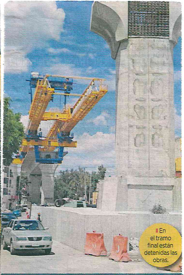
En el tramo final están detenidas las obras.

por donde desciende el Río Tacubaya, para evitar una tala masiva de arbolado fue necesario construir un puente atirantado de 600 metros de longitud, aún pendiente de conclusión y en cuya obra falleció un trabajador.