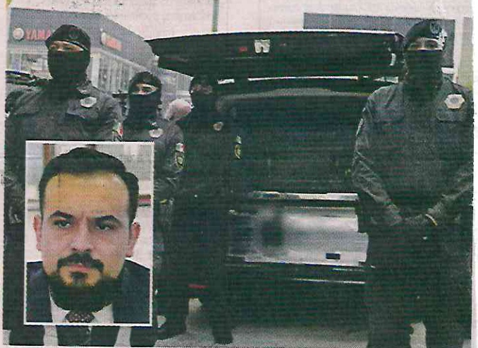
El Comisario, quien tenía su cargo investigaciones de alto nivel en la capital del País, fue despedido con honores.

tán en funciones, que ya están llamados a declarar y que se les mantiene vigilados.