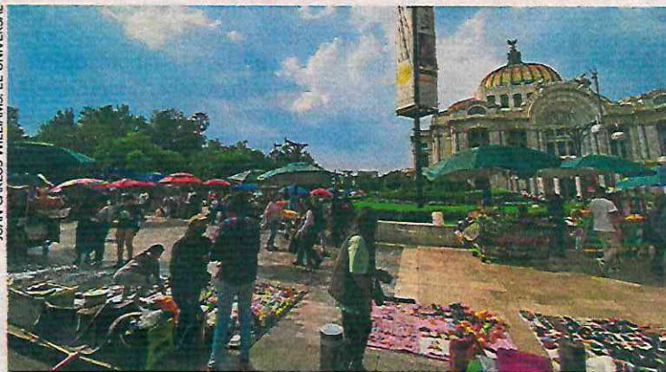
Ambulantes permanecen en la explanada de Bellas Artes y avenida Juárez, luego de que colocaran vallas metálicas en la Alameda Central.