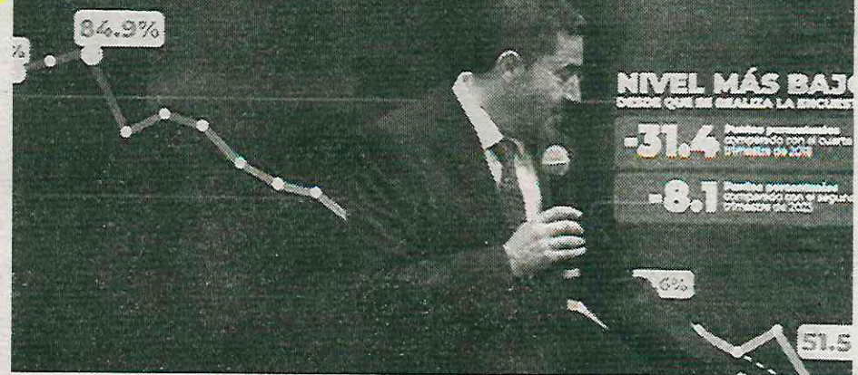
Resultados de la Encuesta Nacional de Seguridad Pública Urbana

¿CUÁNTOS DE LOS HABITANTES DE LA CIUDAD DE MÉXICO CONSIDERA QUE VIVIR ACTUALMENTE EN LA CIUDAD DE MÉXICO ES INSEGURO? (MAYORES DE 18 AÑOS QUE RESPONDEN "SI")