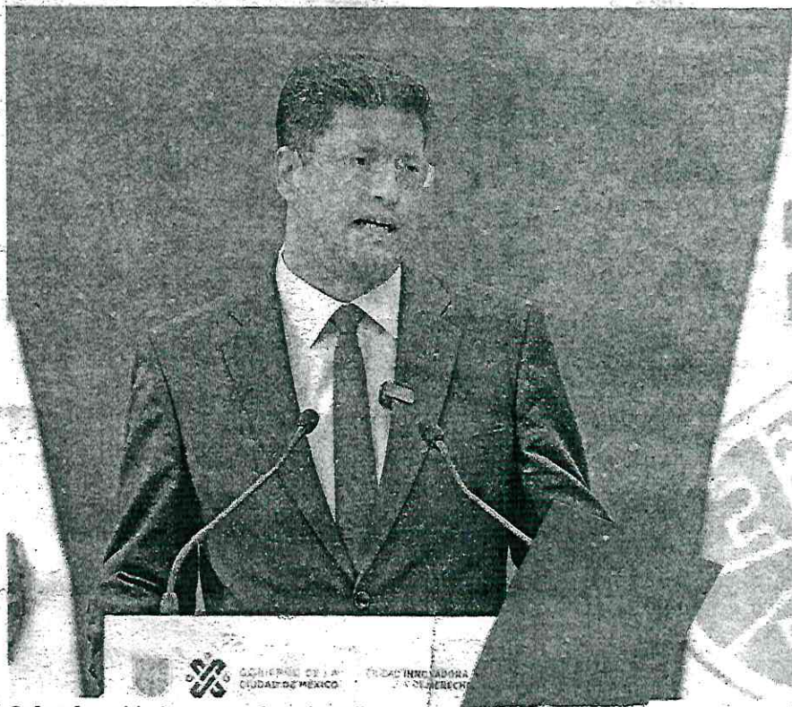
Sobre la unidad que encabezaba Milton Morales, Pablo Vázquez dijo que hay muchos perfiles muy capaces para asumir el mando

Vázquez Camacho detalló que en todas las investigaciones de este tipo se abren distintas líneas y se aborda temas como las declaraciones de los escoltas que ofrecían protección al mando asesinado.