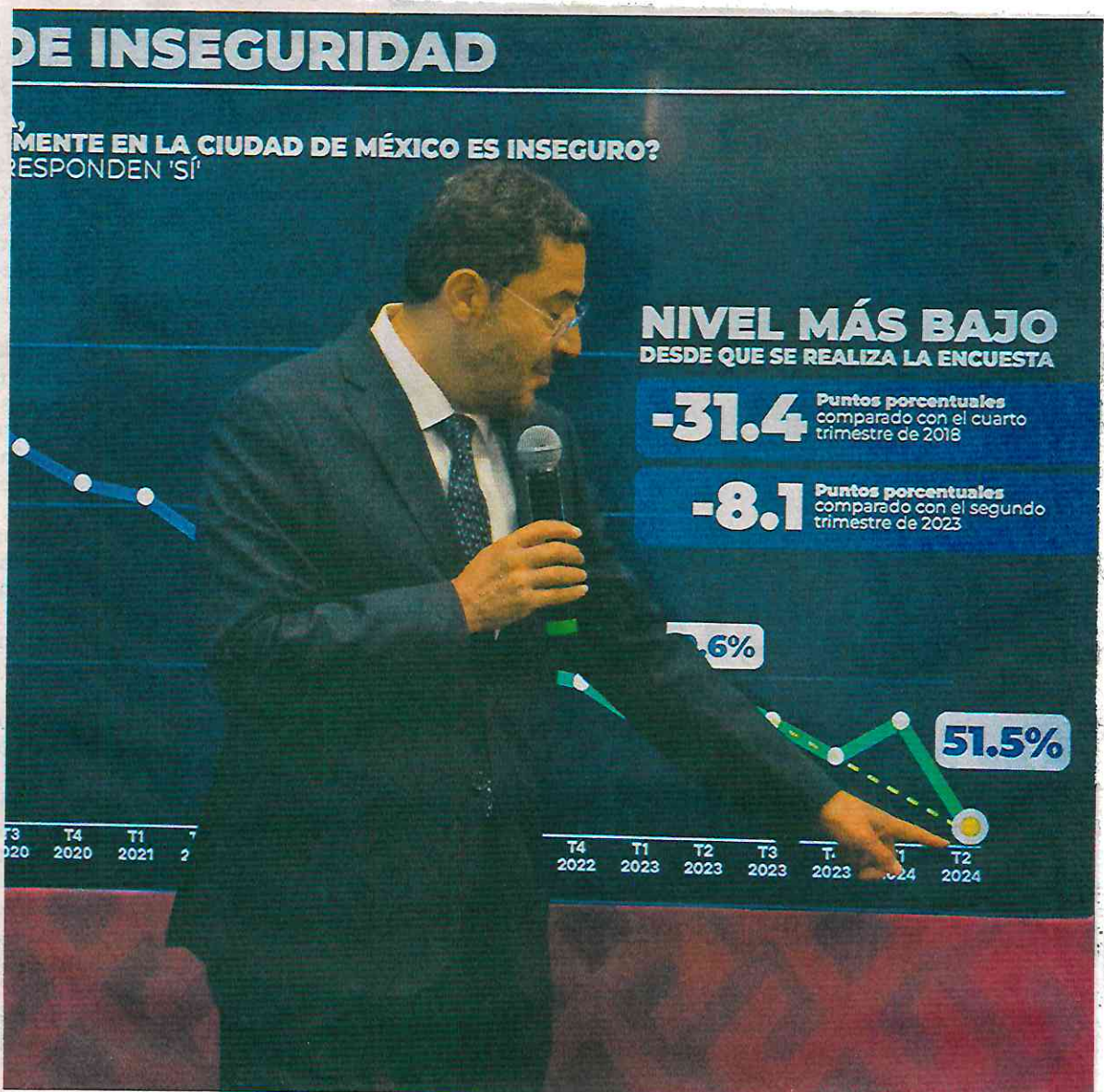
Martí Batres expuso que 42.6% de los capitalinos consideran que la inseguridad es el principal problema en CDMX.

“Es decir, que a la pregunta de ¿ha sido víctima de delitos? Tenemos el nivel más bajo de todo el sexenio y desde antes, incluso más bajo, por una décima, que cuando la pandemia en la que todos estábamos encerrados en nuestras casas”, concluyó el jefe de Gobierno. ●