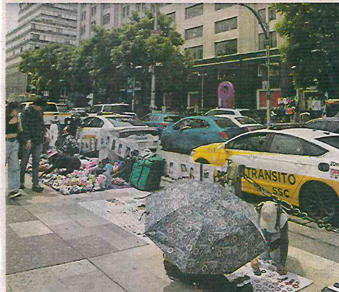
■ Pese al intento de las autoridades de contener el ambulante, algunos se colocaron ayer en la explanada de Bellas Artes.