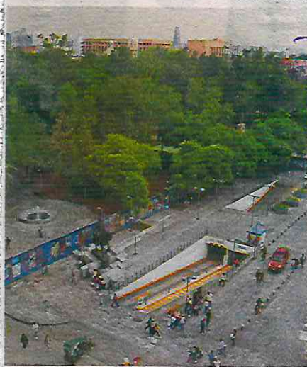
El gobierno colocó las vallas el lunes