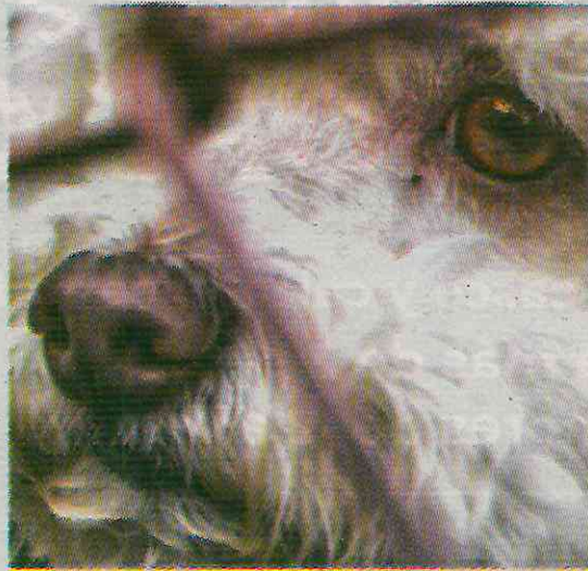
La edil dejó de lado el tema de sanidad animal

No obstante, la alcaldía precisó, a través de una solicitud de información, que no se cuenta con denuncia formal alguna sobre maltrato animal entre 2020 y 2023, pues afirmó que esta tarea es responsabilidad de la