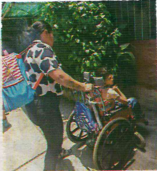
Padece síndrome de Lennon-Gastaut.