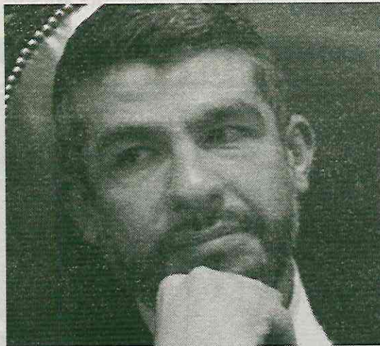
Ha olvidado a 19 mercados de la demarcación

Durante la reciente temporada de lluvias, los más de 240 locatarios del Mercado Escandón reclamaron que los trabajos realizados en 2023 durante la rehabilitación del sellado de cubierta de la techumbre, el mantenimiento de los canalones y bajadas de agua pluvial, cuyo costo fue de 4 millones de pesos, no sirvieron, pues se han reportado la pérdida de mercancía, derivado de las inundaciones y