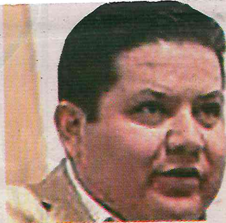
Fue alcalde con MC, pero ahora será con Morena

Los poblados donde la gente ha detectado el aumento de este delito son San Pablo Oztotepec y San Pedro Atocpan.