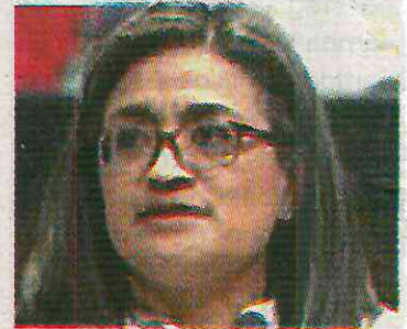
En octubre se convertirá en edil

Se pronunció a favor de eliminar el modelo de asilo en los centros psiquiátricos