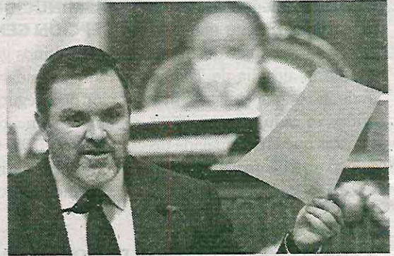
Tras resultados de ingreso a la UNAM e IPN