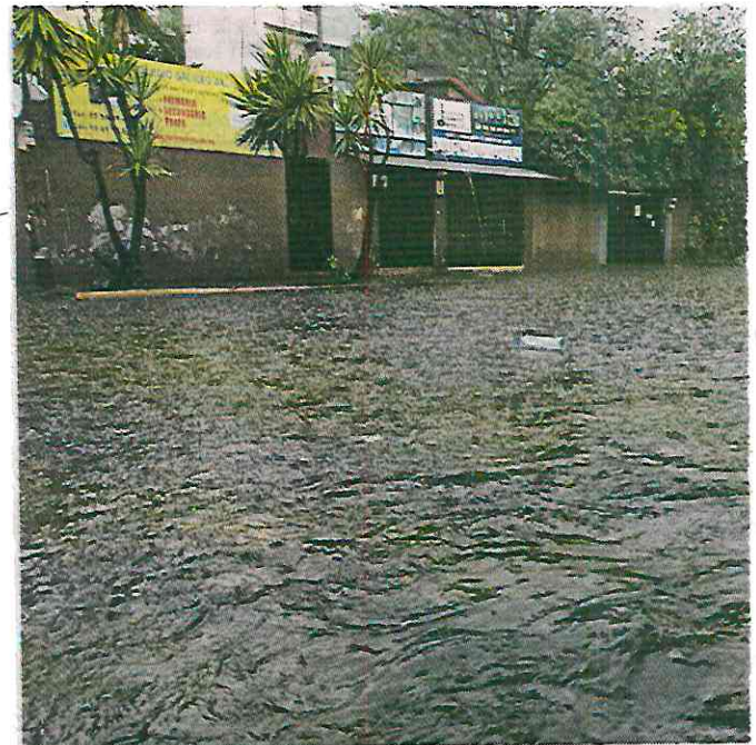
Vecinos de Lomas de Padierna detallaron que desde hace 6 años padecen de inundaciones en temporada de lluvias.

“Dijeron que, como son resumideros los que tenemos, iban a hacer coladeras nuevas”.