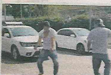
■ Finalmente hubo un ganador.