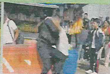
■ Dos veces cayó el agente.