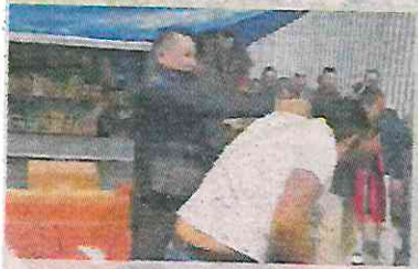
■ Cómo pudo se defendió.