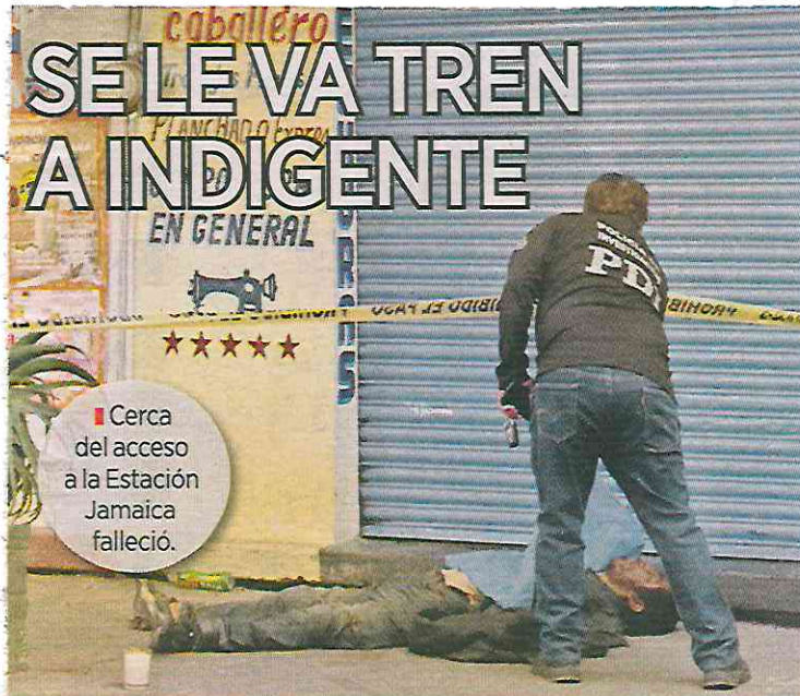
■ Cerca del acceso a la Estación Jamaica falleció.