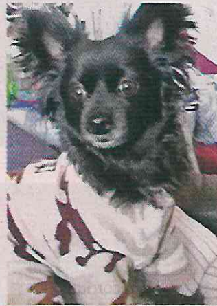
La perrita sufrió golpes y heridas de arma blanca.

Aunque la afectada considera que esas son pruebas suficientes para llevar el caso