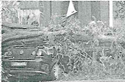
Hay casos en los que se han pagado hasta 90 mil pesos por daños a vehículos.