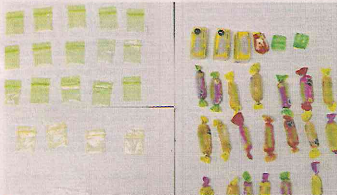
La posible cocaína estaba en envolturas de caramelos.

Esta vez ingresó a la escuela con una tira de materias a nombre de otra persona para poder seguir comercializando la droga y fue descubierto mientras intercambiaba con alumnos dinero por lo que parecían ser