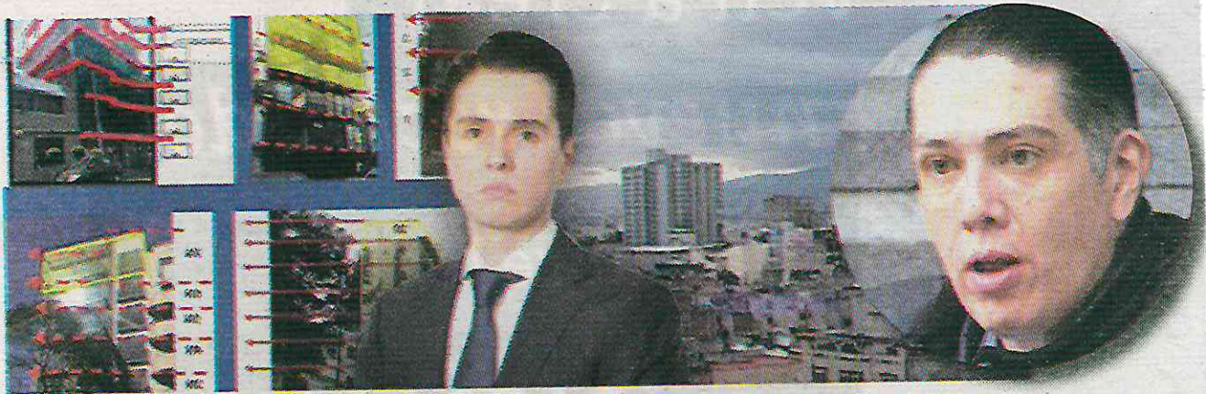
Se ha convertido en un visitante frecuente de la alcaldía BJ, ahora que su hermano es edil

El hermano del nuevo alcalde de BJ, se integrará como posible asesor, después de llegar a un acuerdo millonario