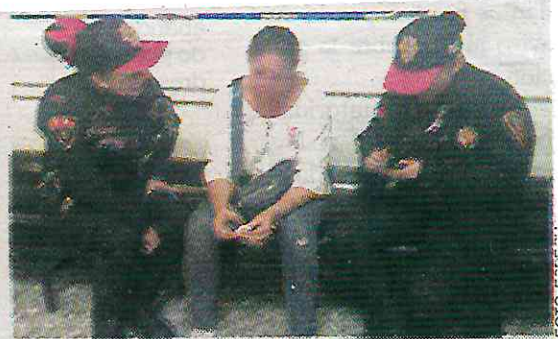
Mujeres policías la tranquilizaron

Por lo anterior, personal del programa "Salvemos Vidas" del