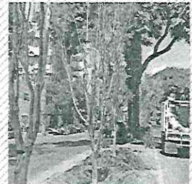
Las alcaldías y el gobierno central están a cargo de los árboles.