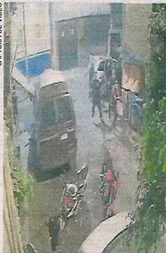
Sujetos balearon un domicilio en la alcaldía Iztapalapa.

Consta en los registros de las cámaras de videovigilancia que un grupo de sujetos se encontraba en inmediaciones de dichas calles, cuando observaron que varias personas descendían de un vehículo con armas largas y cortas, mismas que accionaron.