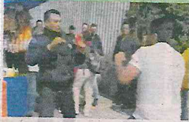
■ A mano limpia se dieron.

En la vía pública se trenzaron a golpes el civil y un agente.