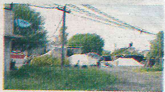
· Dar servicios básicos es el paso para regularizar

Proporcionar servicios básicos en terrenos secuestrados por invasores en áreas como La Ciénega y Tempiluli, el siguiente paso sería la regularización de estos predios, lo que pondría en riesgo el medio ambiente y la sustentabilidad hídrica de la capital. “Lo que buscan los invasores es más que conseguir una vivienda de forma clandestina; es acabar con