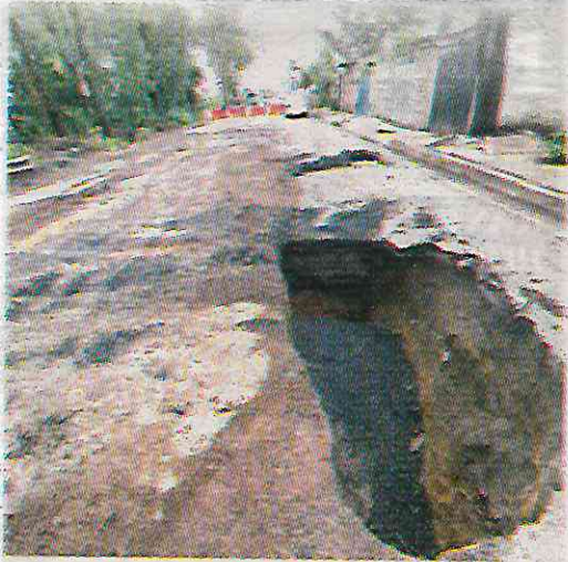
Se reporta el surgimiento de socavones