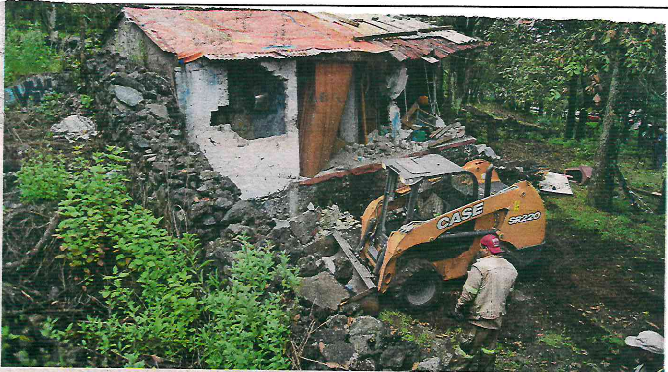
El gobierno capitalino demolió el martes dos viviendas irregulares ubicadas en el kilómetro 7+200 de la Picacho-Ajusco

toriales, y donde viven 700 mil personas.