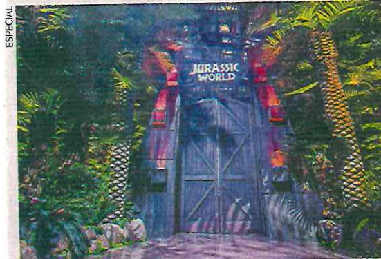
La pieza fue robada luego de concluir la exhibición Jurassic World en la plaza Perisur.

Una vez que el agente del Ministerio Público de la Fiscalía de Investigación Territorial en Coyoacán, de la Coordinación General de Investigación Territorial tuvo conocimiento del caso, ordenó la intervención de detectives de la Policía de Investigación (PDI) para llevar a cabo las indagatorias correspondientes en el lugar, como la ubicación de posibles testigos y de cámaras de videovigilancia. ●