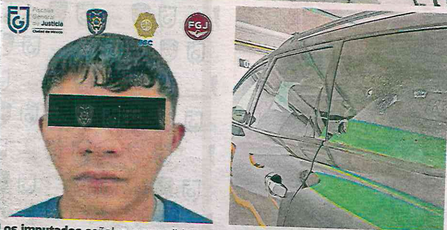
Los imputados señalan que recibieron amenazas y que en caso de no cooperar con lo que ellos querían, los iban a chingar bien y bonito