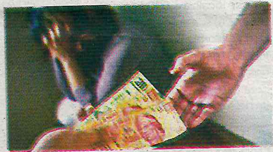
El 21% de los tratantes son familiares de la víctima

El reporte destaca que el 51.3% de los casos de trata son por prostitución y otras formas de explotación, y el 25% por trabajo o servicio forzado.