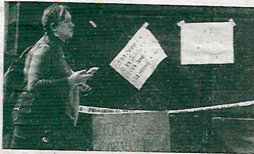
Superior con clave "Sombra"