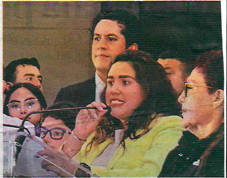
La alcaldesa electa en el Senado y la ex candidata durante su concentración en la explanada de la alcaldía.