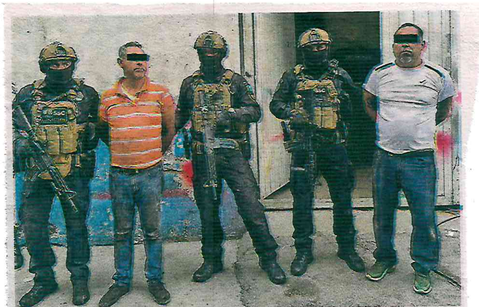
Se les aseguraron autopartes, engomados, placas de automóviles, así como un arma de fuego y un teléfono celular

Fueron policías de inteligencia, en coordinación con agentes de la Fiscalía General de Justicia de la Ciudad de México y personal de la Unidad Metropolitana de Operaciones Especiales, los que realizaron un operativo y cateo en un inmueble localizado en Fray Francisco de Frejes, Vasco de Quiroga, en la Alcaldía Gustavo A. Madero.