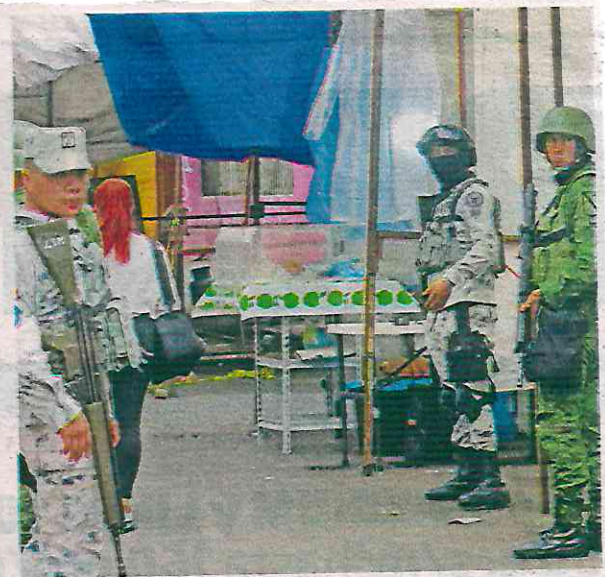
Al lugar arribaron elementos del Ejército para brindar el apoyo a los familiares que aparentemente habían sido golpeados por elementos de la SSC