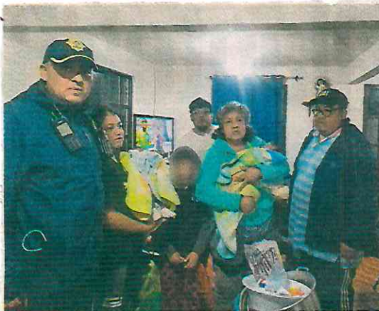
Autoridades auxiliaron a la familia atrapada en su casa por la caída de una barda. No hubo heridos.