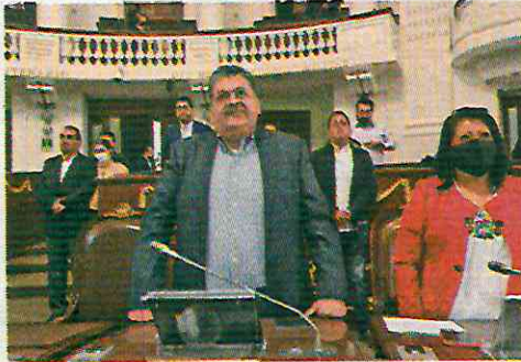
● HONOR. Guardaron un minuto de silencio.