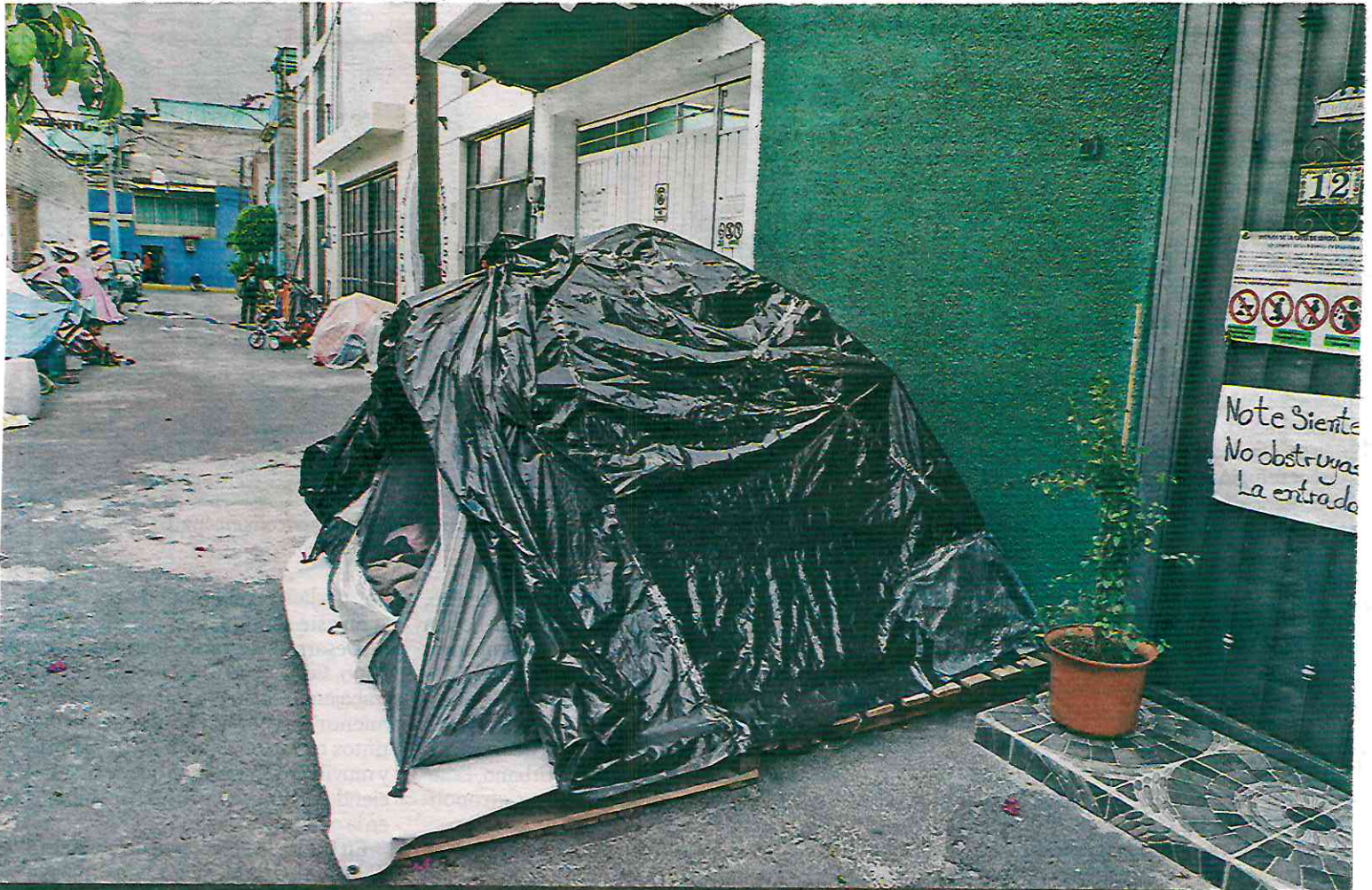
ESPERAN UN TECHO. En plena temporada de lluvias, en el callejón del albergue "Arcángel Rafael" se observan casas de campaña de migrantes venezolanos que están a la espera de un refugio seguro, mientras parten a la frontera norte CDMX P. 6

TRABAJAN EN LOS MERCADOS Y NEGOCIOS AMBULANTES POR 100 PESOS DIARIOS