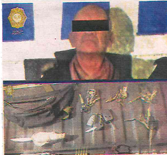
El detenido fue presentado, junto con lo asegurado, ante el agente del MP

Por tal motivo, el hombre de 59 años de edad fue detenido, se le informaron sus derechos de ley y, fue presentado, junto con lo asegurado, ante el agente del Ministerio Público, quien determinará su situación legal y se encargará de iniciar la carpeta de investigación correspondiente.