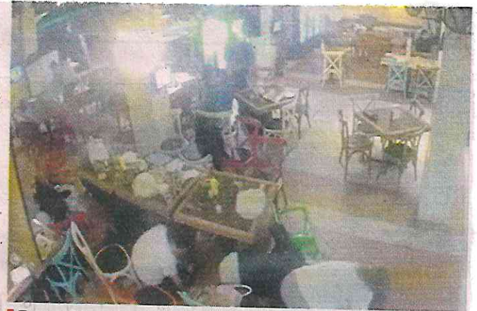
En un video quedó registrado el asalto al restaurante en GAM.