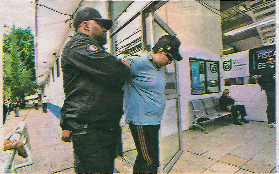
El detenido fue llevado a la Fiscalía de Investigación Estratégica General

El modo de actuar del hombre fue grabado por un automovilista que mostró la