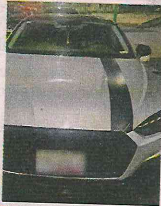
Los presuntos asaltantes huyeron en un auto gris.

En las calles Flor de Lis y Bugambilia, de la Colonia