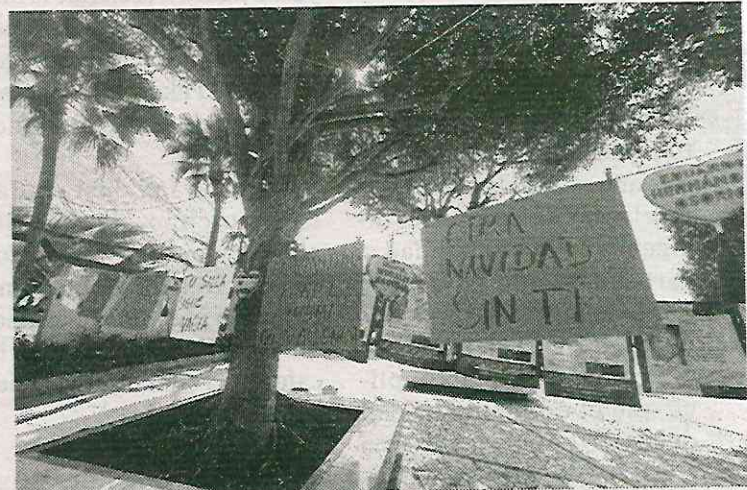
Exigen atención de las autoridades

Estuvieron presentes también familiares de víctimas de feminicidios