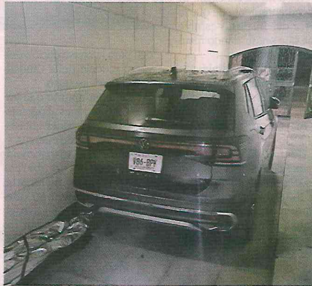
El vehículo permanecía en la cochera de una vivienda.