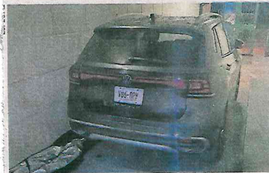
Elementos de la SSC atendieron la llamada de auxilio de una mujer, quien encontró a su hermano en el auto.

Como parte de las indagatorias se realiza el análisis de las cámaras de seguridad de la vivienda y las aledañas; en las primeras imágenes captadas se observan varias personas que entraron al domicilio de las víctimas, aparentemente eran conocidos, pues no se vio nada forzado ni había huellas de robo dentro del domicilio; los familiares dijeron que ahí mismo tendrían distintas reuniones con motivos navideños. ●