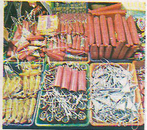
Los operativos solo se realizan en fin de año

Esto también implica multas de 11 a 40 Unidades de Medida y Actualización UMA's, lo que equivale de mil 194.27 a 4 mil 342.8 pesos, como lo marcan las infracciones Tipo B o arresto de 13 a 24 horas o trabajo en favor de la comunidad de 6 a 12 horas. Mientras que las multas Tipo C señalan infracciones de 21 a 30