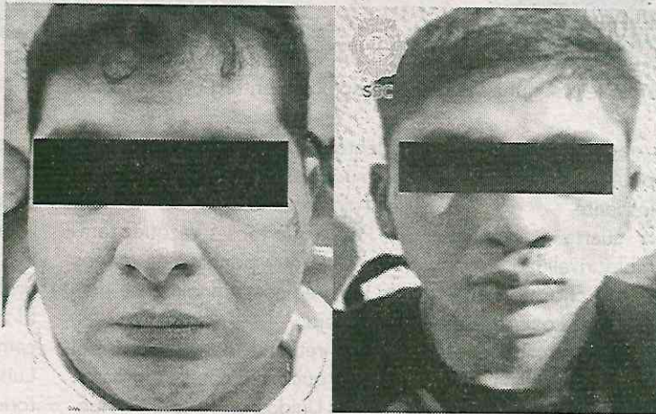
Les espera un largo tiempo tras las rejas

El asesino escapó a bordo de un auto Mazda color vino, el cual encontraron volcado en la calle Mártires de Tacubaya, donde lo detuvieron y le hallaron un arma de fuego corta, un cargador abastecido con dos cartuchos útiles y dos teléfonos celulares.