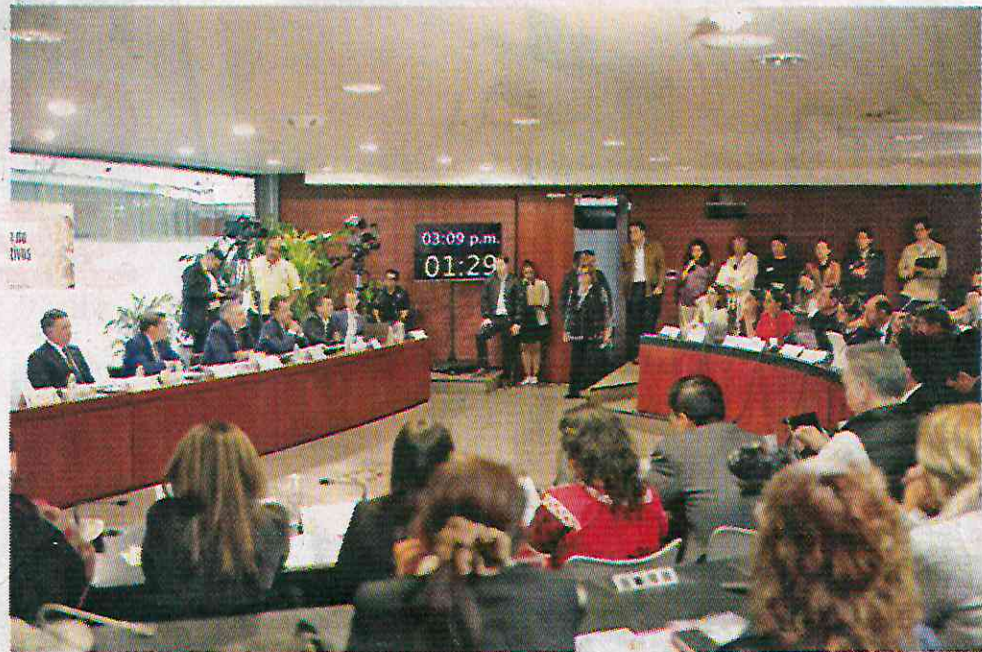
Con 24 votos a favor y 10 en contra, las comisiones unidas de Puntos Constitucionales y Estudios Legislativos aprobaron el dictamen para hacer inatacables las reformas a la Carta Magna.

El martes, la propuesta de reforma morenista presentada en el Senado por Adán Augusto López desató críticas y preocupaciones que se reflejaron en redes sociales, porque además de impedir que se impugne la Constitución, prohibía a la Suprema Corte de Justicia de la Nación (SCJN) que atendiera las impugna-