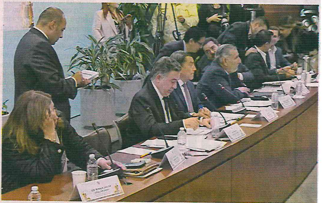
Las Comisiones Unidas de Puntos Constitucionales y Estudios Legislativos del Senado aprobaron el dictamen que anula la posibilidad de impugnar reformas constitucionales.

A pesar de que había sostenido que era "imposible" que el dictamen fuese revisado por el pleno en la sesión agendada para hoy, y que "los albazos se murieron cuando se murió el viejo régimen del PRIAN", el senador Adán Augusto López, coordinador de la bancada morenista, terminó por avisar que siempre