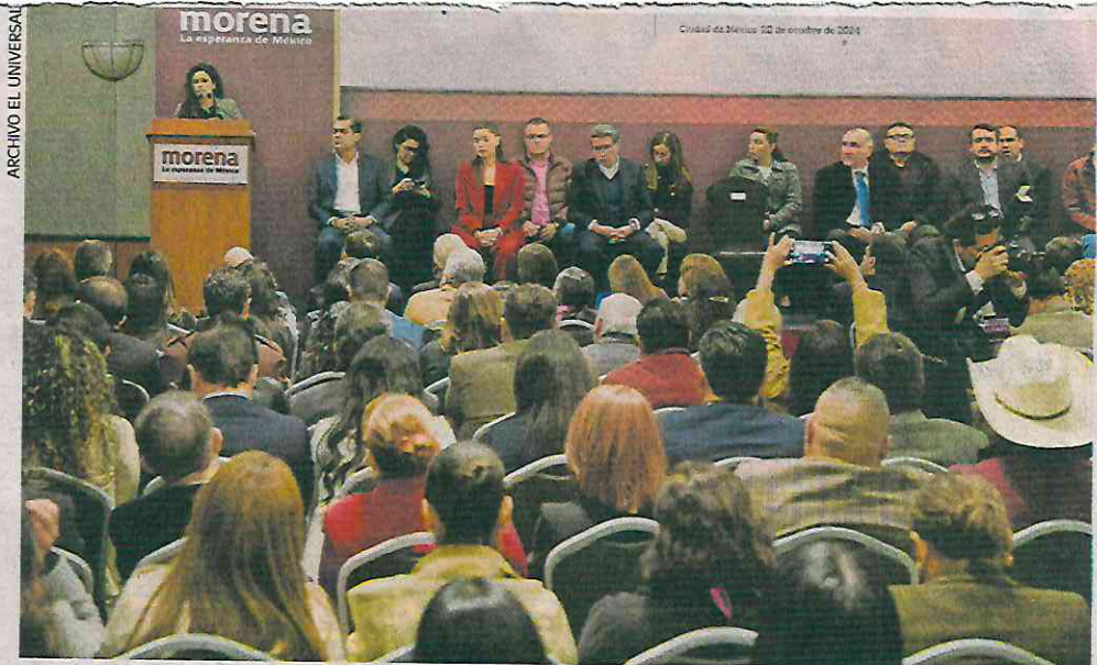
El plan fue presentado el pasado lunes por Luisa María Alcalde, dirigente nacional de Morena.

plenaria del pasado 22 de octubre, cuando se definió la realización de asambleas en las principales localidades de los 300 distritos de los 32 estados, que serán encabezadas por legisladores federales de Morena.