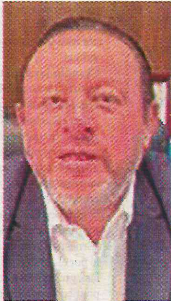
Edil de La Magdalena Contreras

Este desinterés por la infraestructura educativa de la demarcación, contrasta con los dos primeros años del gobierno del priista, pues en 2022 utilizó 24 millones y medio de pesos para este mantenimiento, y en 2023 fueron