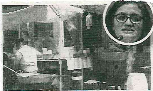
Exigen a Alavez recuperar la zona