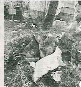
Ubicado en la avenida Constituyentes