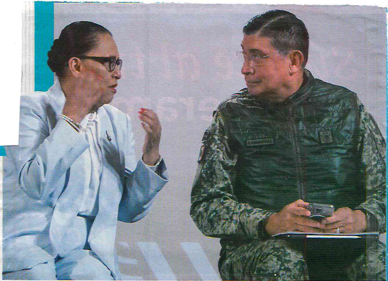
• LABOR. La titular de Seguridad federal, Rosa Icela Rodríguez, aseguró que no habrá impunidad en el caso.