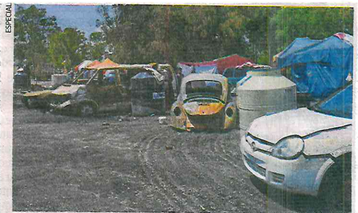
El 1 de julio se registró un incendio en un asentamiento irregular que consumió 17 viviendas precarias y varios vehículos.

drocarburo que han tomado los especialistas, el cual ha aparecido en la vía pública, en las coladeras, así como en el drenaje, les ha permitido establecer a las autoridades que no existe peligro para la población.