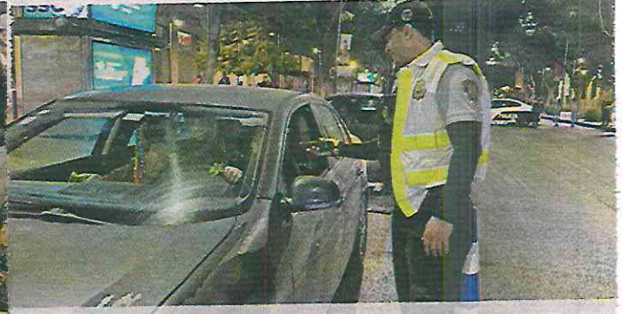
Las puntos de revisión se duplicaron de 10 a 20, en sitios clave y de ubicación aleatoria.