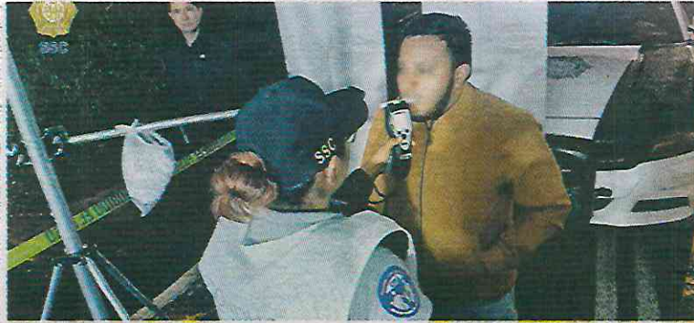
Del 18 de julio al 25 de agosto se refuerza la aplicación del alcoholímetro.