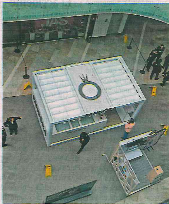
Los trabajadores mencionaron a los efectivos policiales que faltaban cinco pulseras de plata con un valor aproximado de dos mil pesos

Por este motivo autoridades en coordinación con operadores del Centro de Comando y Control (C2) ya se encuentran realizando al presunto responsable.