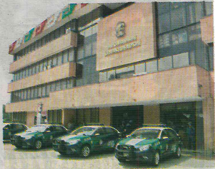
Tuvo que intervenir la GN

● Las propuestas de Núñez son evaluaciones a la policía, ampliar los módulos de seguridad y las cámaras de videovigilancia