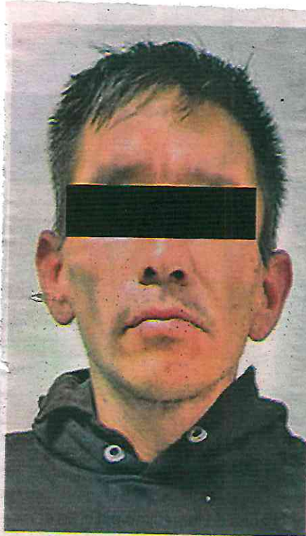
El detenido cuenta con dos ingresos al Sistema Penitenciario de la CdMx