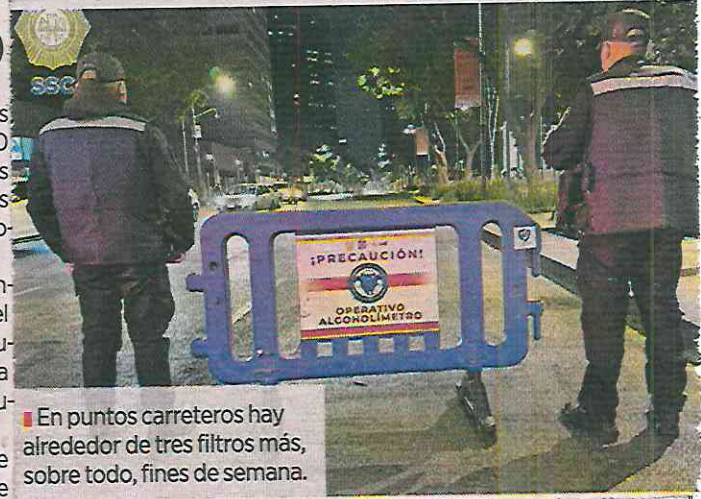
En puntos carreteros hay alrededor de tres filtros más, sobre todo, fines de semana.

Esperan que los próximos días de asueto las remisiones bajen porque hay menos circulación y es una temporada en la que el número de infractores por conducir alcoholizados es menor a diferencia de otras temporadas vacacionales, como Semana Santa y decembrina.