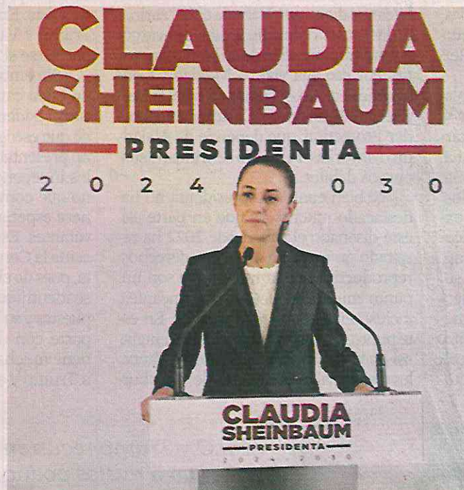
■ Claudia Sheinbaum, virtual Presidenta electa, dijo ayer que mantendrá la austeridad sin afectar programas.

“Tampoco estamos programando endeudamiento importante, es decir, prácticamente los propios vencimien-