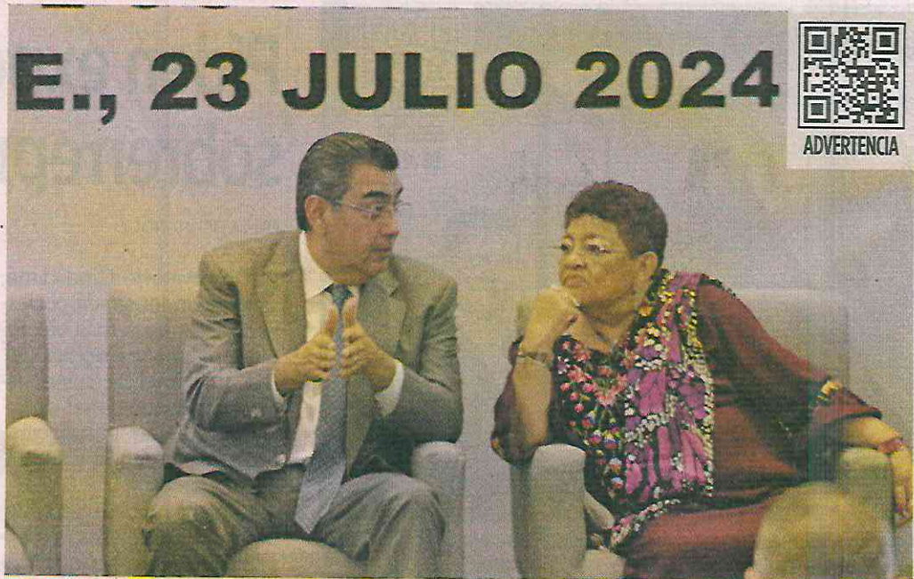
EN TRIBUNA. Ernestina Godoy, futura consejera jurídica de Presidencia y el Gobernador morenista de Puebla, Sergio Salomón, participaron en el análisis de la reforma judicial.

Frente a la incertidumbre de qué pasará con el personal actual, planteó que Jueces y Magistrados puedan participar en la elección con pase directo, lo que modificaría la iniciativa presidencial, que plantea su destitución cuando fueran electos los nuevos Jueces y Magistrados.