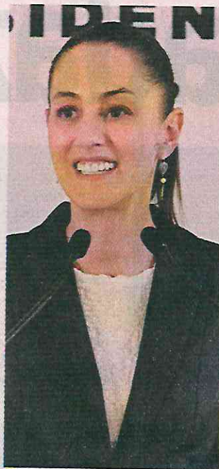
Sheinbaum, ayer en su conferencia matutina.

"Va a cerrar bien el presupuesto y para el próximo año es un presupuesto razonable y que guarde todos los indicadores macroeconómicos, que no genere ningún riesgo, evidentemente, ni mayores déficits presupuestales", prometió.