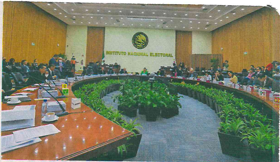
Los informes de Fiscalización del INE indican que el PAN y PRD capitalinos fueron los únicos en incumplir con la entrega de recursos para las campañas de sus candidatas.

Y continúa: “El cobro de las sanciones se extenderá por el número de meses que sean necesarios para cubrir el monto total de dichas sanciones impuestas al partido político en la resolución de mérito”. ●