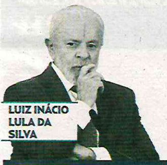
LUIZ INÁCIO LULA DA SILVA

› Invitación a una visita de Estado a Brasil recibió la presidenta Claudia Sheinbaum por parte de su homólogo Luiz Inácio Lula da Silva . Ayer, en charla telefónica, hablaron de cultivar relaciones productivas con todos los gobiernos de América, incluido el de Donald Trump en EU, y fortalecer la CELAC. El carioca expresó que una gira de la mexicana allá servirá para dar impulso "al excelente momento que atraviesa la relación bilateral". Ella le agradeció y aseguró que fortalecerán la relación.