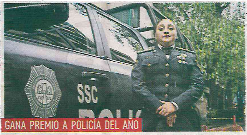
GANA PREMIO A POLICÍA DEL AÑO

Dijo que para atender los delitos con perspectivas de género, además de los seis meses en la Universidad de la Policía, ha tomado cursos “para comprender las relaciones entre las mujeres y los hombres”; “nos enseñan a identificar quién sufre desigualdad de género y exclusión”, señaló.