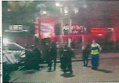
Imagen/Captura de vídeo

Los testigos del ataque informaron a los oficiales que un sujeto discutió con los afectados y realizó las detonaciones en su contra, después emprendió la hui-