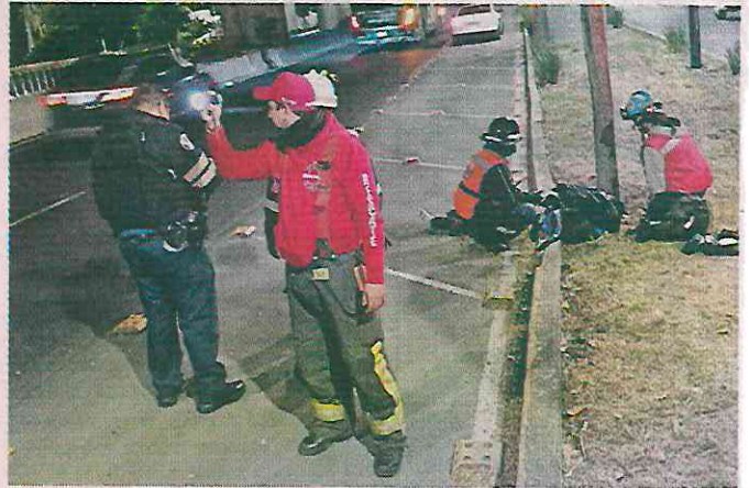
■ El peatón fue embestido a la altura de Periférico Sur, en la Colonia Huipulco, Alcaldía Tlalpan. El conductor huyó.

Minutos después acudieron policías preventivos del Sector Huipulco-Hospitales y paramédicos de Protección