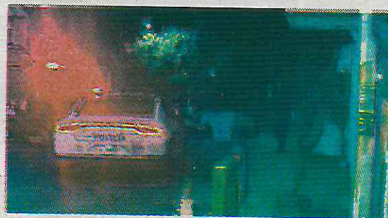
Noche violenta en Tlalpan

El doble asesinato ocurrió en la carretera Picacho-San Ajusco, esquina con la calle de Venusia, en la colonia Belvedere, donde se encontraban las dos víctimas, cuando llegaron