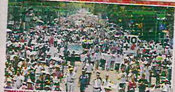
Expulsa Sicilia en el Zócalo al Presidente Calderón