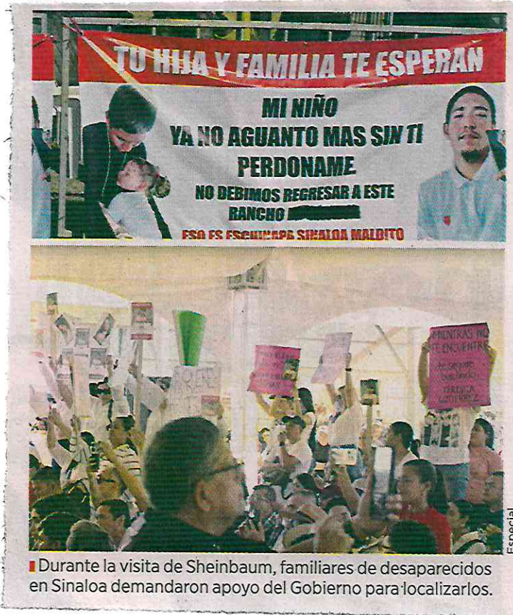
■ Durante la visita de Sheinbaum, familiares de desaparecidos en Sinaloa demandaron apoyo del Gobierno para localizarlos.