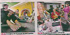
Crónicas: Primavera etíope