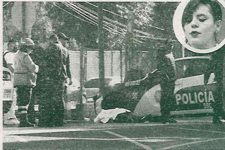
Los operativos para reforzar la vigilancia han fracasado

Del mismo modo, la ciudadanía acusó la falta de actuar por parte de los elementos de seguridad, pues afirmaron que los policías adscritos a la demarcación no realizan su labor; sin embargo, sí entorpecen la movilidad de la zona.