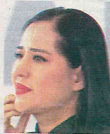
Criticó a su antecesora

Este argumento fue para pedir un aumento del 10.6 por ciento del presupuesto de 2024