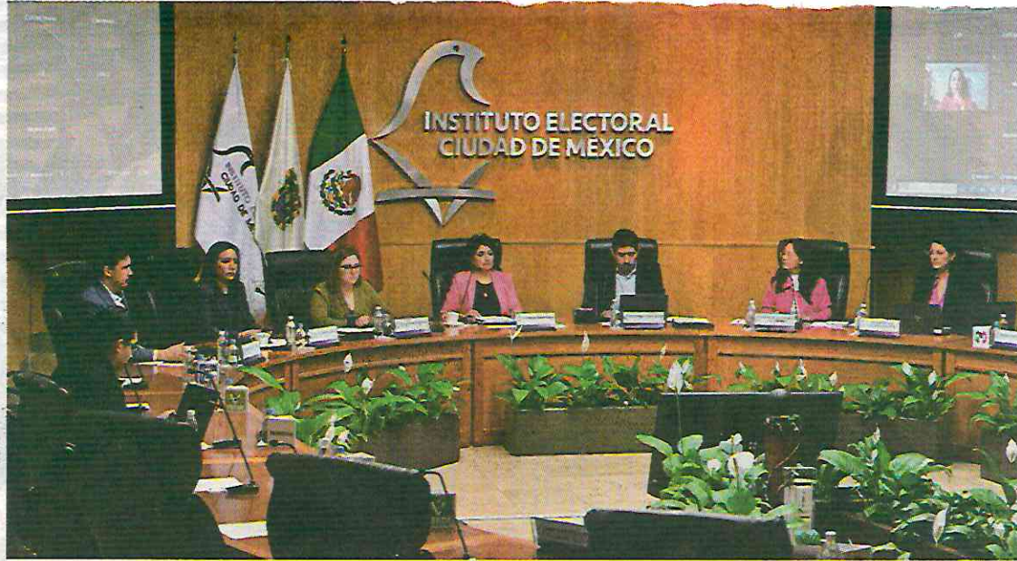
Sesión en el Instituto Electoral de la Ciudad de México.

consultas ciudadanas y el financiamiento público de partidos políticos.