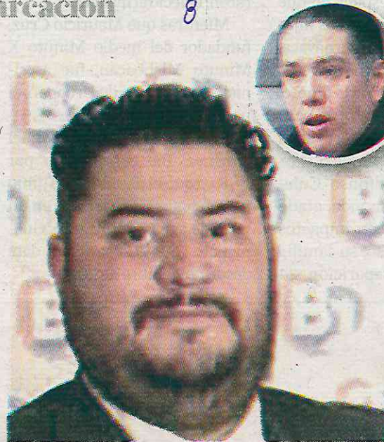
Se pagan 42 mil 593 pesos al mes