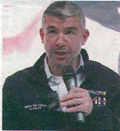
Fue de 3 mil 2 millones de pesos para 2025