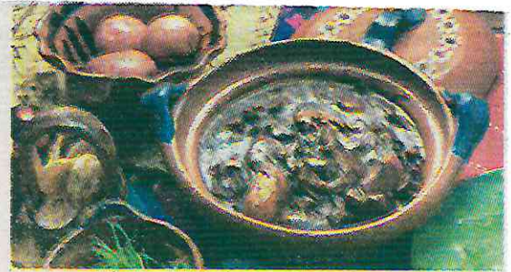
Insumos producidos en alcaldías agrícolas

La legisladora enfatizó que la Ciudad de México, es una de las pocas metrópolis que puede autoalimentarse gracias a su vasta zona rural, que produce alimentos frescos durante todo el año. Además, recordó que las alcaldías agrícolas como Xochimilco, Tláhuac y Milpa Alta, son altamente productivas y ofrecen una gran variedad de productos como maíz, frijol, nopales, calabaza, jitomate y hierbas, los