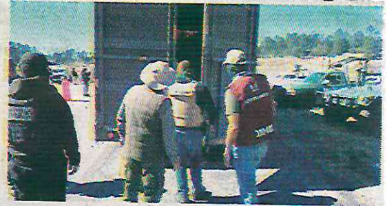
Aseguraron un tractocamión con madera

También se detuvo a un hombre en San Miguel Topilejo por talar un árbol ilegalmente con una sierra eléctrica. Otro individuo fue