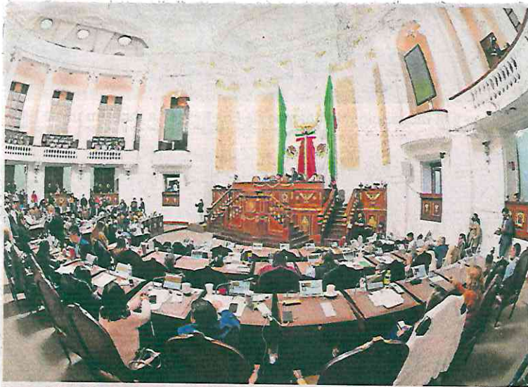
La sesión del Congreso capitalino iniciaría este lunes y se alargaría hasta las primeras horas del 24 de diciembre, indicaron varios legisladores.