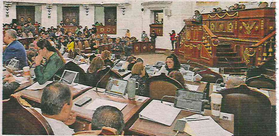
El Congreso de la Ciudad de México aprobó el dictamen a la iniciativa del jefe de Gobierno, Martí Batres Guadarrama

El documento que en su momento fue discutido por los legisladores que conforman las Comisiones Unidas de Administración y Procuración de Justicia y de Planeación del Desarrollo del recinto de Don-