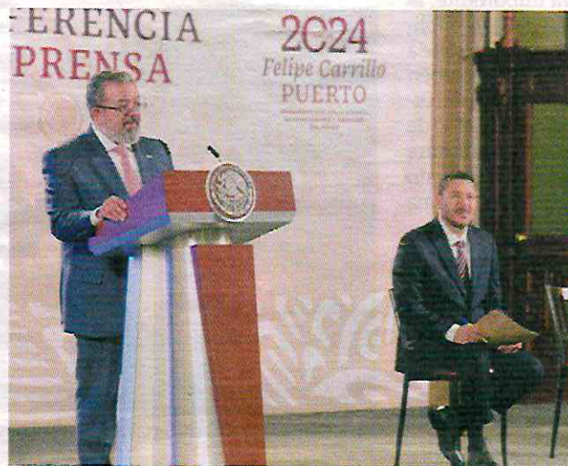
EL SECRETARIO Jorge Nuño y el Jefe de Gobierno, ayer.

EL PRESIDENTE anticipa que el titular de la SICT continuará en el Gobierno, en la administración de Claudia Sheinbaum; "el agradecido soy yo por la confianza", responde el funcionario