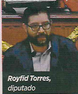
Royfid Torres, diputado

A propuesta de la Comisión de Administración y Procuración de Justicia, se aprobó la modificación de diversos ordenamientos jurídicos necesarios para la homologación del Código Nacional de Procedimientos Civiles y Familiares a la legislación local.