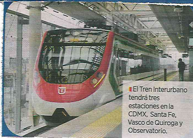
El Tren Interurbano tendrá tres estaciones en la CDMX, Santa Fe, Vasco de Quiroga y Observatorio.

"Va a quedar pendiente para que se termine, pienso, a finales de este año ya todo el tramo", estimó.