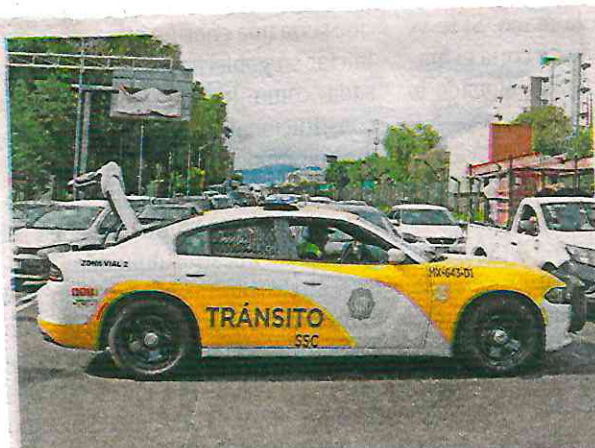
Las patrullas que compran las alcaldías se tienen que diseñar, pintar y balizar con los colores de la policía capitalina

El jefe de la policía mencionó que reconocen de muy especial al Personal Especializado en Género y en funciones de inteligencia, que han realizado acciones en favor de la ciudadanía afectada, también a aquellos que han realizado estas labores por las intensas lluvias de las últimas semanas.