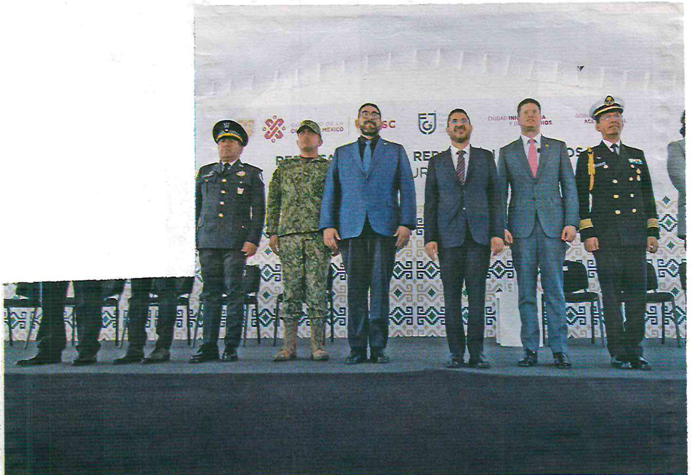
• DESEMPEÑO. El jefe de Gobierno encabezó la entrega de reconocimientos a elementos de la SSC-CDMX.