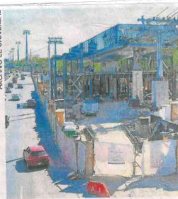
La L3 saldrá de la estación Los Pinos hasta Santa Fe.