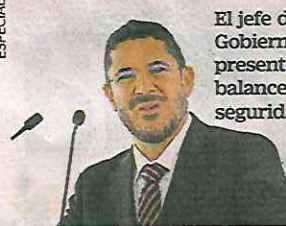
El jefe de Gobierno presentó un balance en seguridad.

linos, Batres Guadarrama resaltó que en el sexenio pasado este delito se había disparado “como nunca antes”, pero que actualmente, se encuentra en una disminución histórica.