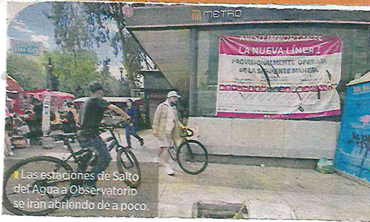
Las estaciones de Salto del Agua a Observatorio se irán abriendo de a poco.

"Está lo de Línea 9 también, lo tenemos ahí anotado, entre otras obras que se van a estar inaugurando en próximos días", agregó Batres.