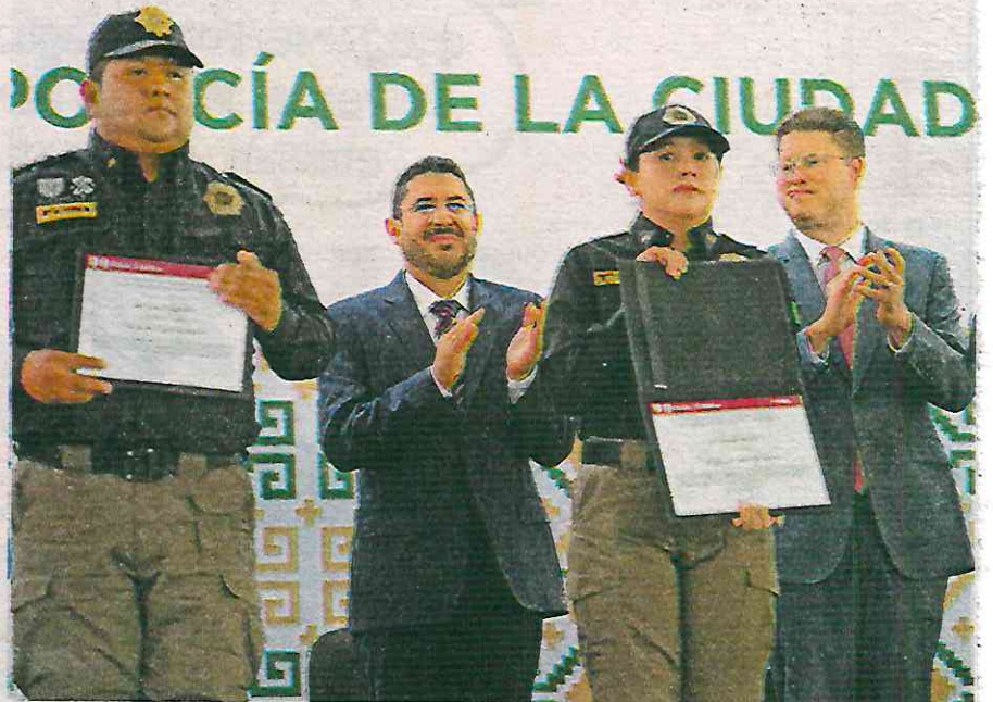
Martí Batres destacó que hay una baja histórica en robo de vehículo con violencia de 68.8 por ciento entre julio de 2019 y julio pasado

Sobre los homicidios dolosos, el jefe del Ejecutivo local dijo que hubo una disminución, en el mismo lapso de tiempo de menos 46 por ciento con un promedio de 2.1 homicidios diarios frente a casi 4 por ciento que se tenía casi al comenzar la administración.