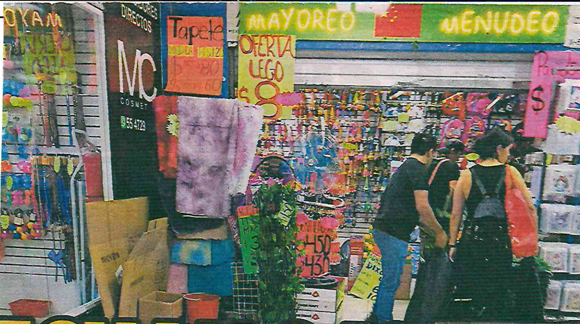
Autoridades han puesto bajo la lupa operación de bodegas en el Centro.