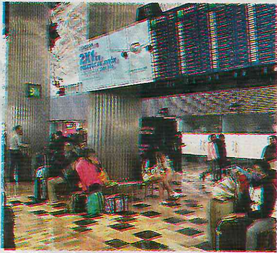
Proliferan ofertas engañosas

Ante el incremento de fraudes durante la temporada vacacional y los próximos Juegos Olímpicos de París, el Consejo Ciudadano para la Seguridad y Justicia de la Ciudad de México ha emitido un conjunto de recomendaciones para proteger a los viajeros de los llamados "montaviajes".