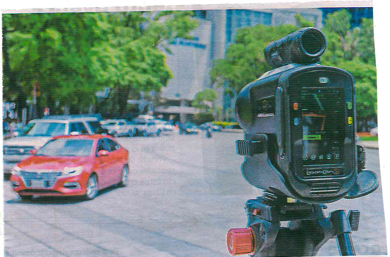
Este radar móvil se instala en las vialidades con más incidentes de tránsito, como Insurgentes Sur, o el Eje 1 Norte