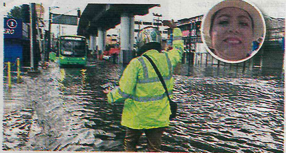
A Hernández Calderón no le importa que la gente sea la que sufra esto

El gobierno de la morenista informó que, en el primer trimestre de este año, los vecinos presentaron 360 peticiones de desazolve, de las cuales 237 se