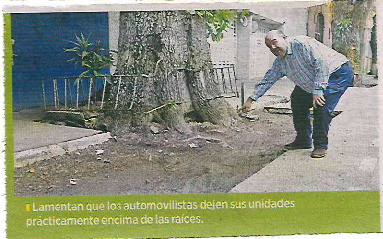
■ Lamentan que los automovilistas dejen sus unidades prácticamente encima de las raíces.

Entonces, el Gobierno capitalino hizo nuevamente las delimitaciones para los cajones de estacionamiento, pero sin resguardar a los ejemplares de fresno y dejó sus raíces expuestas. Estos ejemplares existen desde aproximadamente 1910.