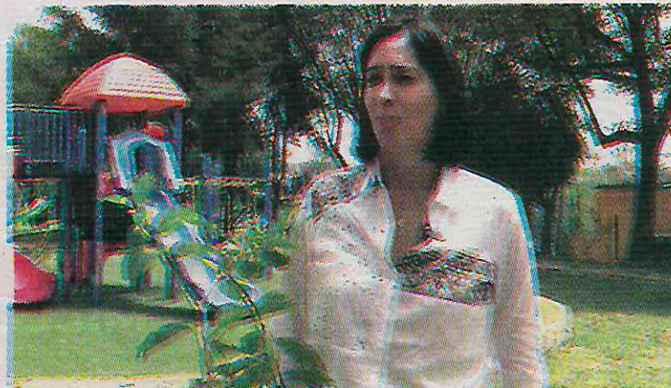
No desarrolló el mantenimiento de infraestructura pública

Sin embargo, esta no es la primera vez que se reporta la caída de árboles en la alcaldía, puesto que el pasado mes de marzo, un ejemplar de 8 metros de alto se